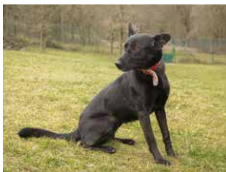
ALLIE. / foto: útulek

SÁMER – kříženeček jezevčička, zhruba osm let, velmi vhodný k domku se zahrádkou, ke starším lidem, v útulku je Sámer již dva roky