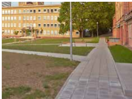
Chodníky jsou pro město prioritní.

Chodníky, ale i parkovací místa a cyklostezky budou letos vznikat i v rámci regenerací panelových sídlišť, například na Podhoří nebo v Malenovicích. „Řešit zde budeme i odpočinkové plochy, zeleň nebo sportoviště,“ vyjmenoval Karel Říha , vedoucí Odboru koncepce a realizace dopravních staveb magistrátu. [dvo]