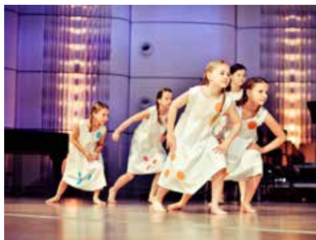
Bude se tancovat....