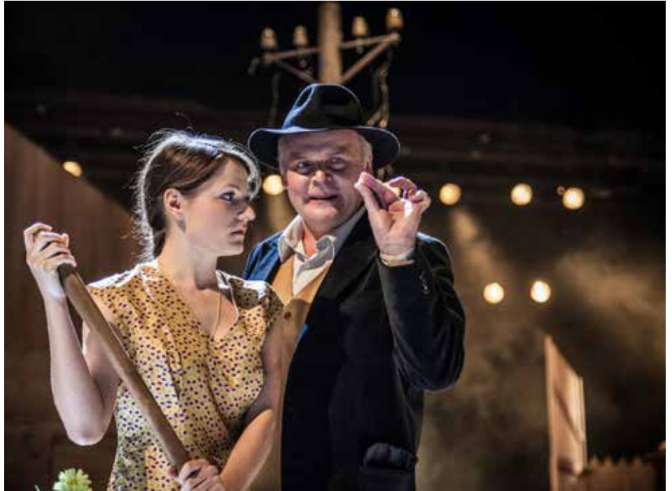
Národní divadlo Brno s inscenací Je třeba zabít Sekala.

Muzeum jihovýchodní Moravy ve Zlíně připravuje ve spolupráci s Fakultou multimediálních komunikací UTB Zlín výstavu s názvem Noha v ráji. Je věnována 15. výročí založení ateliéru Design obuvi a prezentovány na ní budou nejlepší studentské práce mladých designérů. Vývoj zlínského ateliéru bude také představen prostřednictvím filmové i obrazové dokumentace. Expozici zaplní obuv i módní doplňky, ale celá výstava nebude jen o módním designu. V popředí zájmu pedagogů i studentů ateliéru je lidské chodidlo, náležitosti kolem obouvání a také rehabilitace bosé nohy. Proto si návštěvníci výstavy ve výstavních prostorách muzea budou moci vyzkoušet chůzi naboso po různých površích v kontrastu s pocity nositelů rozličných typů obuvi. Pořadatelé výstavy nepamněli ani na děti a právě pro ně připravili kreativní soutěž Veselá bota. Malí autoři vítězných návrhů se mohou těšit na atraktivní ceny. Výstava začíná 26. května v 17.00 a otevřena bude do 28. srpna. [io]