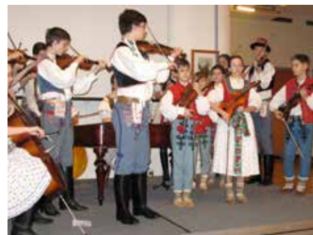
V Alternativě se také zpívá.

Návštěvníci Alternativy se nedají jednoduše zařadit. Na akce chodí jak ti stálí, tak ná-