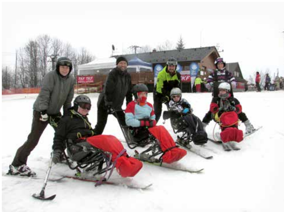
Monoski mohou pobavit i tělesně handicapované.

Správní rada Fondu zdraví města Zlína vyhláší výběrové řízení pro přidělení dotací na podporu Týdne zdraví ve Zlíně. Finanční prostředky jsou určeny k podpoře preventivních zdravotních akcí a akcí podporujících zdravý životní styl, které proběhnou v rámci Týdne zdraví ve Zlíně. Objem peněžních prostředků v programu je 174 000 Kč. Žádost bude podávána v rámci tohoto vyhlášeného programu v jednom vyhotovení na předepsaném formuláři schváleném Správní radou Fondu zdraví. Elektronicky je zveřejněn na www.zlin.eu v sekci Občan / Formuláře - oddělení prevence kriminality a sportovišť / Fond zdraví. Příjem žádostí je od 1. do 13. června do 17. 00. Více informací poskytne oddělení prevence kriminality a sportovišť (detašované pracoviště Zarámí 4421, 5. poschodí, dveře č. 513), J. Richtrová, tel. 577 630 330. [red]