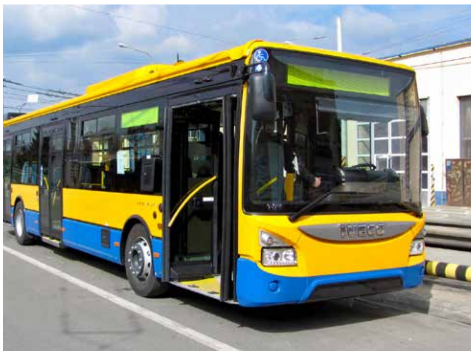
Novinka v MHD.

Cestující si všimnou jiného uspořádání interiéru nebo také plyšových potahů sedaček. Osvětlení zajišťují diody. Nově je řešena též kabina řidiče – je použita jiná přístrojová deska, kabina má vlastní okruh ventilace a topení. Čelní sklo je antireflexní. Cena jednoho vozu činí 5,035 milionu korun (částka bez DPH). [vc]