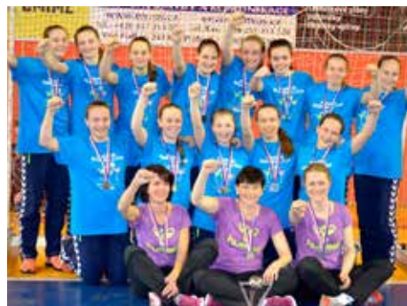
Zlínské házenkářky.