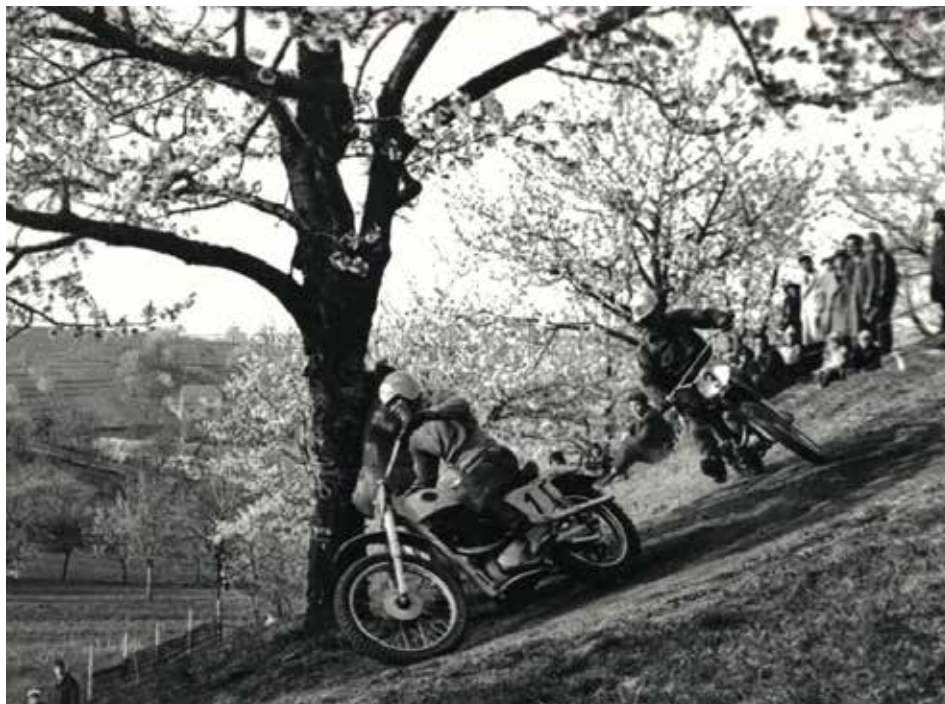
Ivan Buchta byl obrovským motokrosovým talentem.