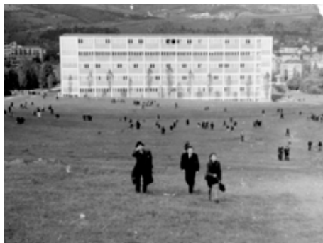
Přesun do krytu, 1945.