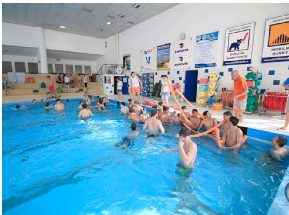
Děti z dětských domovů si návštěvu lázní užily.

Novinek v oblasti koupání je ve Zlíně v posledních letech celá řada. Otevřeno bylo například nové koupaliště Panorama na Jižních Svazích, velkou atrakcí je moderní finská sauna. Na letním koupališti Zelené bylo rekonstruováno dětské hřiště. V budově padesátimetrového bazénu byla provedena rozsáhlá oprava šaten včetně nových skříněk, rekonstrukce prostoru masáží, došlo k zavedení nového čipového elektronického odbavovacího systému, tzv. „hodinek“, provedena byla oprava mřížek nebo třeba výměna dlažby ve sprchách. [dvo]