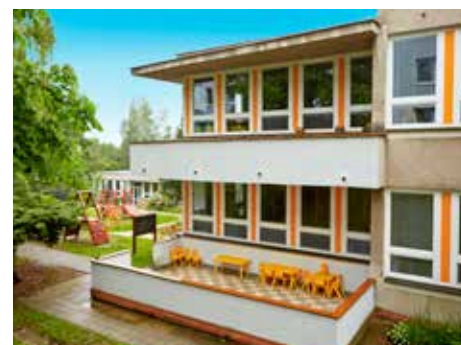
Míst ve školách je už téměř dostatek.

Také v letošním roce proběhlo přijímání dětí do mateřských škol prostřednictvím elektronického zápisu. Loňská novinka se opět osvědčila, když celý proces zjednodušila a zpřehlednila. Nabídla také řadu zajímavých čísel, například o počtu přihlášek podaných pro jedno dítě. Pouze do jedné mateřské školy se přihlásilo 357, do dvou podalo přihlášku 198 rodičů, více než deset přihlášek dali čtyři rodiče. „Jednomu rekordmanovi podali rodiče přihlášku do 27 zařízení z 28 možných,“ prozradila Kateřina Francová . [dvo]