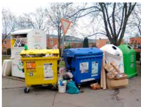
Jarní úklid je už zažitou tradicí.

Ve dnech 9. a 23. května bude na území města Zlína pokračovat jarní úklid zajišťovaný Odborem životního prostředí a zemědělství Magistrátu města Zlína a Technickými službami Zlín. Ve stanovené soboty budou od 9.00 do 16.00 v níže uvedených lokalitách přistaveny velkoobjemové kontejnery nebo speciální vozidlo Technických služeb Zlín a od občanů města Zlína bude sbírán v rámci úklidové akce odpad ze zahrad a velkoobjemový odpad. V západní části města již byl úklid realizován v dubnu.