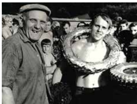
Sbírka věnců byla bohatá.