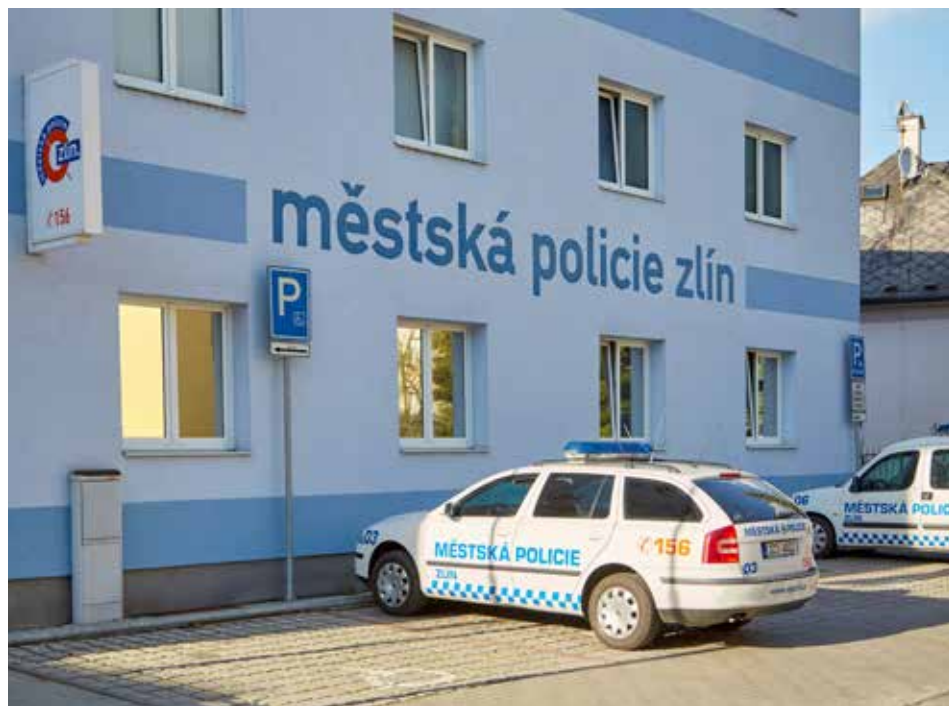
Zlínská městská policie má špičkové technologické vybavení.