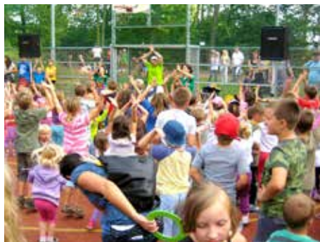
Dětský den U Majáku.

Jako každý rok i letos přináší Magazín Zlín přehled významných investičních a provozních akcí v místních částech za rok 2014. Statutární město Zlín přiděluje od roku 2009 patnácti místním částem finanční prostředky o celkovém objemu 25 mil. Kč ročně. Využití přidělených financí navrhují sami obyvatelé prostřednictvím jednotlivých komisí místních částí.