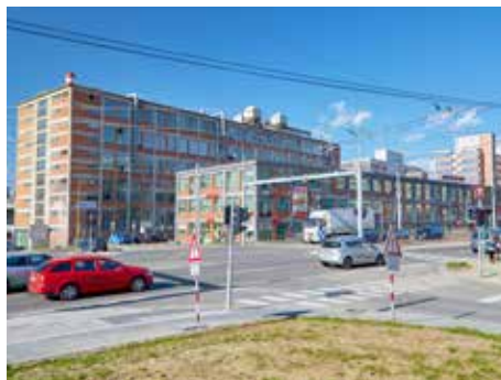
Křižovatka Antonínova

Jde o kroky postupné, ale je jich už docela dost a jsou znát. Křižovatka Antonínova, zavedení linky MHD, převzetí a údržba komunikací, investice do nich, ale i do kanalizačního řadu. Město Zlín pomáhá bývalému areálu firem Baťa a Svit k dalšímu rozvoji.