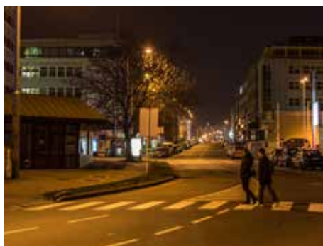
Přechod na ulici Zarámí bude upraven letos.