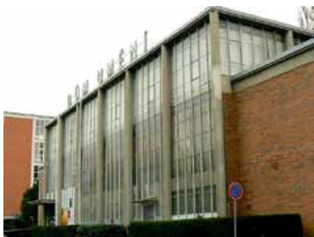
Přístavby budou odstraněny.