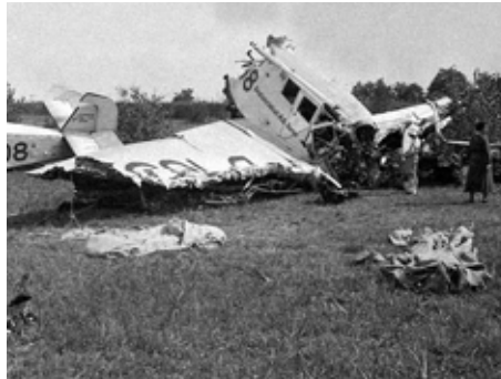
Letadlo, ve kterém havaroval T. Baťa.