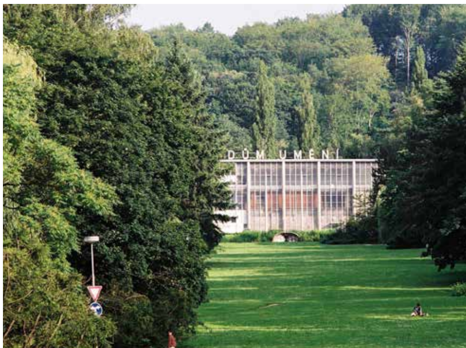
Současnost legendárního místa: prázdný Dům umění. / foto: MMZ

„Chtěl bych, aby architektura památníku vyjadřovala velkorysost, jasnost, vzlet, optimismus i prostotu – to byly všechno zvláštnosti Tomáše Bati.“