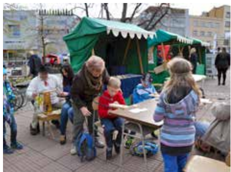
Program myslí i na děti.