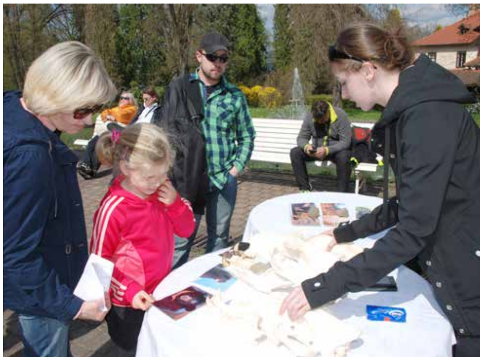
Zlínská zoo nabízí atraktivní podívanou.

ření věku. Těšit se mohou i na doprovodný program, který nabídne poradenství v oblasti zdraví, zdravého životního stylu a také hudební vystoupení,“ zve Romana Bujáčková z oddělení marketingu. Zámek Lešná v areálu zlínské zoo bude patřit poslední dubnový den čarodějnicím. Netradiční prohlídka zámku se uskuteční 30. dubna odpoledne. „Navíc všechny děti, které v tento den přijdou do zoo v kostýmu čarodějnice nebo čaroděje, získají v pokladně zooshopu hezký dárek,“ dodává Romana Bujáčková . [ond]