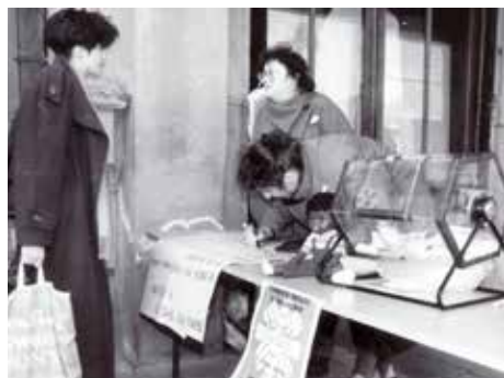
Finanční sbírka na Jugoslávii, rok 1991.