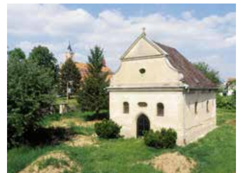
Původní kostelík, Štípa.