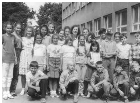
Děti z Černobyli pět týdnů ve Zlíně, 1991.