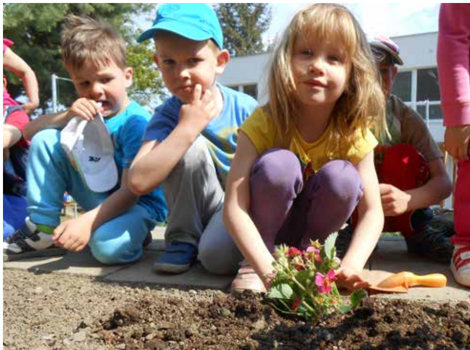
Předškoláci ze Slínové se seznamují s přírodou opravdu podrobně.

V průběhu měsíce března a dubna budou rozesílány poštovní poukázky k úhradě místního poplatku ze psů a za komunální odpad, které je možno uhradit obvyklým způsobem. Splatnost místního poplatku ze psů je do 30. dubna, za komunální odpad je do 15. května. Upozorňujeme občany, že od letošního roku jsou pro úhradu poplatků platné pouze tyto účty: KOMUNÁLNÍ ODPAD - 6369132/0800, PES - 6369212/0800. I letos mají občané možnost uhradit poplatky v kancelářích místních částí v čase od 15.00 do 17.30: Malenovice, Lhotka-Chlum - 29. 4. , Kudlov, Jaroslavičice, Salaš - 22. 4. , Kostelec, Velíková, Štípa - 21. 4. , Příluky, Lužkovice, Klečůvka - 28. 4. , Louky, Mladcová, Prštné - 26. 4.