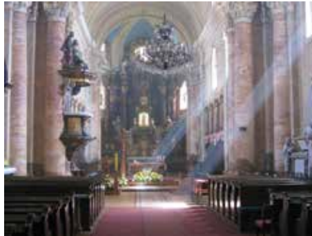
Interiér kostela ve Štípe.

Do Štípy na návštěvu ke staříčkovi jsme chodili rádi. Pro nás, jeho čtyři vnuky, to bylo romantické, a potom, byl to domov naší maminky a její otec byl velice hodný člověk. Jakási romantická tajemnost pramenila z jeho zaměstnání i z jeho vzhledu. Byl na pohled krásný dědeček s bílým velkým knírem a bílými vlasy. Lidé říkali, že je podobný prezidentu Masarykovi. Z dětství si ho pamatuji plného zdraví a síly, to dokazo-