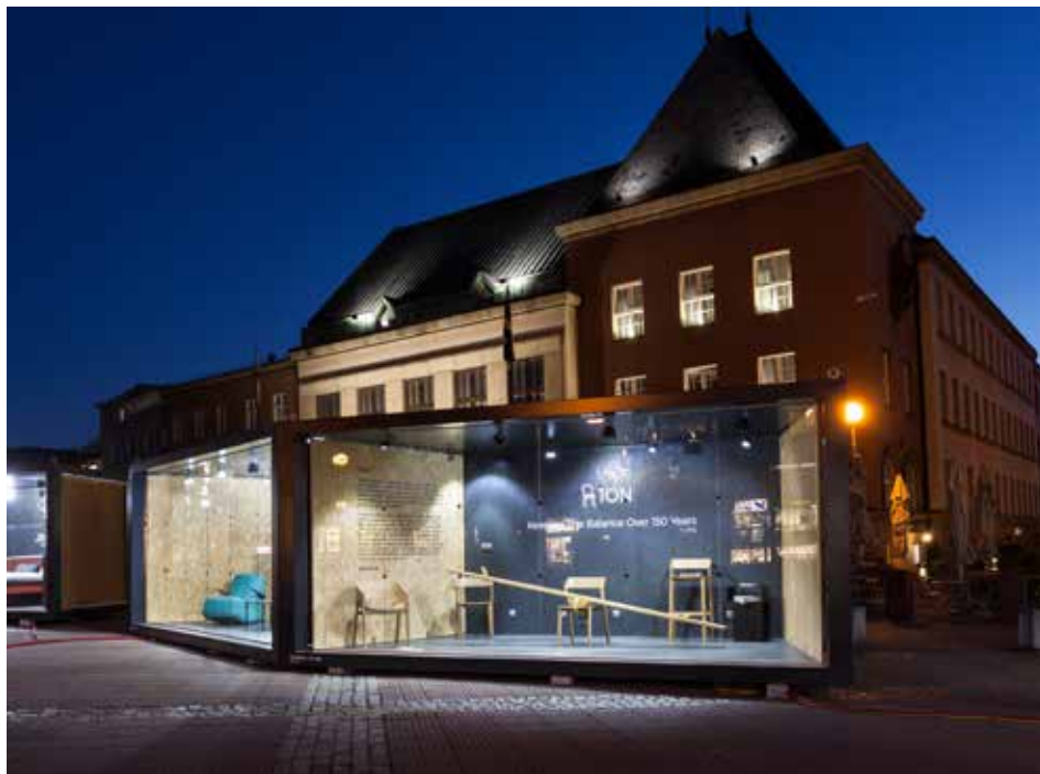
Koma modul - TON.

Soutěž zručnosti a technické tvořivosti mládeže vyhlašuje Dům dětí a mládeže ASTRA Zlín ve spolupráci s Magistrátem města Zlína. XIV. ročník této soutěže je připraven pro členy zájmových kroužků DDM Astra, základní školy i veřejnost. Soutěží se ve dvou věkových skupinách (I. 6-9 let; II. 10-15 let) a v několika kategoriích: technika (plastikové modely, modely letadel, lodí, aut a železniční modely), papírové modely, elektrotechnika, robotika a pracovní činnosti (šití, háčkování, vyšívání). Do 20. května mohou žáci nosit své výrobky každý do své školy. Ze školských kol (30. května) postoupí dva nejlepší výrobky v každé kategorii a věkové skupině. Následně proběhne městské kolo (6. června) a finálové kolo (21. června), které rozhodne o vítězi. Více informací na n.klimkova@ddmastra.cz , tel. 778 097 976. [ond]