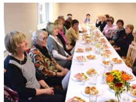
Senioři v Klečůvce mají společenský sál.

ním obyvatelům pro jejich společenské, kulturní, cvičební, vzdělávací a jiné aktivity. Propojení starých a nových časů symbolizuje historický zvon, umístěný ve věžičce na budově, který se původně nalézal o několik metrů dále na zámku. Jana Pobořilová