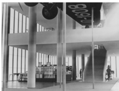
Dominantou památníku bylo letadlo.

Těmito slovy popsal svou představu budoucího Památníku Tomáše Bati jeho autor, architekt František Lydie Gahura. Nutno