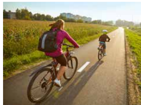
Cyklostezek bude přibývat.

Stavební práce nyní probíhají v úsecích od nově postaveného Centra polymerních systémů UTB kolem Zlínské polikliniky až na náměstí Práce a dále na krátkém úseku mezi budovou Tržnice a parkem Komenského. Další části této cyklostezky na náměstí Práce, Gahurově prospektu, po obvodu parku Komenského, podél náměstí Míru a Ko-