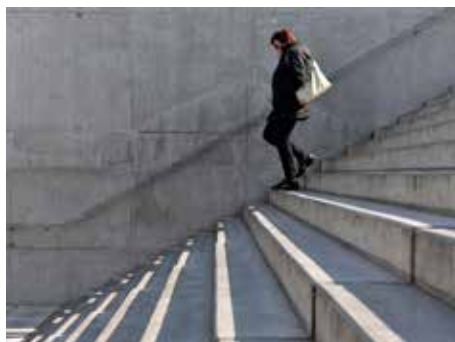
Podle radnice by zde mělo být zábradlí.

Schodiště není jediným problémem rekonstruovaného podchodu. Do jeho prostoru také zatékala voda ze stropu. Město se snažilo problém odstranit nanesením no-