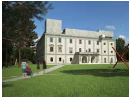
Vizualizace návrhu přestavby. / © Pavel Míček 2014

Navržená studie na revitalizaci zlínského zámku, jejímž autorem je architekt Pavel Míček, v anketě Magazínu Zlín u čtenářů neuspěla. Nelíbí se celkem 2 655 hlasujícím, souhlasný názor vyslovilo 95 čtenářů. Celkem došlo 2 750 platných anketních lístků. „Všem hlasujícím děkuji za jejich názory. Takle studie byla jen prvním kro-