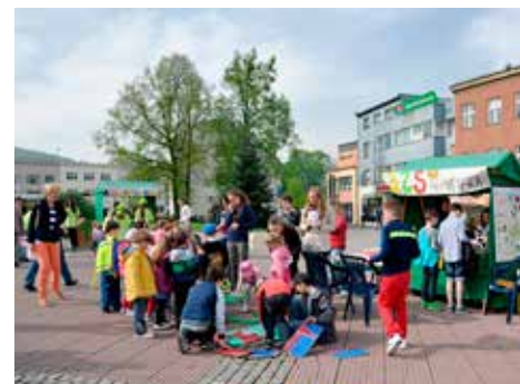
Den Země ožíví náměstí Míru.

Pro více informací sledujte www.zlin.eu .