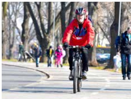
Cyklostezka na nábřeží. / foto: archiv

K instalaci zajímavé novinky dojde letos na ulici Štefánikova. Poté, co bude položen nový protihlukový povrch, se zde objeví takzvané cyklopiktokoridory. To jsou grafické znaky vyznačené při okrajích vozovky, vyobrazující cyklistu, které se pravidelně po několika metrech opakují. Vyobrazení psycho-