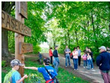
Program je vždy bohatý.

úterý 21. dubna, 9.00 - 15.00 ..... BAREVNÝ DEN SE SPOLEČNOSTÍ EKO-KOM Den plný her a soutěží, pro nejmenší i nafukovací atrakce, vše s tematikou třídění odpadů. Dále se představí společnosti ASEKOL, Ecobat, Technické služby Zlín, zlínské školy, Univerzita Tomáše Bati a další organizace. Na náměstí můžete odevzdat použité baterie (stánek spol. Ecobat), elektrospotřebiče (stánek spol. Asekol) a také jízdni kola (i nefunkční) v rámci sbírky pro školáky v Gambii - Kola pro Afriku.