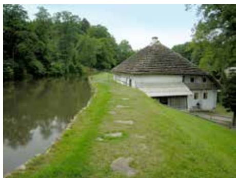
Mlýn v Hoslovicích, foto D. Valůšek 2010.

Málokdo asi ví, kde leží vesnice Lačnov. Jen těm znalejší topografie se název spojuje s dědinkou, choulící se na Valašskokloboucku při pomezí okresů Vsetín a Zlín. Valnou představu o její poloze jistě neměli ani zlíňští sousedé v době, kdy konšelskou radu začal zaměstnávat případ měšťánina Cábaly.