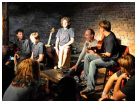
Nadměrný náklad.