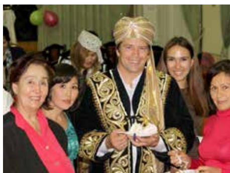
S přáteli.

Bývalý ruský profesionální sportovec, věnující se bojovému umění, nyní akreditovaný lektor a hlavní přednášející v centru M. S. Norbekova.