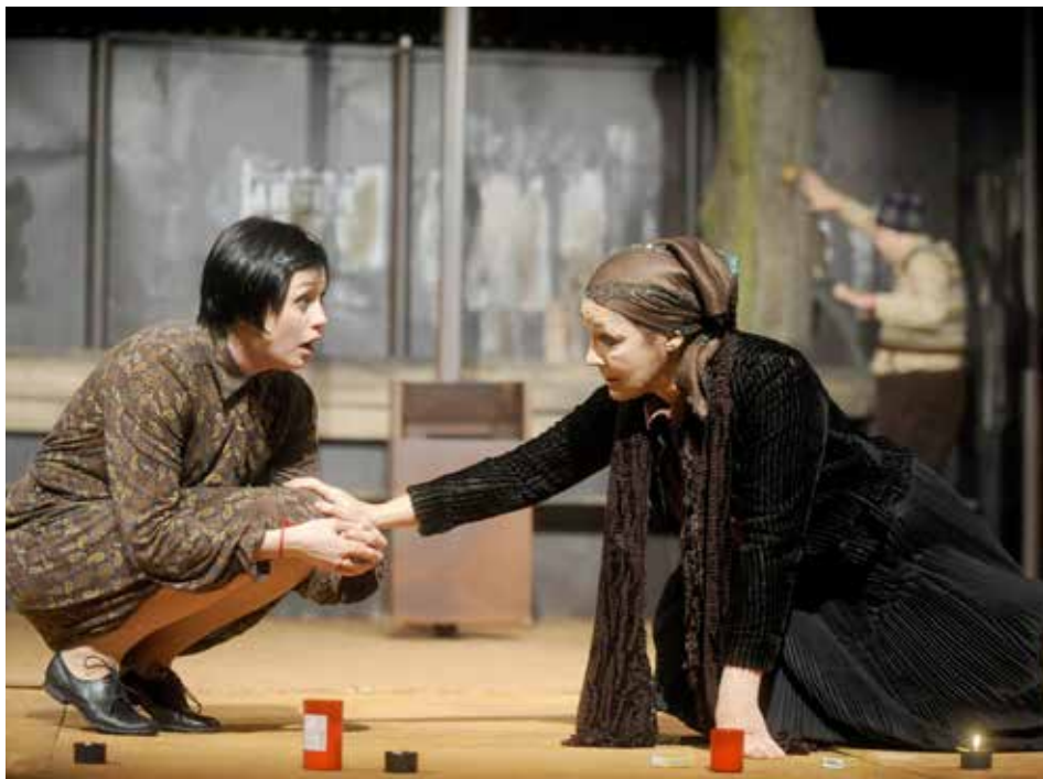
Nejen v Městském divadle inscenaci tleskají.