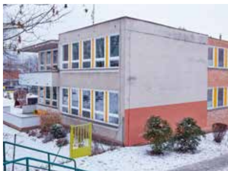
Do školek míří další děti.

Od 26. února 2016 bude zákonným zástupcům dítěte zpřístupněna doména www.zapisdomszlin.cz , na které se zaregistrují a vytvoří elektronický profil svého dítěte. Na základě tohoto profilu bude dítěti přiděleno identifikační číslo. Následně si zákonní zástupci vyberou mateřskou školu (dále jen MŠ) a dítě do dané MŠ on-line zaregistrují. Po této registraci si vytisknou automaticky vygenerovanou žádost. V případě registrace dítěte do více MŠ je nutno vytisknout žádost pro každou vybranou MŠ zvlášť. Registrace zákonných zástupců spolu s vytvářením profilů dětí bude možná pouze v první fázi, tedy od 26. února 2016 do 14. března 2016. On-line registrace je pouze jedním z kroků přijímacího řízení.