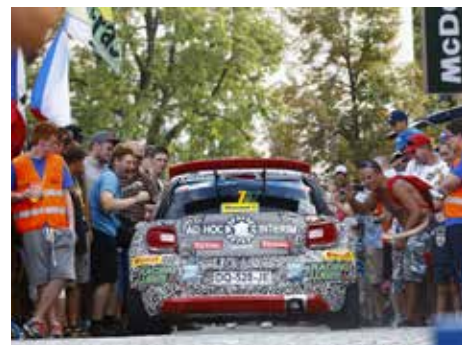
Barum Czech Rally Zlín.

Loňský ročník Barum rally se jel od 28. do 30. srpna, 474 jezdců a spolujezdců a další stovky členů jejich doprovodných týmů ale strávili v regionu o několik dnů více. Společně s desítkami tisíc návštěvníků v regionu utratili za gastronomické služby téměř 20 a půl milionu korun. Významnou část z těchto peněz inkasovali provozovatelé restaurací v samotném Zlíně, který byl tradičně centrem tohoto automobilového podniku. To samé platí i pro částky vynaložené za ubytování. Celkový počet lůžkonocí během závodu činil cca 13