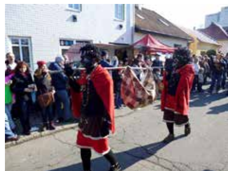
Lešetínský fašank 2015.

Návštěvníci se mohou těšit na tradiční maškarní průvod, pochovávaní basy a vyhlášení soutěže o nejlepší masku. Zajímavé dárky jsou připraveny pro děti, které se v masce zapojí do průvodu. Na dvou hudebních scénách vystoupí folklorní soubory a hudební skupiny nejen ze zlínského regionu. Představí se například slovenská sku-