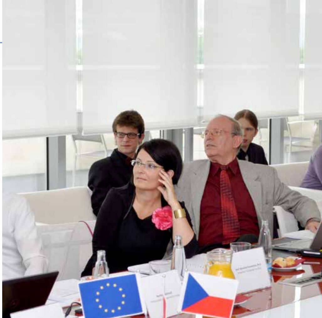
Zasedání komise Rhodia Prix de Chimie pod záštitou nositele Nobelovy ceny prof. J.M. Lehna

Nabídka zaměstnání pro techniky vysoce převyšuje poptávku. Náš úspěch přímo