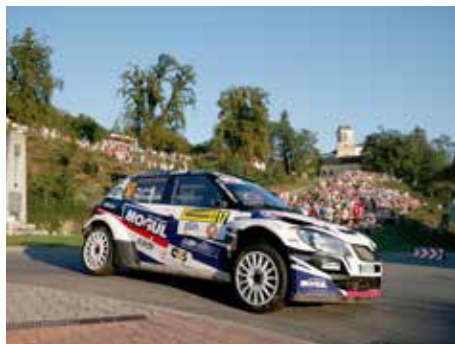
Barum Czech Rally Zlín.

Barumka má významný přínos nejenom pro soukromé podnikatele, ale i pro veřejné rozpočty. Ze studie společnosti KPMG vyplývá, že z každých 100 korun výdajů návštěvníka jde cca 41 korun do veřejných příjmů. Nejzajímavějším údajem je, že formou přímých daňových odvodů zaměřilo ze soutěže do státního rozpočtu 17 a půl milionu korun. Jde o unikátní příjmy, které by bez uspořádání Barum Czech Rally Zlín nebyly nikdy generovány. Rovněž ze sociálního pojištění bylo odvedeno 13,6 milionu korun, ze zdravotního dalších 5,6 milionu korun, atd.