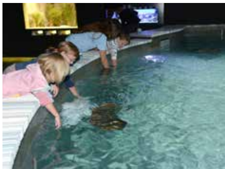
Zátoka rejnoků nabízí mimořádné zážitky.

pro děti. „Již u zmiňované expozice veverek se nám naprosto osvědčilo propojení „světa zvířat se světem dětí“. V uvedeném trendu budeme proto pokračovat nejen u lvů, ale také u budoucích projektů zoo. Chceme zlínskou zoo skutečně otevřít dětem, tuto filozofii plánujeme promítnout i do připravované změny vizuálního stylu zoo,“ přiblížil Roman Horský .