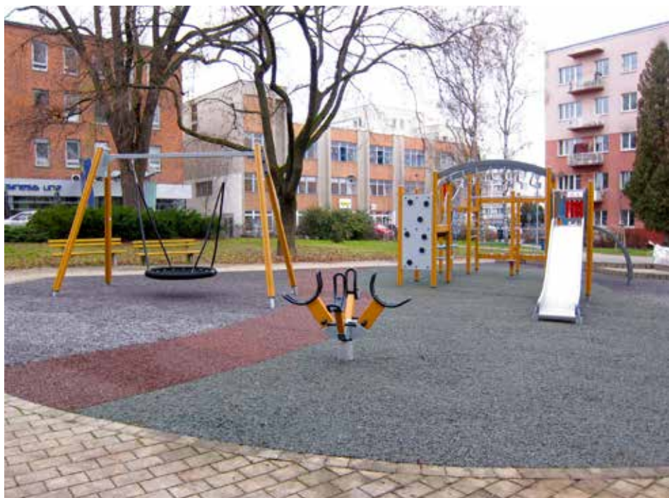
Nové herní prvky i povrch. Malí Zlíňané mají k dispozici další hezké hřiště.