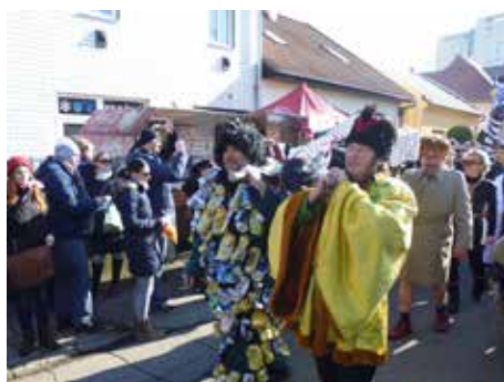
Lešetínský fašank 2015. / foto: Jiří Ambrož

pina FUNNY FELLOWS, brněnský recesistický soubor UKULELE TROUBLEMAKERS, cimbálová muzika Paléska, hudební skupiny Podjezd, Pass, Jazzzubs, Létající doktor, Blues Station a skupina Raggay.