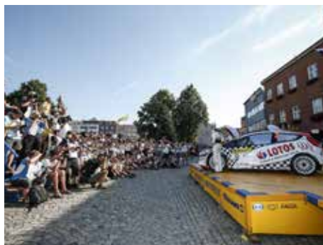
Barum Czech Rally Zlín.

Zcela nezastupitelnou roli má tato motoristická soutěž z hlediska propagace města a regionu. Desítky milionů lidí automobilové klání sledovaly prostřednictvím médií. Televizní sledovanost barumky dosáhla 55 a půl milionu diváků, z nichž 30 milionů připadlo na Eurosport a více než 3 miliony na české televizní stanice. Eurosport také uvedl, že promo spot před akcí vidělo 22 a půl milionu diváků. „Důležité je říci, že jeho prostřednictvím byl Zlín prezentován