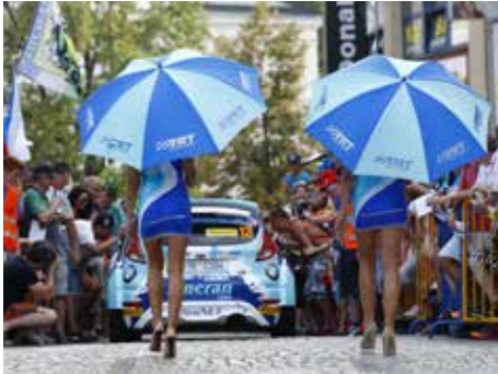
Barum Czech Rally Zlín.