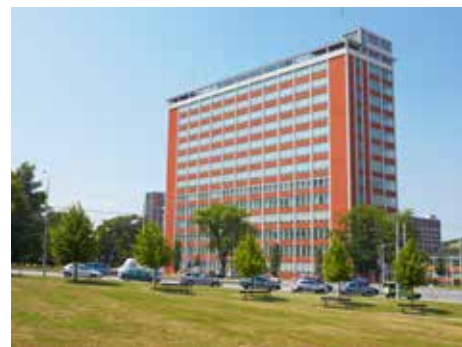
Sídlo kraje. Zlínský mrakodrap.

Václav Klaus nás, jak jsme tam stáli v řadě, postupně zdravil podáním ruky a občas ledacos prohodil. Byl jsem v řadě poslední. Povšiml jsem si jedné maličkosti. Když mně podával ruku, pravil jsem: „Pane předsedo, vaši spolustraníci nejsou na vaši návštěvu dobře připraveni. Jediný, kdo má stejnou kravatu jako vy, jsem já.“ Byla to náhoda. Atmosféra se uvolnila a uprostřed debaty došlo k zásadnímu dotazu. V. Klaus pohlížel oknem na budovu mrakodrapu. „Co máte v plánu s tou budovou?“ otázal se. Krátce jsem popsal včerejší situaci. „Pánové,“ obrátil se na své spolupracovníky, „to s přístavbou nemyslíte přece vážně. Toto je váš úkol,“