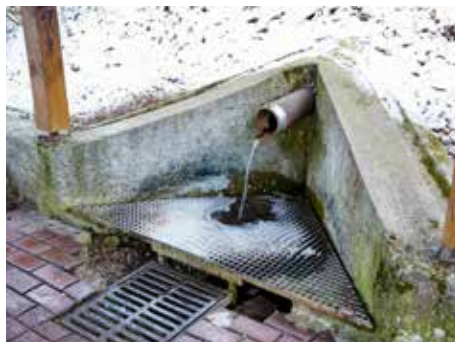
Kvalita vody je pečlivě sledovaná

Potvrzuje se tak známý fakt, že v případech nezajištěných zdrojů vody, což platí pro Příluky i Malenovice, nelze nikdy zaručit,