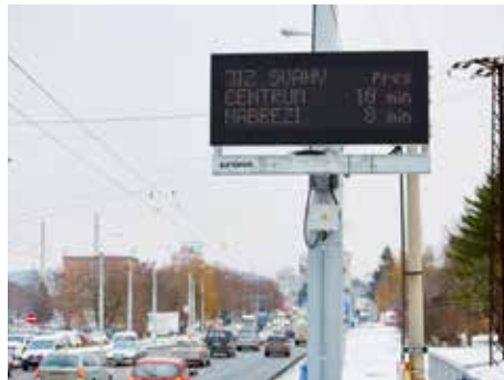
V rámci regionu jde o jedinečnou věc.

„Jde o podobné zařízení, jaké šoféři znají z dálnic. Návštěvníkům umožní nalézt vhodnější cestu, místní se budou moci