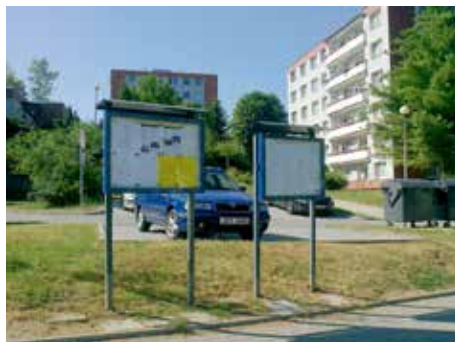
Vývěsní skříňky umístěné na ulici Luční.