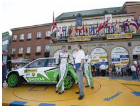
Barum Czech Rally Zlín.