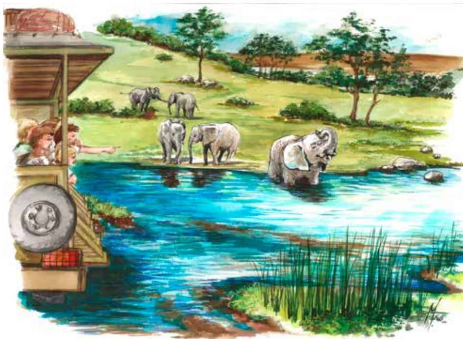
Pro slony zoo plánuje nový výběh. / kresba: Zoo Zlín.