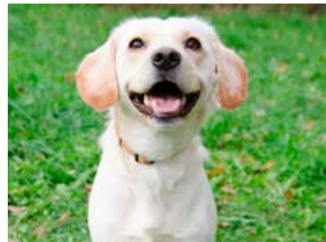
Sára II.