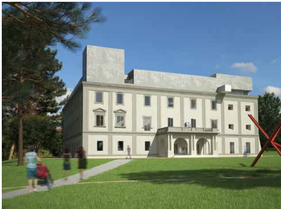
Návrh nabízí zásadní proměnu celé budovy, včetně střechy.