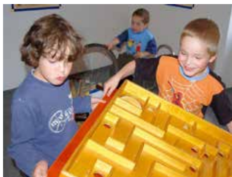
Děti si přijdou na své.

posílit nebo třeba jen připomenout,“ popsal smysl akce její pořadatelka, Věra Stojarová z Aktivně žít o.p.s. Podle ní je liberecká výstava novodobou „školou hrou“, která dokáže spolehlivě zamotat hlavu malým i starším návštěvníkům. Průměrná doba pro práci s jedním exponátem je sedm minut, snadno lze tak spočítat, kolik času návštěva výstavy může zabrat.