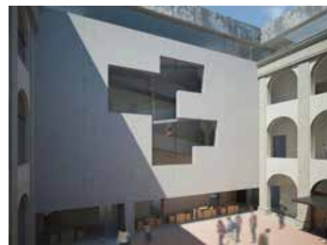
Nádvoří. / vizualizace: © 2014 Pavel Míček.

rii zámku. Návrh byl představen a nyní je možné o něm začít diskutovat. Svě si k němu řeknou jak odborníci, tak obyvatelé Zlína. „Zámek bude sloužit lidem, takže jejich názor je velmi důležitý. Proto se prostřednictvím magazínu ptáme na váš názor. Líbí se vám navržená studie, nebo byste uvítali jiný návrh? Napište nám,“