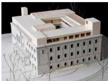
Pohled na model.

Výsledek hlasování bude zveřejněn v dubnovém vydání magazínu a předán Zlínskému zámku o.p.s.