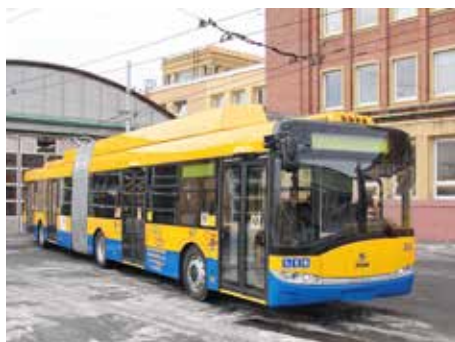
Jeden z nových vozů. / foto: DSZO

Průměrná cena kloubového trolejbusu činí 14,5 milionu korun, sólo trolejbus přijde asi na 11,4 milionu korun. Výrobce poskytuje na nový trolejbus záruku v trvání 36 měsíců. Životnost trolejbusu je plánována na 13 let. Na linky MHD vypravuje DSZO v současnosti