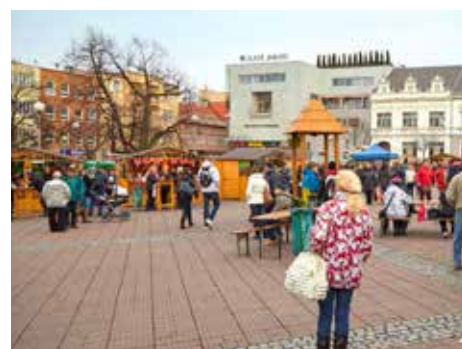
S prodejci se dá potkat v centru města.

a také pohodlnou většinu v zastupitelstvu. Snad se od nového vedení dočkáme i opravy rozbitého chodníku v centru města v Divadelní ulici v délce necelých sto metrů, kde snad ani jedna dlaždice není celá. Vystupují tu ze zájezdových autobusů návštěvníci divadla, pro které je chůze po něm „opravdovým“ zážitkem (pro nás ostatní též). Nevím, zdali je záměrné ponechat tento stav jako ukázkou (památku?), v jakém stavu bývaly chodníky v našem městě. Povrch vozovky tam též není v nejlepším stavu, ale chůze po něm je bezpečnější.