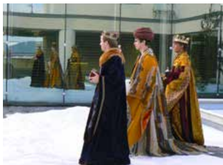
Koledníci ve Zlíně. / foto: archiv Charity Zlín

Koledovat může kdokoli. Jde o lidovou tradici, která má u nás hluboké kořeny. Pokud však lidé chtějí přispět do sbírky pořádané charitou, musejí přispět skupince koledníků, která má pověření organizátora. Vedoucí skupinky je osoba starší 15 let a je vybavena průkazkou koledníka, což je zplnomocnění k vybírání prostředků do zapečetěné pokladničky, která má dvě pečete s podpisy, případně i razítky příslušné charity a obecního úřadu, logo charity a je olepena průhlednou lepicí páskou. Dále je