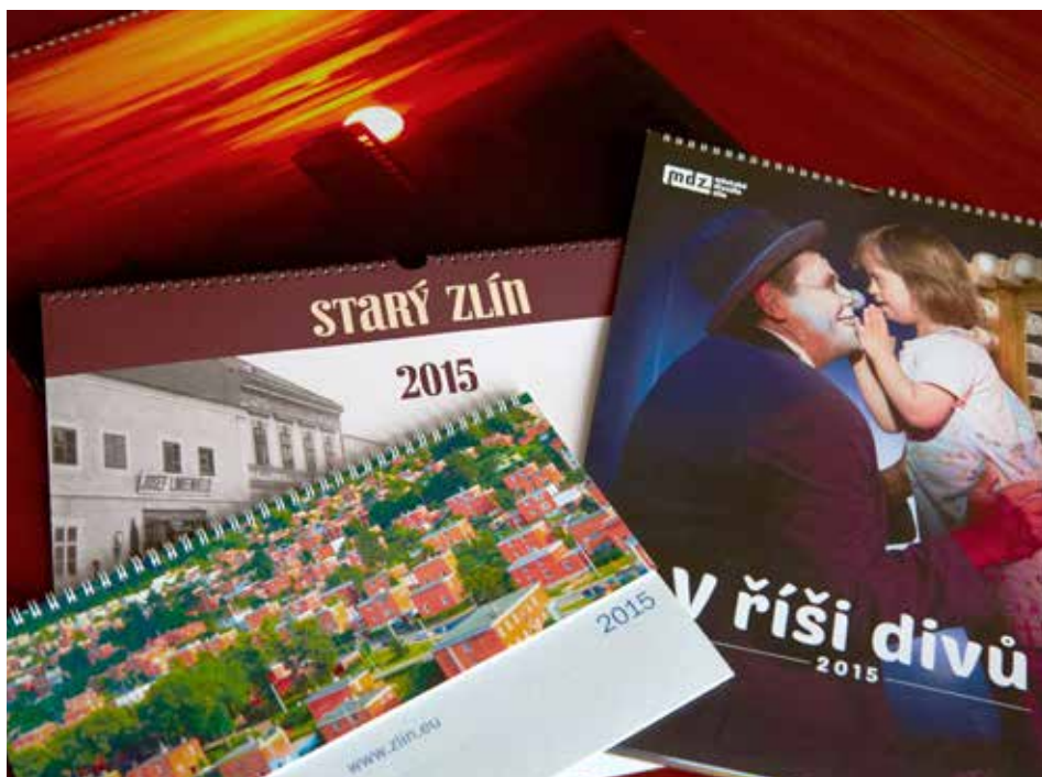
Nabídka kalendářů je pestrá.

Ke koupi jsou také kalendáře Konečně žijeme svůj sen (snímky psů z útulku, kteří už našli nové domovy, výtěžek bude poskytnut na provoz útulku), V říši divů (Rehabilitační stacionář Zlín ve spolupráci s Městským divadlem Zlín, výtěžek z prodeje pomůže vybudovat zážitkovou zahradu pro rehabilitační stacionář), a stolní kalendář Zlín 2015 se současnými fotografiemi města a okolí. [red]