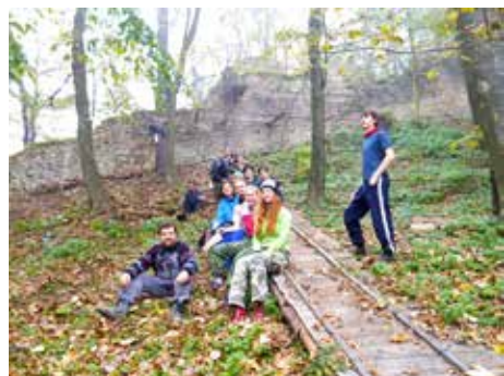
Po brigádě na hradě.

Cyklostezka má velký přínos i pro lukovské školáky navštěvující štípskou školu. A naopak štípské, ale i zlínské děti se svý-