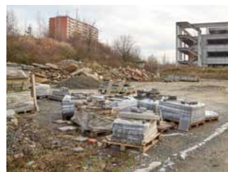
V první fázi zde vznikne odpočinková zóna.

Anketa k dalšímu využití ploch pod torzem se uskuteční v první polovině roku 2015. Anketní dotazníky se objeví v Magazínu Zlín a na webu www.zlin.eu . [dvo]