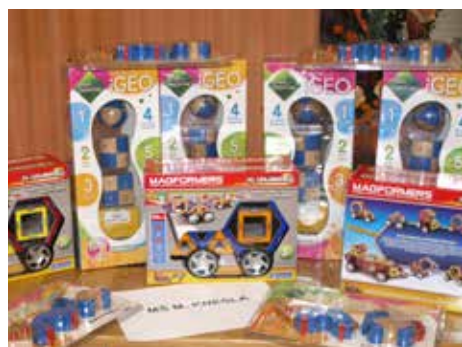
Tradice dárků předškolákům pokračuje.

MŠ Zlín, Česká 4790, MŠ Zlín, Družstevní 4514, MŠ Zlín, Slínová 4225, MŠ Zlín, Kúty 1963, MŠ Zlín, Lázeňská 412, MŠ Zlín, Luční 4588, MŠ Zlín, Návesní 64, MŠ Zlín, M. Knesla 4056, MŠ Zlín, Mariánské náměstí 141. [dvo]