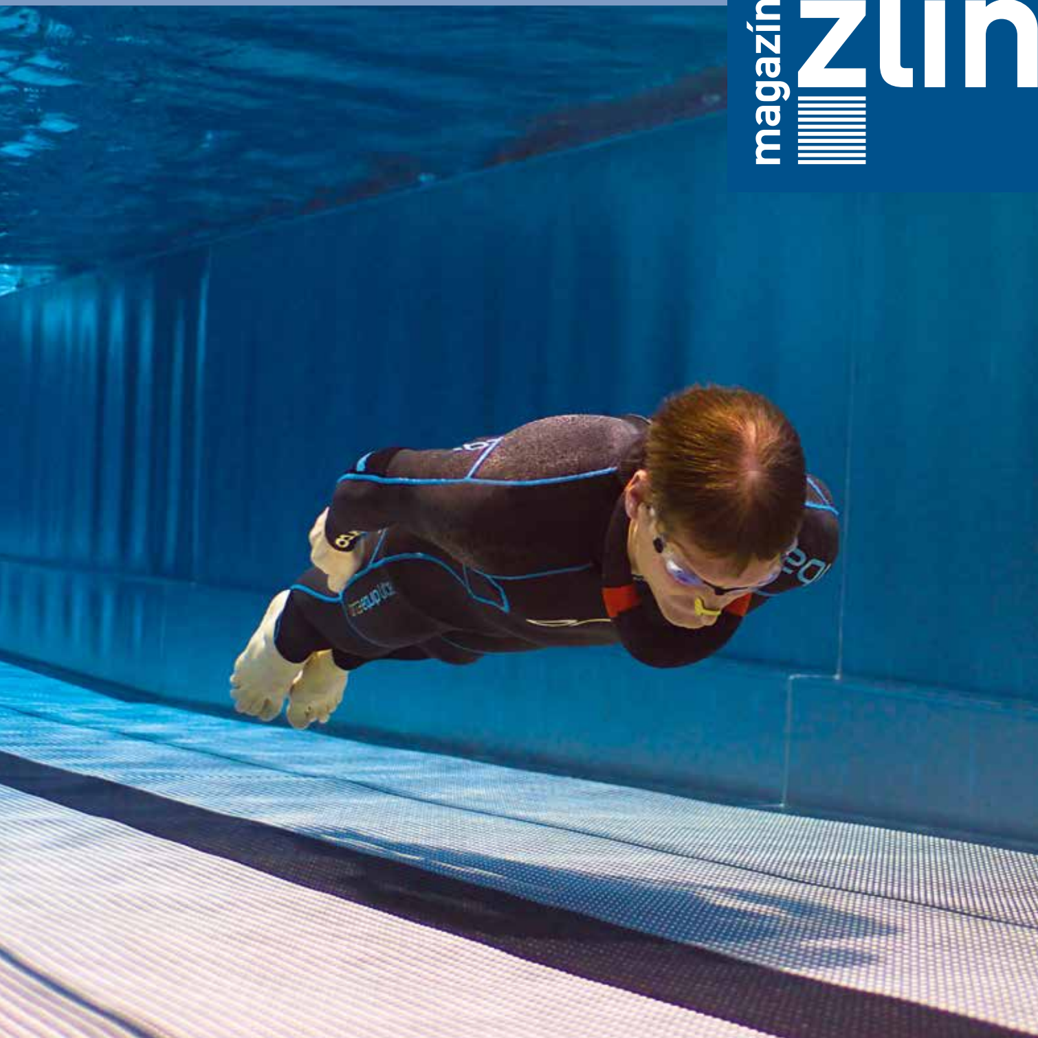
Ceny v roce 2015