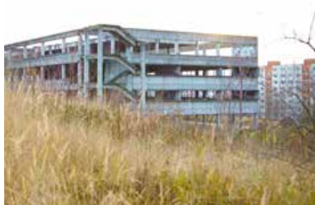
„Torzo“ v roce 2015 zmizí.

Město Zlín odkoupí „torzo“ a přilehlé pozemky na Jižních Svazích za 53 milionů korun. Rozhodlo o tom počátkem prosince zastupitelstvo. Potvrdilo tak už dřívější rozhodnutí radních. Zbourání nevzhledného betonového monstra na největším zlínském sídlišti tak nestojí nic v cestě, dojít by k němu mohlo už v první polovi-