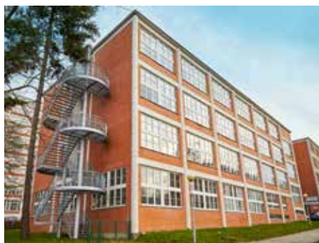
Zápis se uskutečnil v půlce ledna.

Povinná školní docházka začíná počátkem školního roku, který následuje po dni, kdy dítě dosáhne šestého roku věku. Zapisují se děti narozené od 1. 9. 2008 do 31. 8. 2009. Dítě, které bude mít šest let v době od září do konce prosince 2015, může být přijato k plnění povinné školní docházky již v tomto školním roce, je-li přiměřeně tělesně i duševně vyspělé a požádá-li o to jeho zákonný zástupce. Podmínkou přijetí dítěte narozeného v období od září 2009 do konce prosince 2009 k plnění povinné školní docházky je také doporučující vyjádření školského poradenského zařízení (Krajské