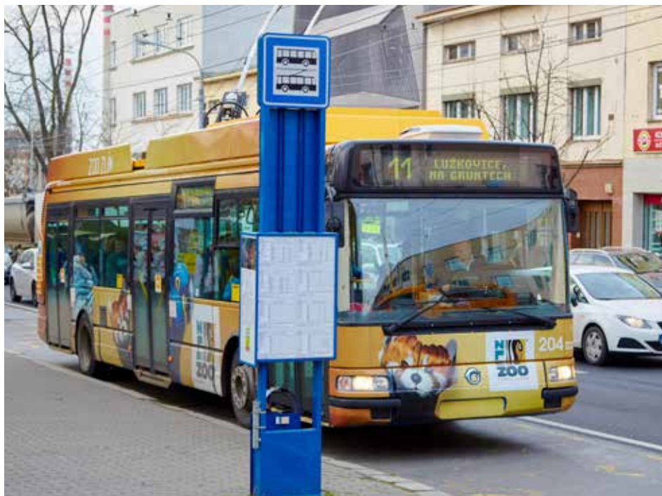
Jezdit MHD bude veřejnost za stejné částky jako v roce 2014.

V poslední den roku 2014, na Silvestra, bude magistrát otevřený pouze do 12.00. Výjimkou budou případy, při kterých bude návštěva občanů spojená s placením na hlavní pokladně (budova radnice, nám. Míru 12). Hlavní pokladna bude otevřená pro veřejnost pouze v čase od 7.30 do 9.00 a to z důvodu inventury.