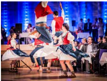
Bartošův soubor bude ozdobou bálu.

Pravý Valašský bál si pro vás i v roce 2015 přichystal zlínský Bartošův soubor písní a tanců. Pro všechny příznivce folkloru je připravený večer plný cimbálové muziky, tance, zábavy, dobrého vína a slivovice. Valašský bál bude probíhat v sobotu 24. ledna v prostorách Kongresového centra Zlín. Kromě Bartošova souboru vystoupí také hostující Valašský krúžek Rusavjan z Rusavy a soubor Mužáci z Vrbice. O hudební doprovod se postarají hned tři cimbálové muziky. Během večera zahrají Cimbálová muzika Máj, Cimbálová muzika Aloise Skoumala a Cimbálová muzika Rusava. Součástí bohatého programu bude také originální noční vystoupení a bohatá tombola. Valašského bálu se může zúčastnit každý. „Ti, kteří se bojí valašských tanců, nemusí mít obavy. Celý večer bude