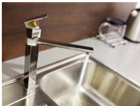
Cena vody vzroste o haléře.

Žádná velká změna, za kubík odebrané a následně vyčištěné vody zaplatí Zlíňané 86,12 korun včetně DPH, tedy pouze o 43 haléřů více než v roce 2014. Už třetí rok tak ve městě zůstává cena vody prakticky „zamrzlá“. Veškerý denní servis zahrnující vodu na pití, vaření, splachování, mytí,