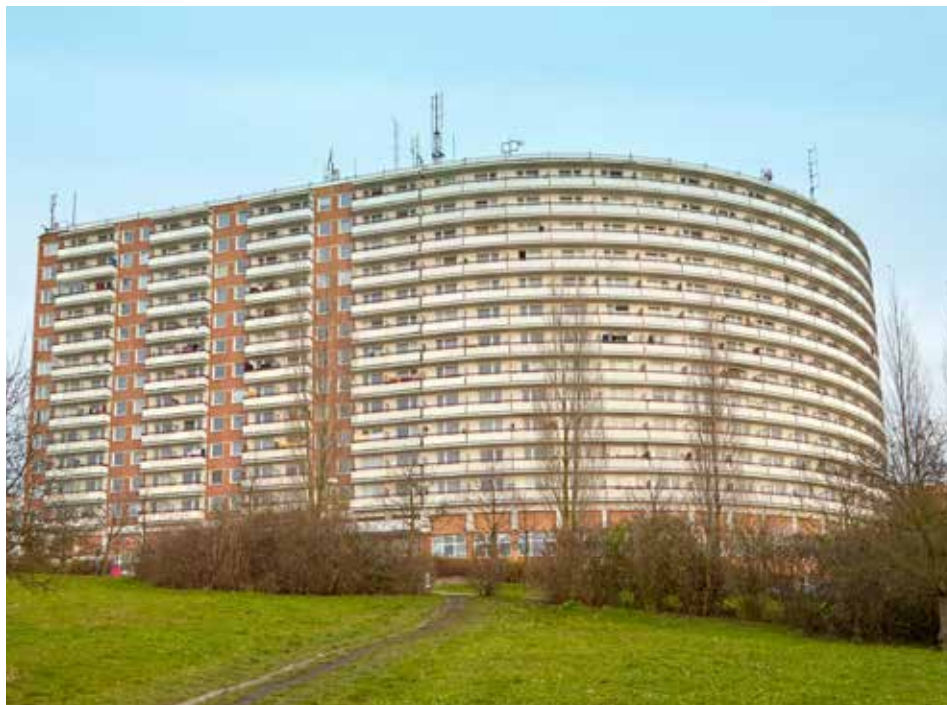
Ve většině městských bytů platí lidé menší nájem.

Organizátoři petice prosazují plošný zákaz loterií na území Zlína. Radnice řeší od roku 2012 tuto problematiku obecně závaznou vyhláškou, na jejímž základě došlo k „zastropování“ celkového počtu herních provozoven na území města. V první polovině roku 2015 navíc dojde k úplnému zákazu výherních automatů a dalších zařízení tohoto typu v centru města. V dalších částech města budou zbývající herny fungovat jen na základě výjimky a za splnění přísných podmínek. Například provoz nesmí rušit noční klid a veřejný pořádek, na provozovně nesmí být umístěny poutače, reklamy, nápisy či žádná světelná upozornění, nepřipustné jsou i informace o jiných herních benefitech, třeba o první hře zdarma atd. Smyslem vyhlášky je omezit a regulovat tento druh podnikání. Přestože plný dopad bude mít až v první polovině roku 2015, už nyní přináší výsledky. V době od jejího přijetí po současnost klesl počet „blikajících bedýnek“ ve Zlíně z původních přibližně 1 400 na současných zhruba 700.