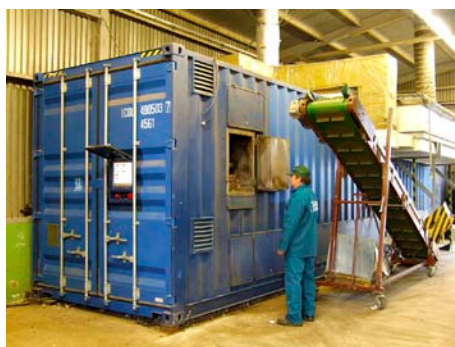
Fermentor na skládce Suchý důl

Roční úsporu 4 800 tun oxidu uhličitého, resp. úsporu konvenčních energií ve výši cca 5,56 GWh ročně, tj. 29,6 procent z původní spotřeby energie ve sledované oblasti Louky, Podhoří, Chlum a u vybraných objektů v centru města Zlína, přinesla pětiletá realizace mezinárodního projektu Energy in Minds! (Mysleme na energii!) ve Zlíně.