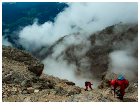
Z festivalu outdoorových filmů

Je však třeba uspořít ještě více, než činí náklady za dopady na životní prostředí. „Další jednání s investorem stavby se budou týkat zejména úspor na zařízeních, která budou po dokončení předána do majetku města, jako např. zastávky MHD, jiné provedení protihlukových stěn, veřejné osvětlení, chodníky,“ upřesnil Šenkýř. [mm]