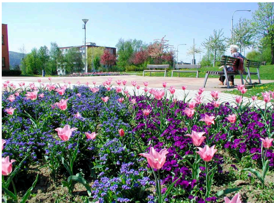
Rozkvetlý záhon na sídlišti Jižní Svahy