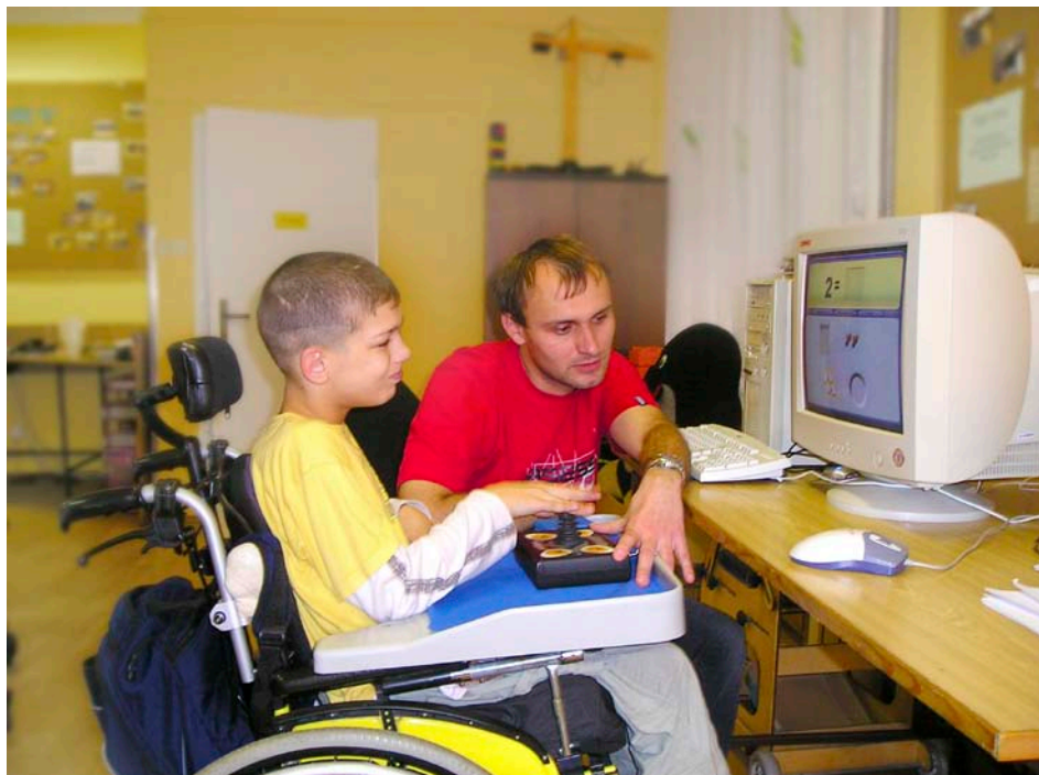
Co nabízí Ostrov radosti

Šest vybraných studentů SPŠ polytechnické – COP Zlín se ve dnech od 23. 8. do 12. 9. 2010 zúčastnilo již podruhé projektu zahraniční odborné praxe ve vzdělávacím institutu Sazev Schwerin v německém Pomořansku-Mecklenburgsku. Praxi zlínským žákům z oboru zpracování plastů v doprovodu vedoucího projektu zprostředkovalo koordináční centrum Tandem, které podporuje česko-německá přátelství ve školách s praktickou výukou.