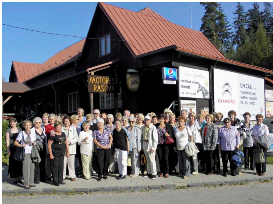
Zlíňští senioři v Trenčíně

Výtěžek benefičního koncertu Rock na vsi ve výši 6 300 korun byl věnován na podporu činnosti Střediska integračních aktivit Sjedenocené organizace nevidomých a slabozrakých (SIA SONS Zlín). Nevidomí klienti mohou díky tomu pokračovat v kurzu Axmanovy techniky modelování, což je speciální technika hmatového modelování z hlíny.