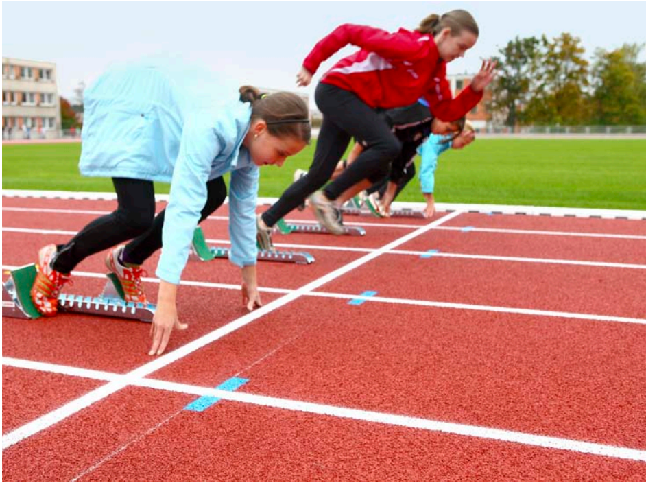
První etapa rekonstrukce Stadionu mládeže je dokončena