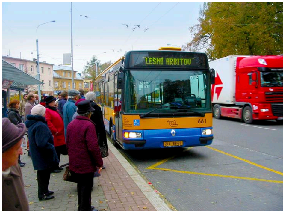
Dopravní společnost zajistí posilové spoje na Lesní hřbitov

Cena města Zlína je udělována na základě usnesení Zastupitelstva města Zlína ze dne 30. 3. 1993. Toto ocenění je uvedeno v obecně závazné vyhlášce o symbolech, oceněních a o jednotném vizuálním stylu města. [OKP]