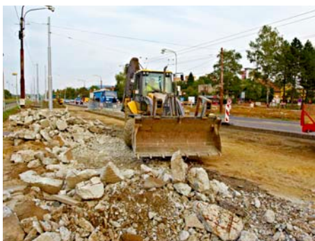
Rozšiřování silnice I/49 v Malenovicích