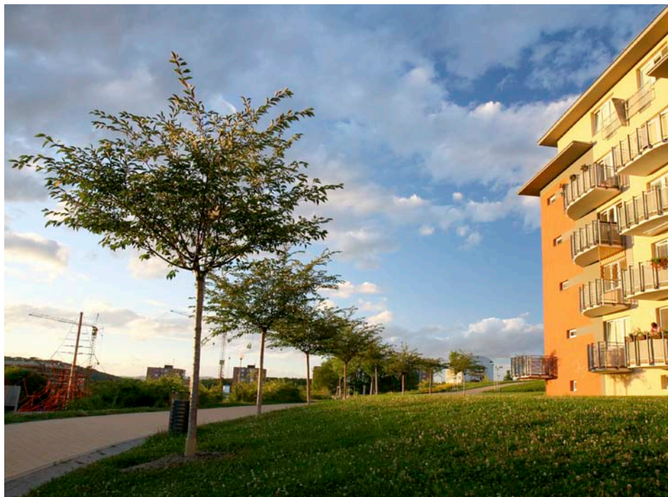
Novější část sídliště v okolí ulic Podlesí

Z historických pramenů se dovídáme, že rozsáhlé území nad Čepkovem a Cigánovem si dlouho uchovávalo ráz venkovské krajiny. Častěji se sem začalo z města vzhlížet ve 20. letech 20. století, když se Zlín na všech stranách stále rychleji rozrůstal. Letná se měnila ve velkou čtvrť, stavělo se už i na Zálešné a Podvesné. A tak není divu, že lákaly i pozemky nad Čepkovem slibující prostor pro usídlení mnoha nových obyvatel města. Možnost zástavby tohoto rozsáhlého území nabídl Baťův architekt F. L. Gahura ve svém zastavovacím plánu Zlína uveřejněném počátkem května 1927. Navržený obytný celek je tu zakreslený pod názvem „Budoucí městská čtvrť Kříby“. Jádro zástavby obytnými domky je navrženo v přehledných symetrických liniích - pět ulic obíhajících v polokruhu je přetnuto pěti ulicemi přímnými. Záměr se neuskutečnil a na pozemcích se dál hospodařilo.