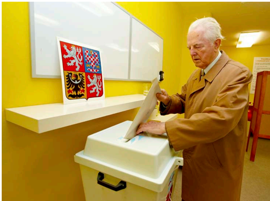
Hlasování ve volební místnosti v Morřovské domě

Ve dnech 15. – 16. října 2010 proběhly na území města Zlína volby do zastupitelstva města. Voleb se zúčastnilo celkem 15 volebních stran. Základní údaje vám přinášíme ve formě tabulek a přehledů. Data v celém textu jsou převzata z oficiálního volebního serveru Českého statistického úřadu – www.volby.cz , kde rovněž naleznete podrobné výsledky za jednotlivé volební okrsky.