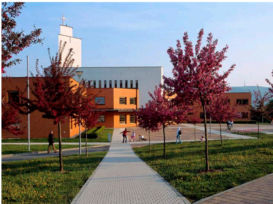
Duchovním a kulturním centrem sídliště se stal nový katolický kostel

K větší ochraně bezpečnosti osob a majetku přispívá také Městská policie Zlín, jejíž služebna byla zřízena v budově I. segmentu již v r. 1996.