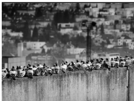
Ze souboru snímků oceněných II. místem

U příležitosti vernisáže výstavy v Galerii 2. patro na radnici obdrželi výherci věcné ceny. Více informací na webu: www.zlin.eu v sekci Turista. [red]