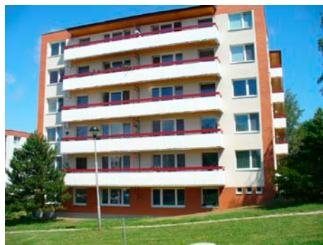
Regenerace se týká celého vnějšku budovy

Revitalizace nebo regenerace bytových domů ve větším měřítku začala ve Zlíně na přelomu let 2005 a 2006. Motivace ke stavebním úpravám bytových domů je dána především stavebně technickým stavem bytových domů, zejména jejich obvodového pláště, se zcela nevyhovujícími tepelně-technickými parametry, prodejem městských bytů, kdy odpovědnost za údržbu stavby přechází na nové vlastníky, kteří mají přímý zájem na zhodnocení domu, a dotační politikou státu (programy NOVÝ PANEL či Zelená úsporám).