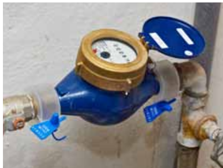
Cena vody ve Zlíně patří k nejvyšším.

Koalice TOP 09/STAN, jejíž představitelé v současnosti působí v zastupitelstvu a radě města, důrazně kritizuje rozhodnutí předchozího vedení radnice přijmout v roce 2004 podmínky takzvaného „provozního