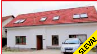
Zlín - Kostelec N04762