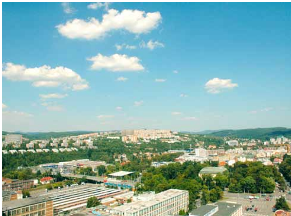
V roce 2012 čeká obyvatele města mnoho změn.

Mezi neočekávanější projekty, které budou zahájeny v průběhu nadcházejícího roku, patří určitě rekonstrukce prostor v centru Zlína: Gahurova prospektu – předprostoru Kulturního a Univerzitního centra, podchodu na náměstí Práce a Parku Komenského. Postupovat se bude podle návrhů, které vzešly z veřejných architektonických soutěží. Na pokrytí nákladů na rekonstrukce město využije také financí z Regionálního operačního programu regionu soudržnosti Střední Morava, ze kterého může čerpat celkem 120 milionů korun. Práce by mohly začít v druhé polovině roku.