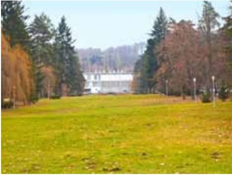
Gahurův prospekt čeká změna.

bude závislý na finančních prostředcích a možných dotačních titulech," uvedl radní Jiří Viktorín .