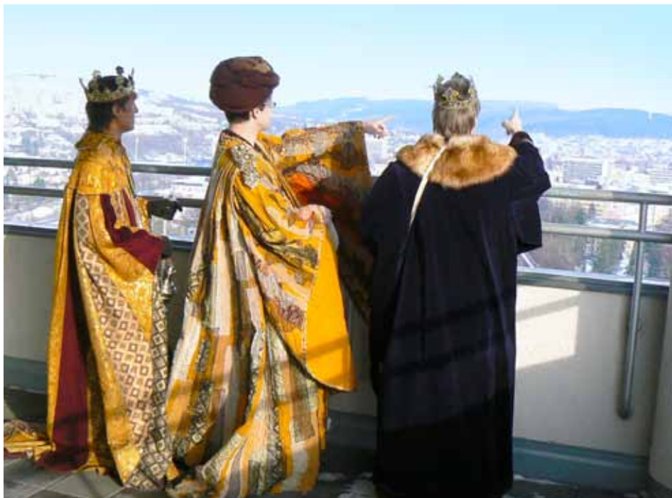
Mudrcové z Východu.

Jaroslavice, Klečůvka, Kostelec, Kudlov, Lužkovice, Malenovice, Mladcová, Podhoří, Příluky, Salaš, Štípa, Velíková, Zlínské Paseky, ale i Jižní Svahy nebo Lesní čtvrť i samotné centrum města – to je necelý výčet míst, která se stala aktivní součástí velké charitativní akce – Tříkrálové sbírky. Tu pravidelně v období kolem 6. ledna pořádá Charita Česká republika a Zlín tradičně patří mezi města, kde lidé přispívají velmi štědře. Také v roce 2012 se v týdnu kolem svátku Tří králů, který připadá na 6. ledna, vydají skupinky koledníků do ulic českých měst a obcí, aby žádali do zapечатých pokladniček o dary – nikoliv pro sebe, ale ve prospěch lidí, kteří se dostali do těžké životní situace. Aby přinášeli radost a koledovali pro ty nejpotřebnější.