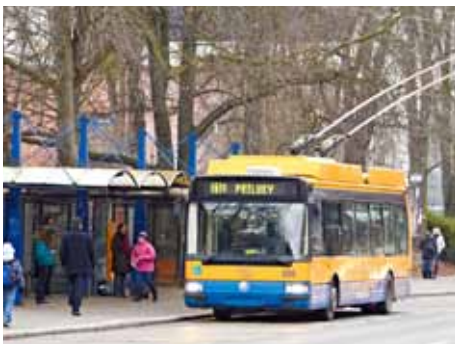
Cena jízdného se změnila.

V důsledku těchto důvodů bude v roce 2012 stát kubík vody obyvatele Zlína více než 83