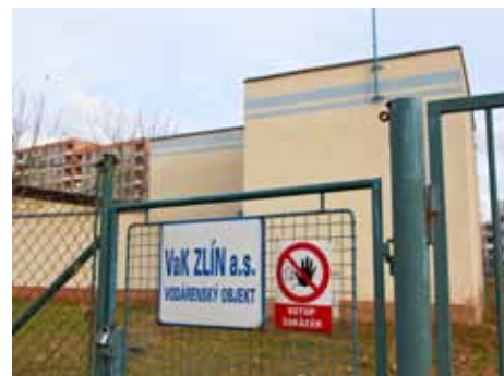
Město ceny vody neovlivní.