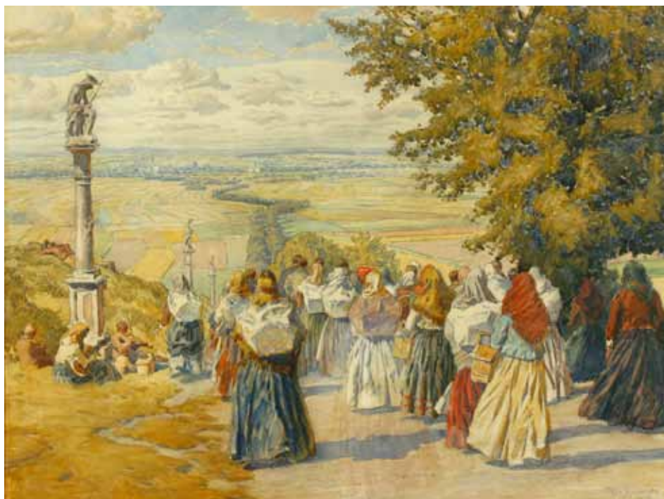
Adolf Kašpar, Pouť na Svatém Kopečku, 1909.