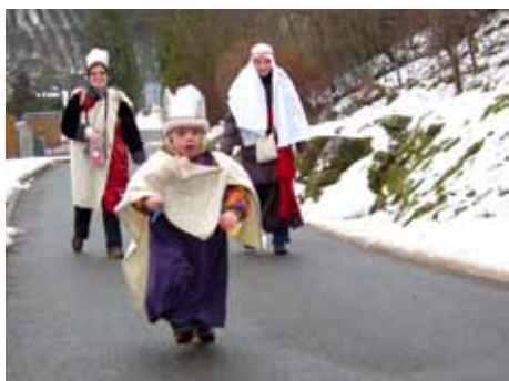
Koledníci z Kostelce.

„V regionu je můžete potkat ve dnech 1. až 8. ledna, ve městě Zlíně pak nejvíce králů bude v ulicích v sobotu 7. ledna 2012. Koledování bude zpestřeno o doprovodné akce. Ve středu 4. 1. je naplánována v 16.30 vernisáž fotografií My tři králové jdeme k vám ve vestibulu ZUŠ Zlín na Štefánikově ulici. Výstava fotek potrvá do 20. 1.,“ uvedla Pavla Romaňáková , regionální koordinátorka Tříkrálové sbírky. V pátek 6. 1. je naplánováno Tříkrálové putování městem. Setkání je naplánováno v 15.30 u kostela sv. Filipa a Jakuba ve Zlíně. V 15.45 se vydá královský průvod od kostela na náměstí Míru. V 16.00 trubači zahájí biblický příběh o putování Tří