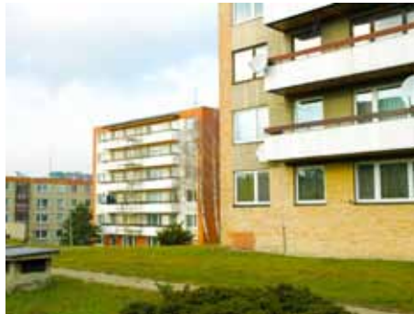
Nájemné poroste méně.

K další změně dochází v oblasti měsíčního nájemného v městských bytech. Z rozhodnutí předchozího vedení radnice se nájemné v městských bytech od roku 2007 pravidelně zvyšuje o předem stanovené částky. Zatímco v roce 2007 například platili nájemníci bydlící ve standardních bytech měsíčně za metr čtvereční 25,499 koruny, v roce 2012 měli platit již 84,53 koruny. Na zákla-