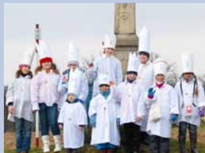
Tříkráloví koledníci z Klečůvky.

■ 400 000 Kč na přímou pomoc sociálně potřebným (nákup elektrického invalidního