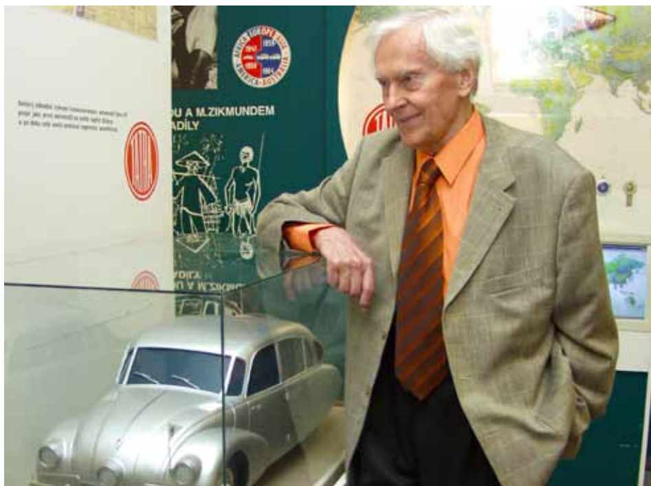
Miroslav Zikmund v expozici na zlínském zámku.