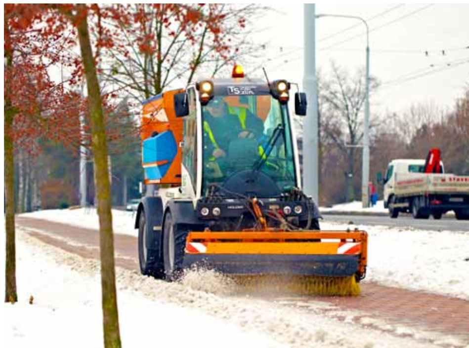
Technické služby udržují mimo jiné 137 kilometrů chodníků.

Projekt realizuje město Zlín, které v jeho rámci investuje částku 36,1 milionu korun, z nichž 30,1 milionu korun činí dotace. Partnery města v projektu jsou město Otrokovice, Dopravní společnost Zlín-Otrokovice a Zlínský kraj. [dvo]