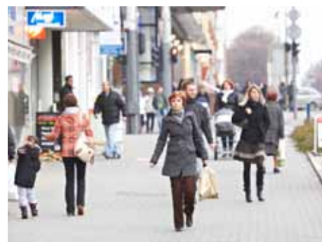
Chodníky jsou jednou z priorit.

Mezi zásadní investice, se kterými rozpočet počítá, lze zařadit i výkupy pozemků na ulici Březnická za 13 milionů korun. Pracovat se bude i na výstavbě cyklostezky spojující Zlín s Otrokovicemi. „Schválili jsme legislativní kroky vedoucí k projektové přípravě celé trasy s tím, že první část kolem obchodního domu OBI v Loukách by měla být realizována již v roce 2012. Další postup výstavby