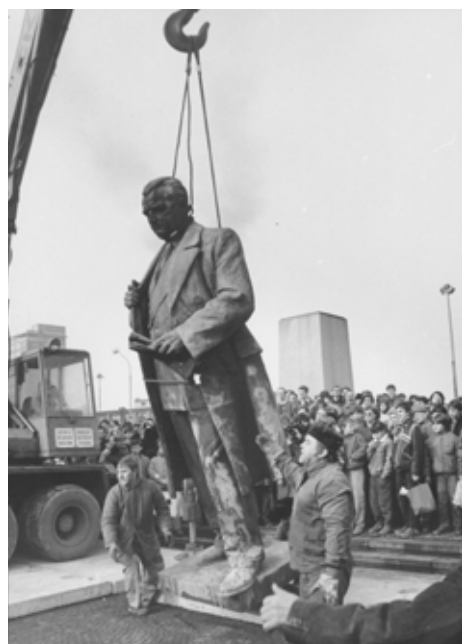
Demontáž 19. ledna 1990

Nevíme, zda ve prospěch Zdeňka Krybuse rozhodl hlas lidu nebo vůle zadavatele soutěže, ale samotná realizace se neuskutečnila roku 1958, jak bylo plánováno, nýbrž až o tři roky později. V mezidobí bylo navíc potřeba v tichosti uklidit z exponovaného místa na stejném náměstí sochu T. G. Masaryka, aby nekonkurovala monumentu prvního dělnického prezidenta.