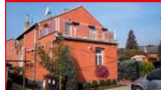
Zlín - Zálešná N05426

Zateplený půldomek s přístavbou ve čtvrti Zálešná - směrem k lesu. vkusně rekonstruován, zahrada 200 m 2 .