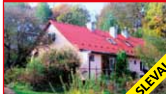
Zlín - Mokrá N05568