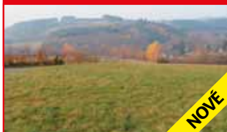
Lukov / okr. ZL N05711