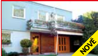
Želechovice / okr. ZL N05605