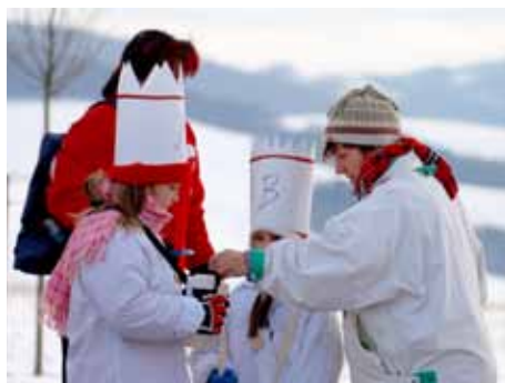
Přispějte do Tříkrálové sbírky.

Účelem sbírky je „pomoc rodinám a lidem v nouzi u nás i v zahraničí a podpora charitativního díla“. Výtěžek sbírky je určen především na pomoc nemocným, handicapovaným, seniorům, matkám s dětmi v tísní a dalším jinak sociálně potřebným. [bk]