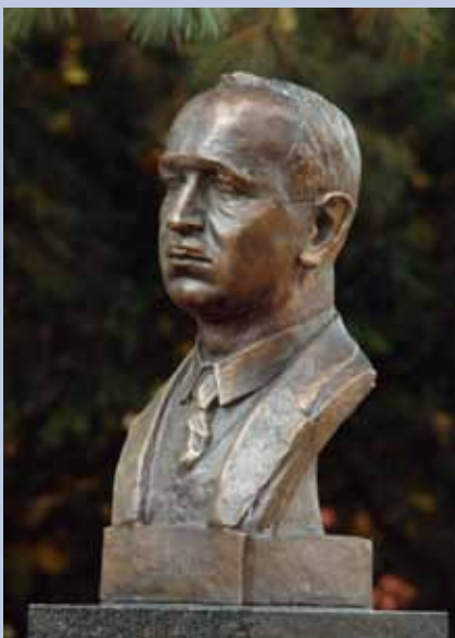
Busta prezidenta Beneše ve Zlíně

Umístění pomníčku s bustou prezidenta Edvarda Beneše hluboko v útrokách parčíku nedaleko rušné křižovatky na dolním konci ulice Dlouhá více než symbolicky vyjadřuje neujasněný postoj k politikovi, který stál u všech důležitých mezníků naší země mezi léty 1918 a 1948. Místo má sice jasnou logiku v tom, že sousedí s nábřežím nesoucím Benešovo jméno, ale přesto se náhodný návštěvník jen těžko zbaví dojmu jakési odstraněnosti, například v porovnání s umístěním sochy T. G. Masaryka či sousoším Bařů. Hlavní zásluha na vzniku pomníčku náleží členům Českého svazu bojovníků za svobodu ve Zlíně, kteří také zajistili výrobu kopie prezidentovy busty podle originálu umístěného v jeho rodišti. Slavnostní odhalení se uskutečnilo v sobotu 3. září 2005 u příležitosti výročí Benešova úmrtí. V květnu 2009 se busta stala terčem útoku vandalů, kteří ji vytrhli z podstavce a pohodili opodál. Zda šlo o cílený útok, nebo jen náhodný čin, se nepodařilo vypátrat. [vlk]