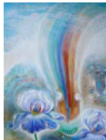
Ukázka tvorby.