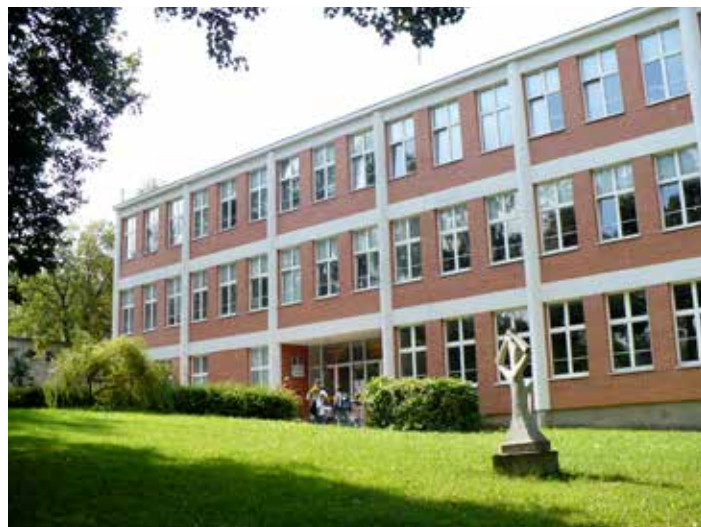
Škola bude slavit 20. a 21. října.