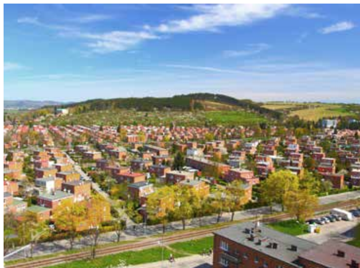
Stavebník musí ve Zlíně počítat i s památkovou zónou.

Vedle toho oddělení dopravně správních řízení řeší především uzavírky, objížďky, zábory veřejného prostranství, udílí parkovací karty hendikepovaným občanům, rozhoduje o odstranění vraků atd. „Těch činností je opravdu velká spousta. Kromě výše uvedeného