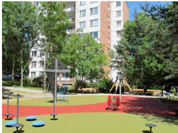
Další nová hřiště.

Desítky milionů korun se proinvestovaly během letních prázdnin ve školských zařízeních v majetku města. Z hlediska nákladů byla nejvýznamnější investice v základní škole na ulici Slovenská, kde byla vybudována přístavba a rekonstruovala se kuchyně. Náklady dosáhly výše 14 a půl milionu korun. Kuchyně se modernizovala – a to včetně zázemí – také v ZŠ Křiby. Zde šlo o investici za téměř 11,2 milionu korun. Přes 2,7 milionu korun stála rekonstrukce hygienického zázemí v základní škole na ulici Okružní. Seznam dalších nejvýznamnějších investic: Mateřská škola Zlín, Slovenská 3660 – rekonstrukce střechy, cca 1,4 milionu korun, MŠ Milíčova v Malenovicích – zateplení střech, cca 1,25 milionu korun, ZŠ Komenského 78, Zlín-Malenovice – nový vstup, cca 1,24 milionu korun, ZŠ Zlín, Mikoláše Alše 558 – rekonstrukce větrání šaten, cca 1,2 milionu korun.