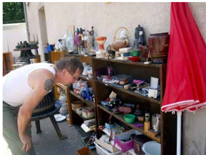
Pro útulek se vybralo 9 000 korun.

REK – kříženec knírač, 4 roky, temperamentní psík, zvyklý na pravidelné vycházky, vhodný pro akčního zájemce