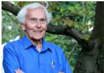
Století Miroslava Zikmunda.