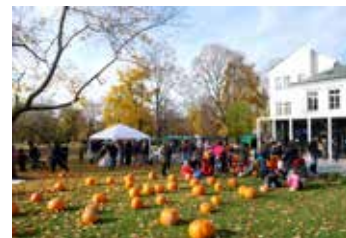
Park Komenského.

Skončil desetiletý energetický úsporný projekt, který umožnil v pěti základních a deseti mateřských školách snížit náklady na energii průměrně o 30 procent ročně při zachování tepelného komfortu. Stalo se tak díky poměrně jednoduchým technologickým a organizačním změnám. Průměrná roční úspora v každé škole či školce dosáhla výše 2,4 milionu korun. Zdeněk Dvořák