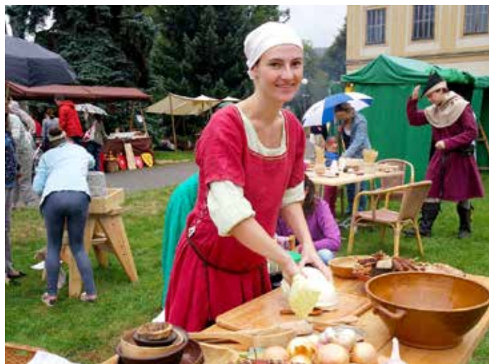
Pro současníky je středověk zajímavým historickým obdobím.

Lahůdky bude připravovat Jana Gazdošová, která patří k hlavním garantům středověkého progra-