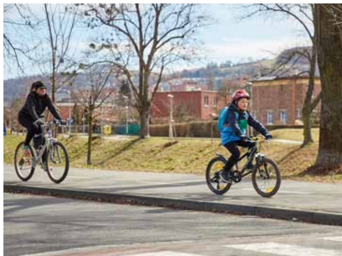
Podmínky pro cyklisty se stále zlepšují.

Také v letošním roce pokračovalo vylepšování podmínek pro jízdu na kole a in-line bruslích. Došlo k prodloužení cyklostezky vedoucí přes centrum města a to podél třídy T. Bati v úseku ulic Lorenčova – Podvesná XVII. Celkově je nový úsek dlouhý 1,4 kilometru. Prodloužila se i takzvaná páteřní cyklostezka podél řeky Dřevnice. Nový úsek o délce 4,25 kilometru vyrostl v úseku Příluky – Lužkovice – Klečůvka. Vybudována je i cyklostezka mezi zastávkou Zahradnická a ulicí Topolová. Jde o úsek dlouhý přibližně čtvrt kilometru. Cyklo doprava se ve Zlíně v posledních letech rychle rozvíjí. V současné době už má síť cyklostezek na území města délku více než 23 kilometrů.