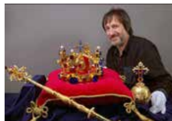
Repliky klenotů.

i více než 8 hodin, po kterých dostanou možnost exponát spatřit jen na malý okamžik. Není proto divu, že drtivá většina obyvatel ČR se jejich krásou nikdy nemůže pokochat. „Rozhodli jsme se proto připravit jedinečnou výstavu „České korunovační klenoty ve Zlíně“, která návštěvníkům umožní tento unikátní poklad do detailu poznat a zároveň si i bez jakéhokoliv rušení prohlédnout mistrovské repliky klenotů,“ vysvětlil Petr Lukas .