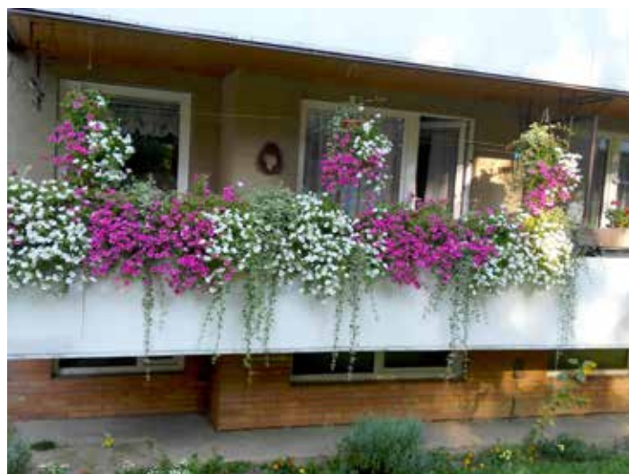
Soutěž se setkává s velkým ohlasem veřejnosti.