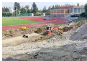
Stadion mládeže se mění.

Výraznými změnami prochází v poslední době Stadion mládeže na ulici Hradská. Na sportovišti, které je využíváno kromě školáků také atlety, ragbisty a baseballisty, se aktuálně opravují tribuny