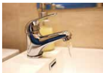
Voda: dobré zprávy.

Komplexní systém ochrany, který je v rámci České republiky ojedinělý, město dobudovalo v letošním roce. Do systému ochrany bylo zahrnuto 52 školských zařízení, zřizovaných městem i jinými subjekty. Celkem jde o 21 základních škol, 27 mateřských škol, troje jesle a jeden stacionář. Pedagogové, kteří v nich pracují, jsou vybaveni 194 tísňovými tlačítky – pevně nainstalovanými i mobilními.