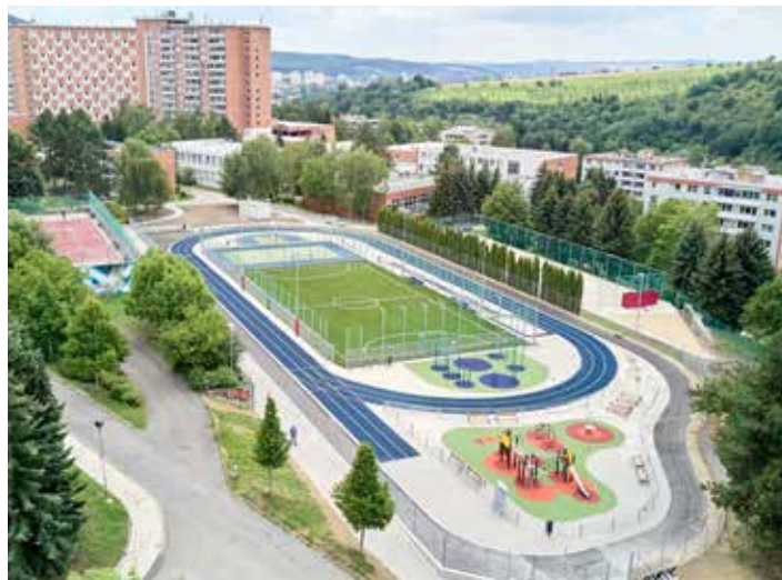
V areálu ZŠ Okružní vyrostlo nové sportoviště. Pro školáky i veřejnost.

a staticky porušené opěrné zdi a chodníky. V rámci stavebních změn dojde také k vybudování nového baseballového odpaliště a je navržena obnova travnaté tréninkové plochy pod opěrnou zdí. Vše by mělo být hotovo do konce tohoto roku. Náklady přesáhnou 10 milionů korun.