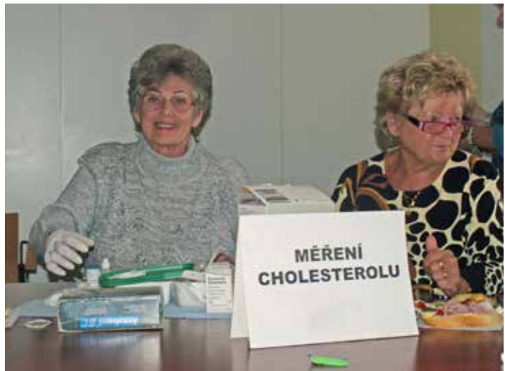
Týden zdraví je už tradiční akcí.