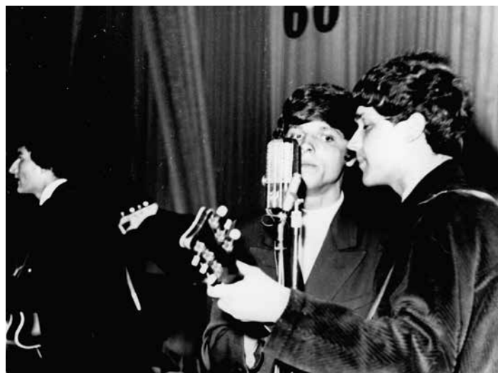
Město má zajímavou bigbitovou minulost.