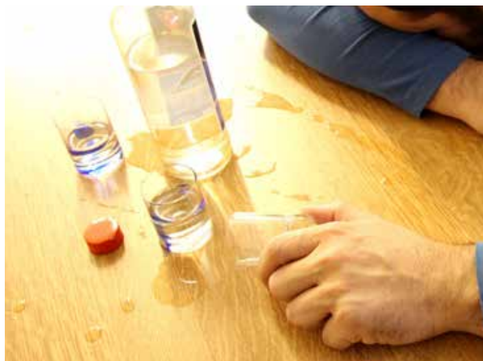
Porazit závislost patří k největším životním úspěchům.

Vzniklo v třicátých letech minulého století ve Spojených státech amerických. V tehdejší Československu se objevilo v osmdesátých letech. Dnes má řadu poboček, v podstatě v každém větším městě. Má dvanáct tradic, kterými se jeho členové řídí. Nepřijímáme žádné dary, základem je anonymita. Scházíme se na pravidelných sezeních, kde kolektivně řešíme svůj problém s alkoholem. V České republice se skutečně kolem padesáti takových sezení týdně. Kdo má potřebu, může je navštěvovat