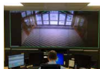
Školy a školky pod kontrolou.