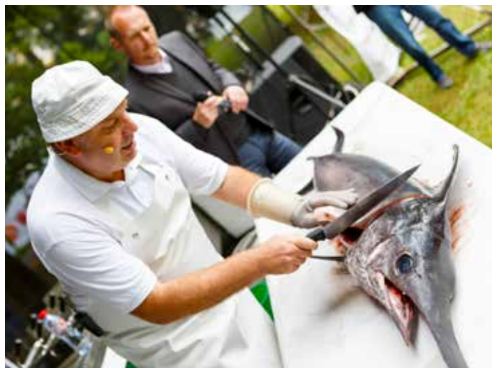
Návštěvníci se mohli podívat i na přípravu ryb. / foto: GFF

Garden Food Festival je regionálním festivalem dobrého jídla a pití. Projekt si klade za cíl dlouhodobě ukazovat široké veřejnosti, že v daném regionu je řada kvalitních restaurací a kuchařů, kteří dělají svoji práci s radostí a dobře. Projekt podporuje i místní výrobce a farmáře. [tz]