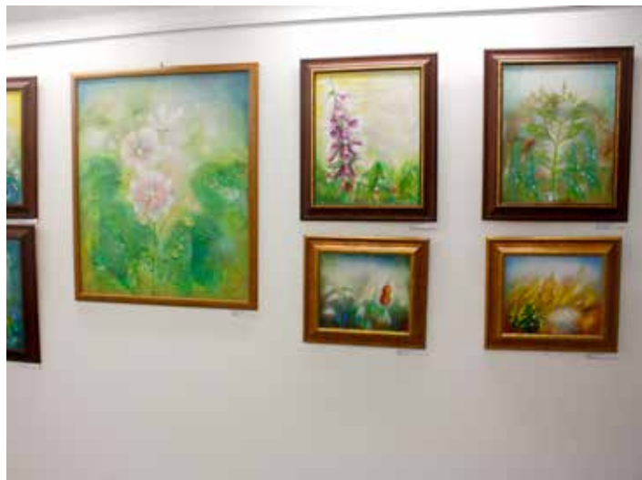
Ukázka tvorby.

Pro tvůrčí práci výtvarnice Jarmily Příbylové jsou nevyčerpatelným zdrojem inspirace přírodní krásy, folklor a lidé. Vkládá je do svých snových poetických maleb a grafiky, ale prolínají i do uměleckých návrhů zdobících veřejný prostor. V devadesátých letech stála u zrodu projektu tzv. barevných škol. Na základě poznatků o pozitivním působení barev na psychiku člověka jsou ve Zlíně a okolí vymalovány a výtvarně zpracovány desítky školních interiérů. Její návrhy těší například i návštěvníky dětského bazénu ve Zlíně nebo malé pacienty dětského oddělení v Baťově nemocnici. Jarmila Příbylová kromě výtvarné činnosti působí bezmála čtyřicet let jako pedagožka. „Pedagogická práce je nesmírně obohacující pro obě strany, učím stále s velkou radostí,“ podotkla v duchu svého přesvědčení, že náš životní záměr by měl prospívat ostatním. Intenzivně se věnuje arteterapii a artefiletice. Její tvorbu od 5. října představí Alternativa výstavou Ladění.