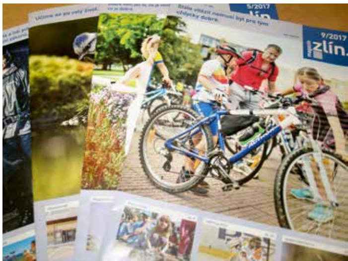
Časopis vydávaný městem je dlouhodobě dobře hodnocen.