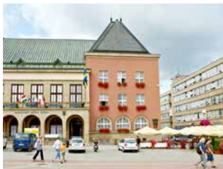
Vyhlášky jsou velmi platným nástrojem

Obecně závazná vyhláška č. 2/2013 o podmínkách užívání dětských hřišť a sportovišť v majetku statutárního města Zlína pak upravuje pravidla pro užívání veřejně přístupných hřišť a sportovišť ve správě odboru městské zeleně Magistrátu města Zlína. Mezi nejčastější problém patří ros-