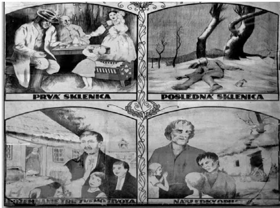
Ukážka z dobovej učebnej pomůcky, ktorá varuje pred následky pitia. Dostupná bola v niekdajšom muzeu v Myjavě.

ný význam, lebo chlieb bol považovaný za Boží dar. Po príprave sudov a výbere ich umiestnenia začíná príprava kvasu. Gazda sa denne po práci vyšiel pozrieť do sadu alebo ovocnej záhrady. Každú spadnutú slivku zdvihol a doniesol domov. Podľa kvality ju roztriedil na sušenie, lekvár alebo slivovicu. Tú, ktorú určil na slivovicu, hodil do suda. Slivky neumýval. Keď bola niekto-