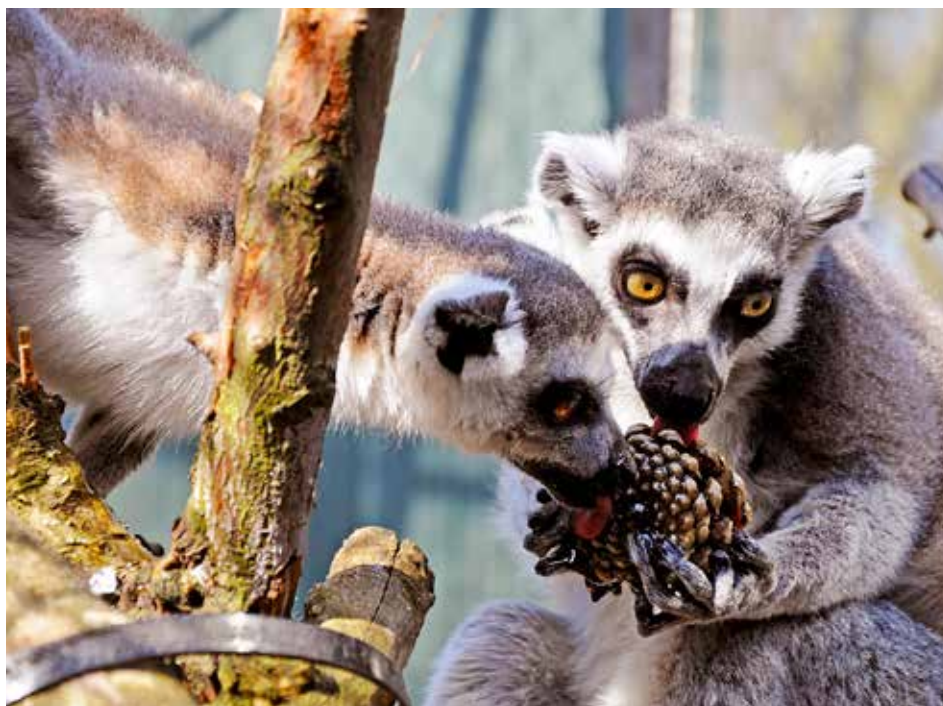
Jedním z lákadel jsou lemuři.

odpovídala Romana Bujáčková, vedoucí oddělení marketingu