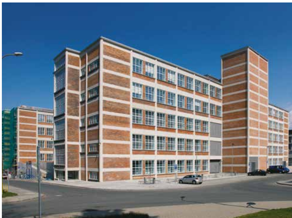
Budova 14 se otevírá v květnu.