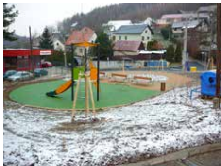
Jaroslavice - revitalizace prostoru bývalé točny MHD.

Příprava projektu „Úprava zastávky MHD U Hřiště včetně rekonstrukce mostu přes Chlumský potok“, který je v havarijním stavu. Akce bude financována z rozpočtu města Zlína na rok 2013, finanční odhad činí 3,5 milionu korun.