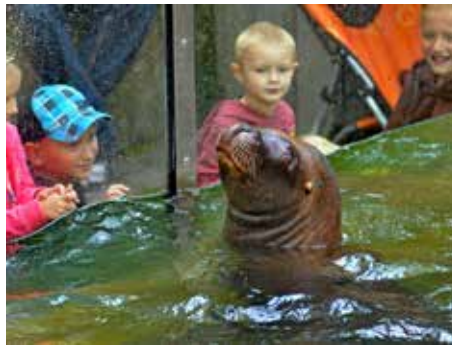
Na všechno je vidět zblízka.