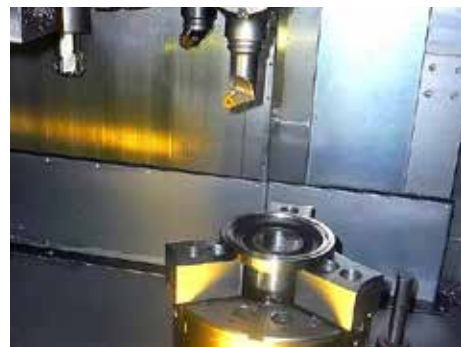
Ilustrační foto ZPS Prefix.