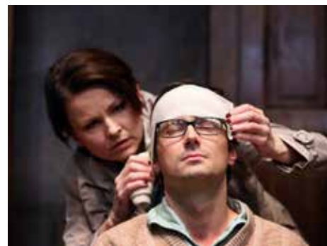
Představení Racek, Dejvické divadlo.

„Opět vzdáme hold tomu nejlepšímu, co se na česko-slovenském dramatickém poli urodilo, a ponoříme se do nostalgie. Na tři dny se ve Zlíně zrodí divadelní Československo, ve kterém by nám všem mělo být dobře,“ těší se šéfka úseku vnějších vztahů Vladimíra Dvořáková . Ve Zlíně se