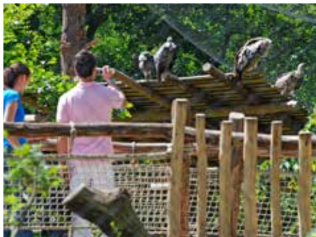
Průchozí voliéra supů.

Zoo dokázala „přetavit“ ve svůj prospěch i na první pohled očividný handicap: polohu Zlína. Po rozpadu Československa se z města uprostřed státu stalo sídlo pohraniční, se všemi svými nedostatky včetně dopravní dostupnosti. V případě zoo ale trvá nadále federace. Slovinci totiž vzali Lešnou za svou a dnes tvoří pětinu z celkového počtu návštěvníků. Prostě, hranice pro ně není pro-