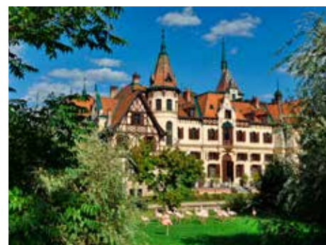
Zámek Lešná.

Když jsme u plusových bodů, nelze nezmínit i prohlídku 11 pokojů zámku Lešná, dva moderní vstupy do areálu, pět stylových restaurací, kvalitní toalety, bezbariérové přístupy pro hendikepované občany, možnost platby kartami či Eury, nabídku rodinného vstupného nebo třeba možnost