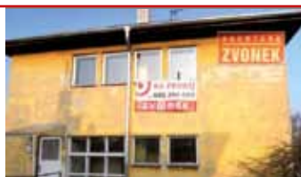
Zlín - Mladcová N05665

Půldomek 5+1 se samostatným vchodem v klidné lokalitě, zahrada okolo domu, celkově podsklepeno.