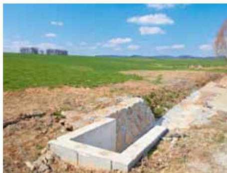
Štípa - odvodňovací příkop.

Lidé ze Salaše mají největší starost o zachování jediné prodejny potravin, která zde funguje. Město proto připravilo důležitý projekt přestavby bývalé mateřské školy, který se začal realizovat až v roce 2012. V roce 2011 bylo čerpáno pouze 77 000 korun, a to zejména za společenské aktivity v místní části.