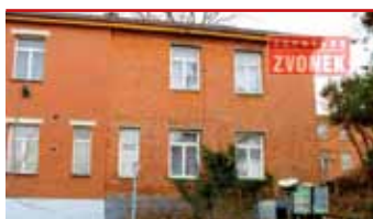
Zlín - Letná N06334

Čtvrtdomek 3+1, část. podsklepený, rekonstrukce podlah, zpevněné stropy, výborná dostupnost do centra.