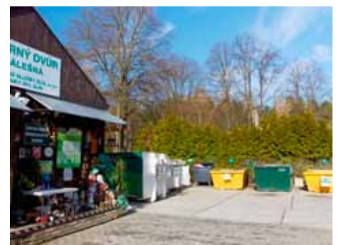
Zářivky lze odevzdat ve sběrném dvoře.

recyklačních firem. Zde jsou pro opětovné použití získávány především kovy, plasty, sklo a rtuť. Hliník, mosaz a další kovy se mohou znovu použít v kovovýrobě. Recyklované plasty jsou surovinou pro ztravněvací dlaždice či plotové dílce a přečištěná rtuť je znovu využívána v průmyslové výrobě. Sklo se používá jako technický materiál nebo i pro výrobu nových zářivek. Opětovně je tak možné pro další výrobu použít až 90 % materiálu, ze kterého byla zářivka vyrobena. Více na www.ekolamp.cz . [red]