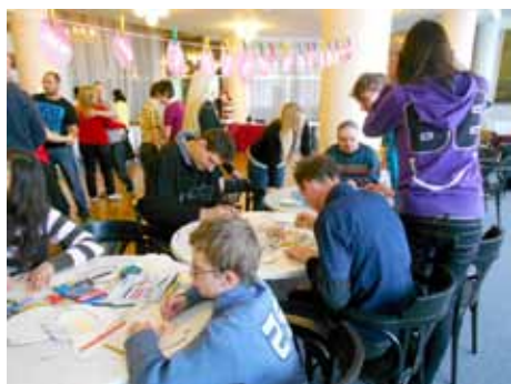
Skládanka je oblíbená.