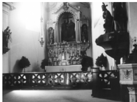
Hlavní oltář roku 1942