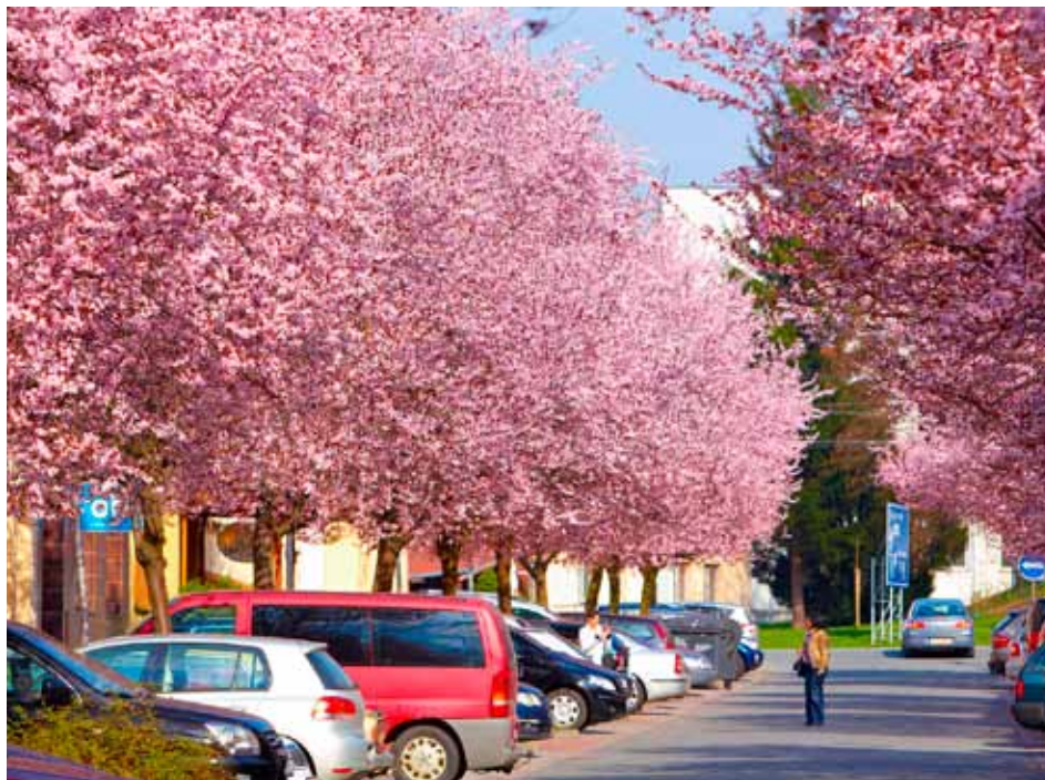
Na území Zlína roste asi 100 tisíc stromů.

Bylo. Z mnoha důvodů. „Stromy ve městě je nutné pravidelně obnovovat - odstraňovat jedince staré, nemocné, nebezpečné, nevhodně či nekoncepčně vysazené. Mnoho stromů roste také na inženýrských sítích, v bezprostřední blízkosti fasád domů. I ty je potřeba průběžně odstraňovat,“ upozornil Bedřich Landsfeld, náměstek primátora, do jehož kompetencí patří životní prostředí, a odborník, který se dlouhodobě zabývá ochranou přírody.