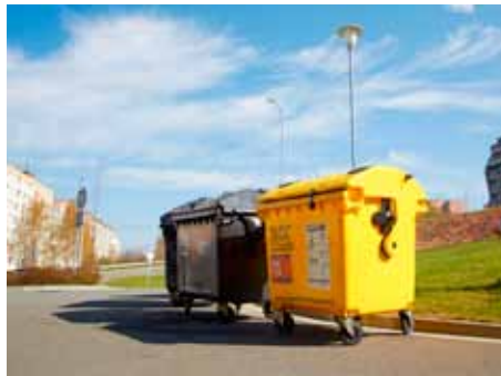
Žluté kontejnery už nejsou jen na plasty.

Svážení žlutých kontejnerů s plasty a nápojovými kartony zajišťují Technické služby Zlín. Jejich obsah poputuje na dotřídovací linku, jejíž pracovníci různé druhy plastů a nápojové kartony ručně oddělí. Odtud pak roztříděné obaly poputují k dalšímu zpracování. Nápojové kartony se skládají až ze tří materiálů – kvalitního papíru, kovové a plastové folie. Zájem o recyklaci papírové složky mají papírny, plast a hliník mohou sloužit k výrobě různých předmětů. Častější způsob recyklace nachází uplatnění ve stavebnictví - obaly od nápojů se rozemelou a následně se působením tlaku a tepla lisují do podoby izolačních desek. Z těch se v současnosti montují dokonce celé domy. [mg]