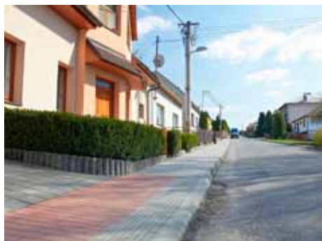
Mladcová - chodník v ulici Fr. Bartoše.

Místní část Malenovice má vzhledem ke své rozloze a počtu obyvatel dvě pověřené kanceláře, ve „starých“ Malenovicích a na sídlišti. Mezi nejvýznamnější akce loni patřila I. etapa rozšíření komunikace na ulici Mlýnská za asi 2,7 milionu, z provozních akcí to byla např. oprava povrchu silnice v ulici Žleby a oprava chodníku v ulici Tečovská. Na sídlišti udělalo lidem největší radost vybudování parkoviště s přílehlými chodníky u obchodu Tesco Express (pod Belvederem), oprava silnice v ulici Husova za domem č. 786-8 a před domem 795-7 a chodník na ulici Husova od domu č. 794 až po č. 849, který byl opravdu v dezolátním stavu. V neposlední řadě je nutné zmínit projektovou přípravu akce „Regenerace panelového sídliště“, jejíž I. etapa se má začít realizovat v letošním roce. Celkem stihli v Malenovicích v roce 2011 proinvestovat 6,5 milionu korun.