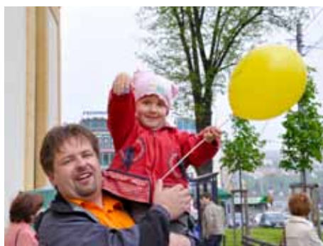
Děti poutě milují.

V předvečer pouti, v sobotu 5. května, se v kostele odehraje koncert známé