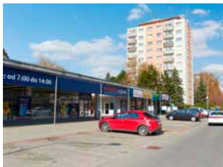
Malenovice - parkoviště s chodníkem u Tesca.

revitalizace návsi a zbudování víceúčelové budovy, ve které by vznikla hasičská zbrojnice a místnost pro celospolečenské aktivity.