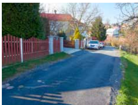
Kudlov - komunikace Do Polí.

K významným investičním akcím roku 2011 patřilo dokončení projektové přípravy revitalizace Kostelce. V Kostelci stihli v loňském roce vyčerpat 1,36 milionů korun z přidělených finančních prostředků, nevyčerpané finance z minulého období ve výši téměř 4 mil. Kč budou použity v roce 2012 na realizaci akcí v rámci zmíněné revitalizace. Lidé se dočkali také zpevnění spojovací uličky mezi ulicemi Zlínská a Za humny, nebo vybudování spojovacího chodníku z ulice Jabloňová k ulici Za Humny. A nejen obyvatelé Kostelce ocenili opravený chodník podél ulice Lešenská a příjezdovou cestu ke hřbitovu, který se nachází v katastru Kostelce.