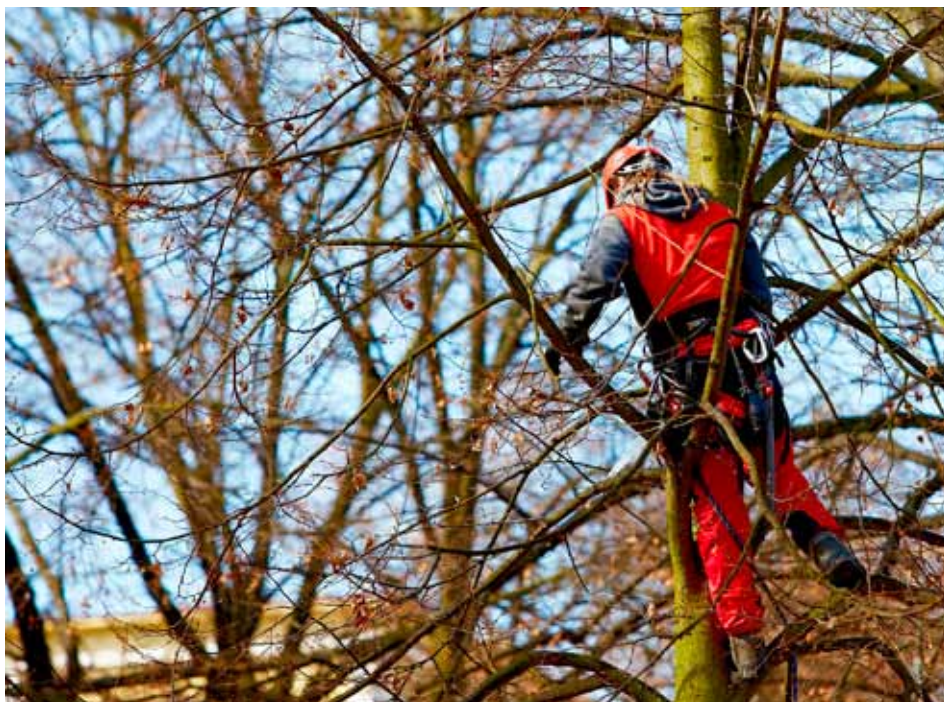
V příštích třech letech se dočkají odborného ošetření asi tři tisíce dřevin.

Informace o stromech jsou na portále u většiny z nich kompletní. U každého zmapovaného stromu se zájemce dozví údaje o druhu, věku, výšce nebo vývoje stádu, ve kterém se dřevina nachází. Důležitou informací je také perspektiva, jakou před sebou strom má, doporučená technologie ošetření či kácení nebo třeba datum poslední kontroly. „Tyto informace mohou poskytnout laické veřejnosti vysvětlení některých nezbytných zásahů prováděných na stromech rostoucích v okolí jejich bydliště,“ jsou přesvědčeni tvůrci projektu. Zdeněk Dvořák