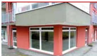
Zlín - Na Honech I N05888

Prodej 4 nebytových prostor v novostavbě s technickým zázemím. Vhodné jako obchod, kancelář.