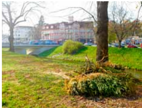
Mění se i aleje podél Dřevnice.

Po kliknutí na zelený banner Stromy pod kontrolou, který je umístěn v levém sloupci, a zadání klíčového slova Zlín se objeví fotografická mapa s červenými kolečky, která po „rozkliknutí“ ukáže údaje o konkrétním stromu či stromech. Databáze o zlínských stromech se neustále doplňuje a rozšiřuje. Cílem města je, aby v konečné fázi v ní bylo možné najít infor-