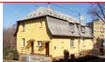
Zlín - Kotěrova N06265

Čtvrtdomek Kotěrova, Zlín - centrum, bytová jednotka 3+1 se nachází v horní patře, nová koupelna, topení, zahrada.