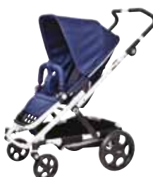
Brio GO Navy