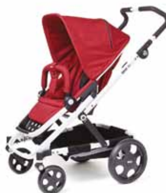
Brio GO Red

Akce platí do vyprodání zásob jen na omezený počet kusů od 1.5.2012 do 31.5.2012