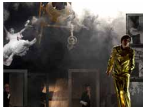
V programu jsou i Světáci.

Festival je určený i odborníkům. Každoročně ho navštěvuje řada divadelních kritiků, režisérů, dramaturgů i studenti divadelních škol. Od úterý do soboty se mohou zúčastnit rozborových seminářů jednotlivých inscenací v Dílně 9472, vždy od 14 hodin. [mz]