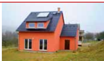
Provodov - novostavba N04450

Prodej dřevostavby typu Nova 101/38 včetně pozemku 1.135 m 2 a spodní stavby v klidné lokalitě obce Provodov.