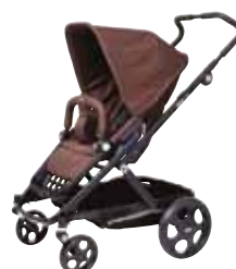
Brio GO Brown