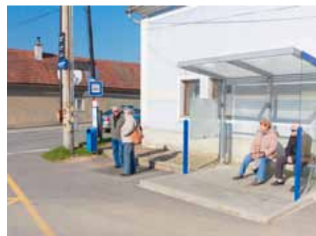
Lužkovice - nová krytá zastávka na točně MHD.

V místní části Louky stihli v loňském roce vyčerpat 876 tisíc korun. Mezi nejvýznamnější akce patří realizace chodníku na ulici Zábrační I a zhotovení projektové dokumentace na lávku přes Dřevnici k OBI. Podařilo se vyčistit a natřít kašnu i zábradlí kolem Chlumského potoka.