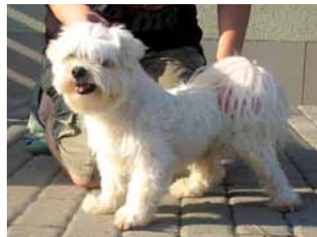
Gogo je temperamentní.

GOGO – asi sedm roků starý maltézský pinč, který byl nalezen na Jižních Svazích u I. segmentu v srpnu 2011. Je trochu složitější povahy, protože se už projevil jako velice sebevědomý malý psí hoch, který by nejraději řídil celý svět. Zřejmě byl od mládí rozmazlovaný, ale není zase tak starý, aby při dobrém vedení nepochopil, kdo je pro něho pánem. Pokud to nepochopí, bude odsouzený zůstat v útulku do konce svého života. [dvo]