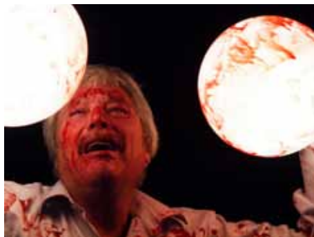
Do Zlína míří Juraj Kukura.