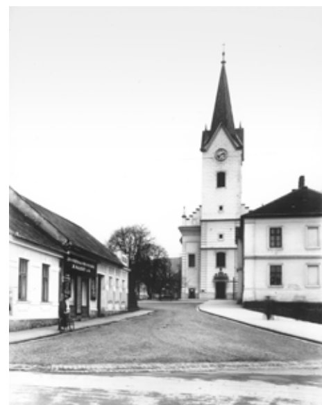
Pohled od jihu / foto 1924, Státní okresní archiv Zlín