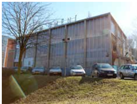
Přestavba památníku pokračuje.

Stavební práce na obnově Památníku Tomáše Bati se díky příznivému počasí rozběhly naplno. V současné době se odstraňují boční přístavby k hlavní budově. Obnova památníku postupuje bez problémů a dle plánu. „Na přelomu března a dubna zahájíme práce na odvodnění svahu za budovou a také na podzemním objektu, ve kterém bude část zázemí památníku,“ sdě-