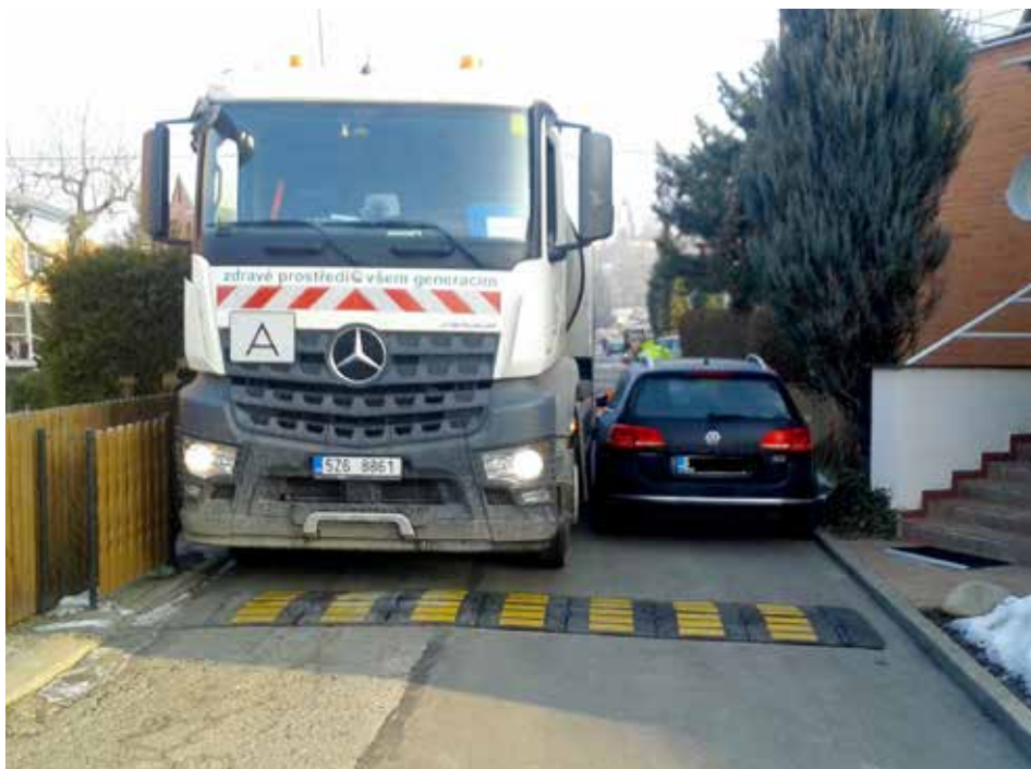
Je to problém. Vozy TS Zlín se často k nádobám na komunální odpad nedostanou.