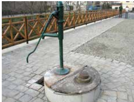
Voda je nejen pro Zlín velké téma.

Platnost či neplatnost smlouvy o nájmu a provozování vodárenské infrastruktury musí být podle zlínské radnice v návaznosti na usnesení Vrchního soudu v Olomouci důsledně posouzena. „Primárně o této věci rozhoduje okresní soud. Věříme, že po vynesení usnesení Vrchního soudu týkajícího se neplatnosti valné hromady z 30. dubna 2004 věc rychle projedná. Existují však právní názory, že jak smlouva o prodeji části podniku, tak i smlouva o nájmu a provozování infrastruktury budou návazně na usnesení Vrchního soudu prohlášeny za neplatné. Posouzení platnosti či neplatnosti obou těchto smluv je pro další postup města Zlína klíčové. Právě z těchto důvodů jsme zadali připravit komplexní analýzu platnosti obou smluv,“ upozornil Patrik Kamas a dodal: „Na právní analýzu bude poté navazovat nezávislá ekonomická analýza. Ta bude sloužit jako podklad pro další vyjednávání s MOVO, než rozhodne Okresní soud o provázanosti smluv. Současně by tato analýza měla ukázat další možné scénáře provozování vodárenské infrastruktury, včetně vyčíslení ekonomických přínosů a rizik.“