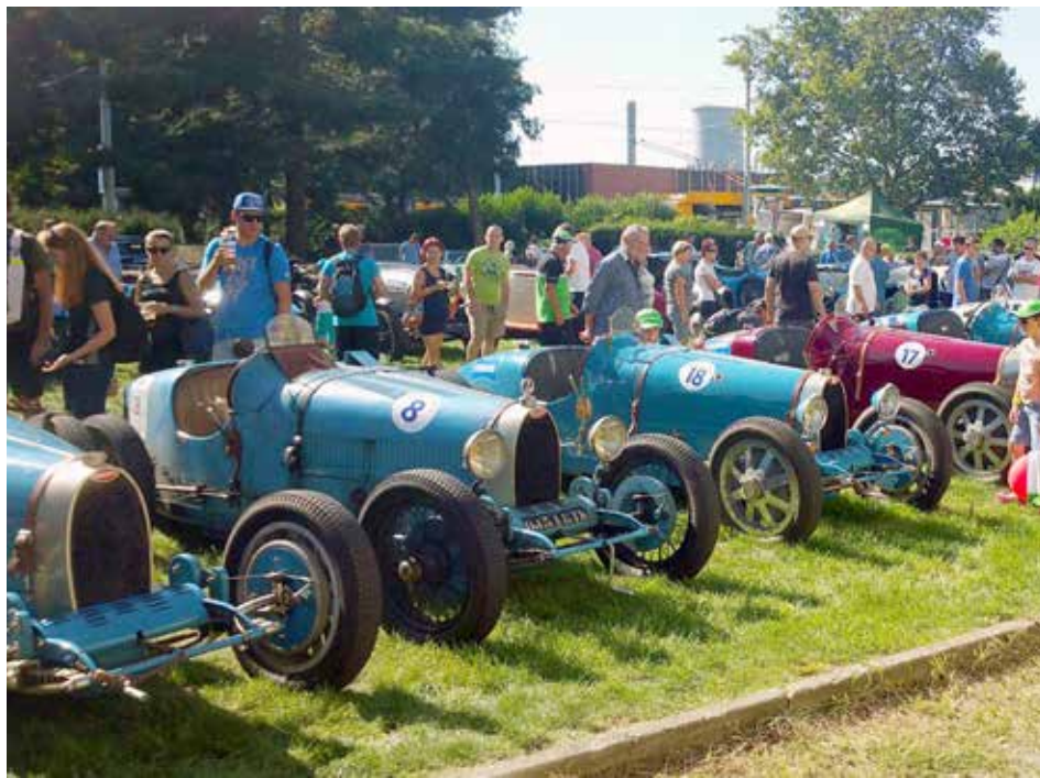
Fanoušky rally čeká nezapomenutelná událost.