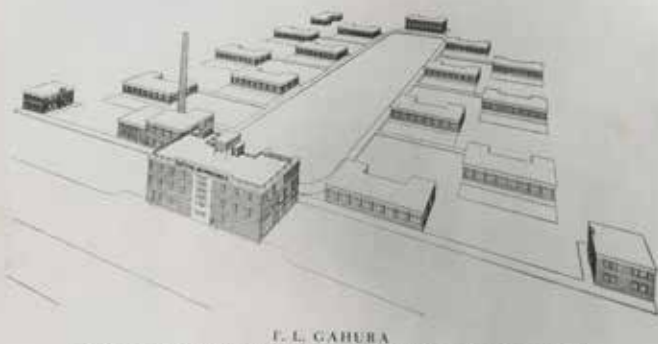
F. L. GAHURA PERSPEKTIVNÍ SCHEMA BAŤOVY NEMOCNICE

Uchazeči, podejte ihned své žádosti na zdravotní oddělení fy. T. a A. Baťa ve Zlíně.