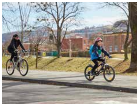
Cyklistika se rozvíjí.

Soutěžící obdrží od pořadatele akce startovní balíčky, jejichž součástí jsou bavlněná trička s logem soutěže. Hraje se také o zajímavé ceny a soutěžící se mohou zúčastnit i řady doprovodných akcí. [fab]