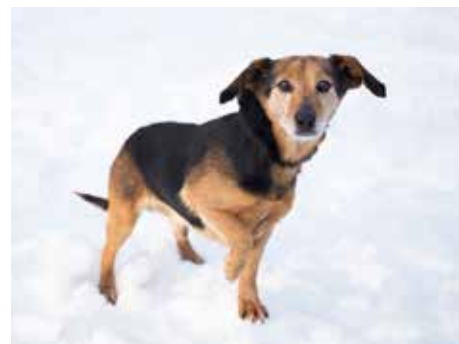
RIK. / foto: útulek