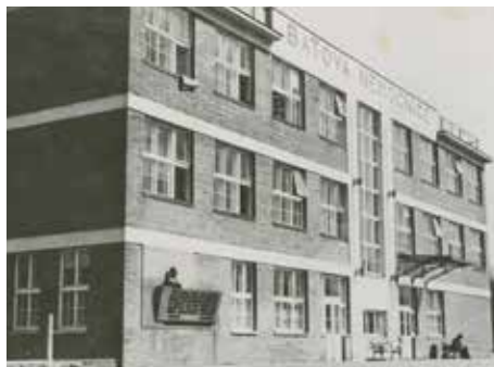
Původní budova nemocnice.

v Československé republice, ale i ve střední Evropě. Úspěch však nebyl jen dílem lékařských, organizačních a vizionářských schopností doktora Alberta, ale také tvrdou prací a oddaností pracovníků k nemocnici. Být její součástí bylo ctí. Úspěh ale nebylo vůbec jednoduché. Tak jako všichni v Baťově systému, podléhali i primáři a lékaři pravidelným přísným kontrolám a hodnocením. Dů-