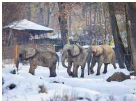
Odchov slonů afrických je obtížný.

Samotná inseminace znamenala teprve začátek celého procesu reprodukce. Velmi důležitý byl pro Zoo Zlín leden 2017. Vědě v tomto období se dle provedených testů měla dozvědět, zda je slonice Zola březí. Z německé společnosti Hormone Laboratorij Göttingen, která po celou dobu prováděla