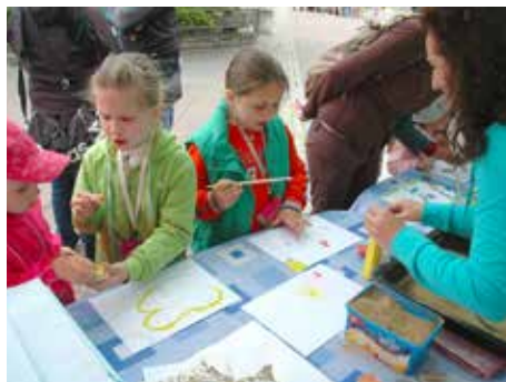
Jednou z činností je podpora aktivit dětí.

Odbor sociálních věcí patří na zlínském magistrátu k těm větším. A to jak z hlediska počtu zaměstnanců, tak z hlediska šíře činností, které musí vykonávat. Odbor s více než čtyřiceti pracovníky vede Jana Pobořilová. Na odboru pracuje od roku 1994, kdy nastoupila jako vedoucí oddělení péče o děti. Vedoucí celého odboru je od roku 2001.