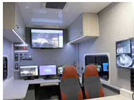
Interiér mobilní služby.

Součástí autonomního technického řešení je výsuvný pneumatický teleskopický stožár s otočným manipulátorem (výsun do výše 5,6 m), na kterém jsou umístěny dvě kamery (kamera s vysokým rozlišením a thermo kamera). Pod manipulátorem je připevněna pevná kamera s vysokým rozlišením. Stávající řešení umožňuje připojení na metalickou i optickou síť, disponuje také připojením na internet. Posádku mohou tvořit až čtyři osoby a operátor. Počítá se rovněž s integrací kamer do Městského kamerového dohlížecího systému. [dvo]