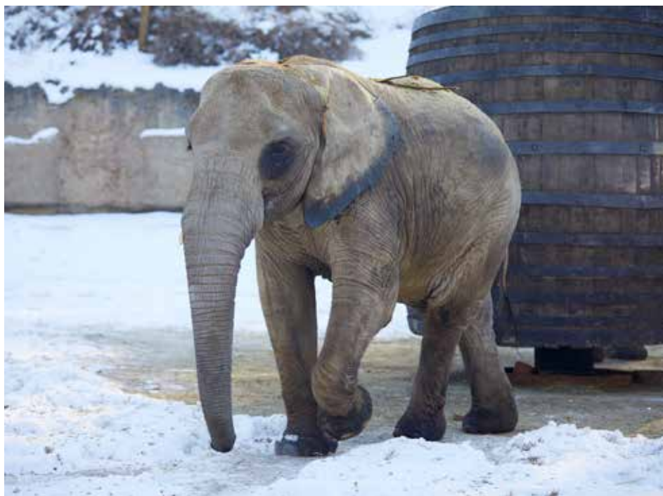
Je velká naděje, že se sloní stádo ve zlínském zoo rozroste.