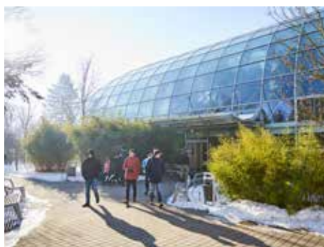
Zlínská zoo je oblíbená.

Hlavní dominantou bude chovné zařízení pro slony odpovídající nejnovějším poznatkům a standardům chovu a rozmnožování afrických slonů. Kromě slonů se tato oblast stane domovem dalších zástupců africké fauny, a to primátů, šelem, afrických kopytníků a pravděpodobně i hrochů. [dvo, buj]