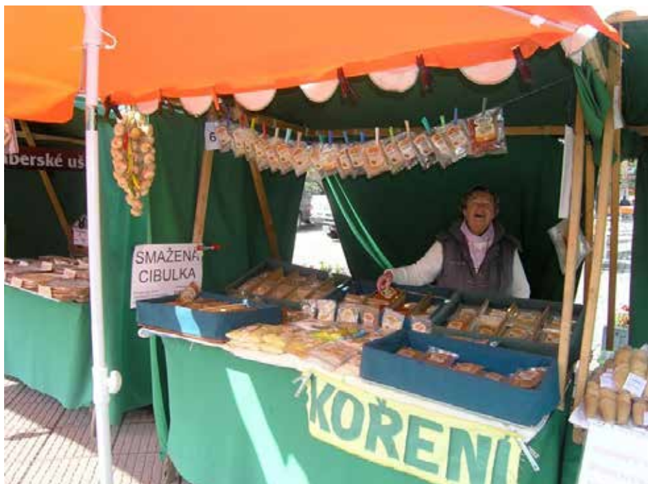
Tyto stánky patřily dlouhé roky k jarmarkům na náměstí Míru.

Správní rada Fondu zdraví města Zlína vyhláší program/výběrové řízení na ocenění bezpříspěvkových dárců krve. Příjem žádostí je od 13. 2. do 28. 2. do 12.00. Bližší informace: Oddělení prevence kriminality a sportovišť MMZ (pracoviště Zarámí 4421), J. Richtrová, tel. 577 630 330.