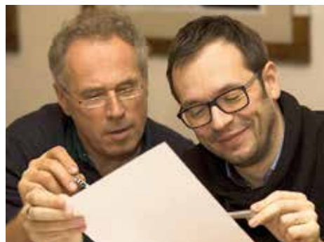
Má za sebou řadu rolí.

My jsme konkurenty vlastně pořád, což je ale dobře, protože nás to bičuje k lepším výkonům. Ale jsme i kamarádi, protože si říkáme, kdoví, kdy třeba u nás ve Slováckém divadle zase někdo otěhotní a budeme hledat nějakou šikovnou herečku. Ne samozřejmě na angažmá, to by jí hrozilo něco podobného, ale jen tak na výpomoc.