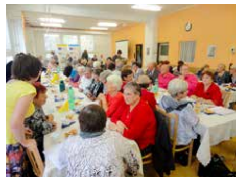
Ve Zlíně funguje už 16 klubů seniorů.

Mezi činnostmi vykonávanými v rámci samosprávy, tedy pro město Zlín, patří například provoz šestnácti městských zlínských klubů seniorů. Senioři jsou ve Zlíně velmi aktivní. Věnují se kultuře, sportu i vzdělávání. Jen v minulém roce vznikly ve městě další tři kluby. Odbor zajišťuje zázemí jejich provozu, program si většinou zajišťují sami senioři. Pořádají například poznávací zájezdy, přednášky a realizují se v nejrůznějších kroužcích. Pořádání akcí pro seniory je jednou z tradičních náplní práce odboru. Ve Zlíně se tak koná například tradiční akce I senioři umí žít naplno. V rámci projektu Můj domov – region Bílé Karpaty se navíc vzájemně navštěvují senioři ze Zlína a z Trenčína a mohou tak poznávat kulturu