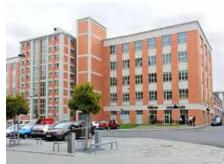
V soutěži budují i „zlínské stavby“.

tví ČR ve spolupráci s Českou komorou autorizovaných inženýrů a techniků. Přihláška do soutěže Stavba roku 2016 Zlínského kraje je k dispozici na webu města www.zlin.eu nebo v oddělení urbanismu a architektů MMZ na radnici. Projekty lze přihlašovat do 17. března 2017. [dn]