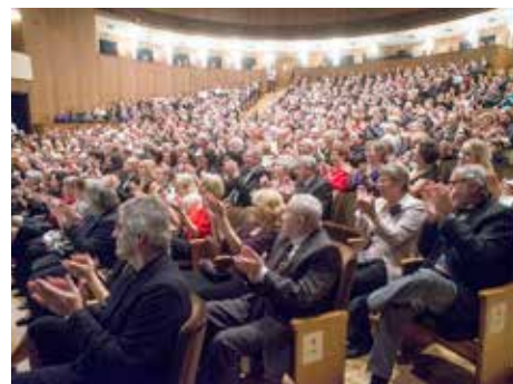
Loni divadlo přivítalo 136 814 návštěvníků.