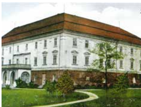
Zámek na pohlednici, začátek 20. století

V té době už všichni usilovně pracovali na důležitém záměru - aspoň trochu vymanit Zlín ze závislosti na vzdálených úřadech a prosadit zde zřízení okresního soudu. Štěpánek, Masaryk, Haupt a další spojenci žádali, intervenovali, prosili a hrozili,