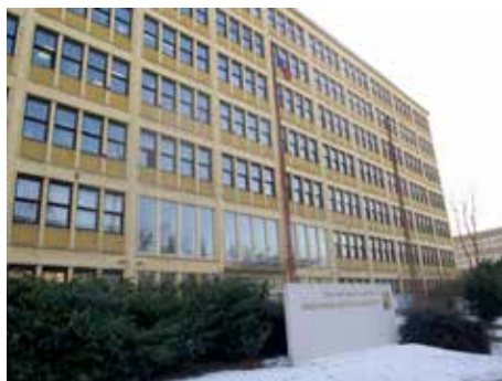
Budova, v níž odbor sídlí (ČSSZ).

„Například nesvéprávným osobám se staráme o jejich účty, dávky, dluhy. Pomáháme jim řešit bydlení či třeba lékařskou péči nebo sociální služby,“ vysvětlila Jana Pobořilová . Pod sociální kuratelou si zase představte práci kurátorů. Ti pracují s lidmi, kteří jsou například propuštěni z výkonu trestu a kurátor jim má pomoci k návratu do běžného života. Pro ilustraci, takových lidí je na Zlínsku během roku cca 150. Pracují také s lidmi bez domova. Kurátor pro děti a mládež pak zase pracuje s takzvaně problémovými dětmi či mládeží. Na tomto odboru si také můžete vyřídit parkovací