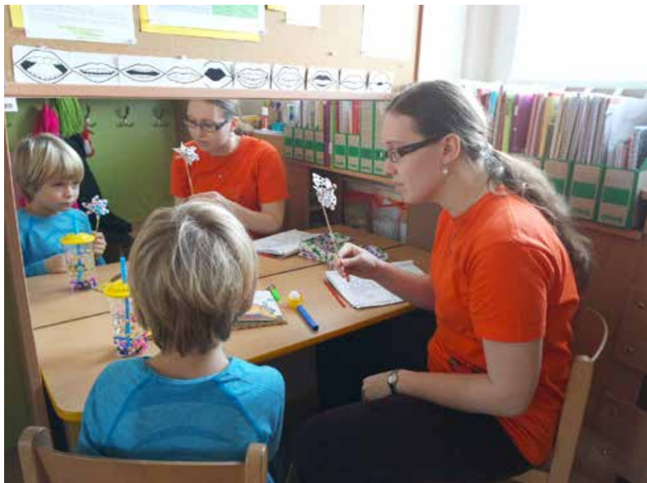
Ve specializovaných třídách se dětem dostává odborné péče.

Logopedické třídy Na Vyhlídce a v Malenovicích nepracují pouze s dětmi z těchto mateřských škol. Může se přihlásit kterékoliv dítě předškolního věku, pokud rodiče či praktický lékař zjistí jakoukoliv jazykovou nedostatečnost. Jak na to? Jsou dvě možnosti. Zavolat přímo do Školky Na Vyhlídce, telefon 775 511 285, nebo do Malenovic, telefon 775 103 285, nebo školku navštívit i s dítětem. Další možnost je zavolat do Speciálně pedagogického centra pro vady řeči a sluchu ve Zlíně, telefon 778 404 565, a domluvit si termín konzultace. [red]