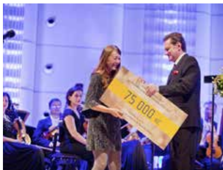
Výtěžek pomůže potřebným.

Přímo na místě se od návštěvníků koncertu podařilo získat 61 tisíc a 795 korun. Částkou 387 tisíc korun pak přispěli donátoři. Finance byly rozděleny mezi Centrum služeb postiženým Zlín (zařízení Horizont), Oblastní charitu Kroměříž (Sociální rehabilitace Zahrada), Oblastní charitu Uh. Hradiště (Labyrint – centrum sociální rehabilitace), Oblastní spolek Českého červeného kříže Zlín a Iskerku Rožnov pod Radhoštěm (centrum na podporu duševního zdraví). Na každou organizaci připadá dar v hodnotě 89 tisíc a 759 korun. [fab]