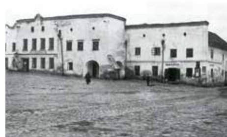
Radnice na začátku 20. století.