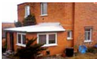
Zlín - Mostní No6221

Půldomek Zlín - Letná, ul. Mostní s přístavbou verandou, nová střecha a plastnová okna, plynové topení, zahrada.