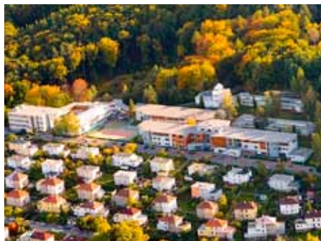
Letecký pohled na gymnázium.

ných: chemické a fyzikální laboratoře, výtvarné učebny a ateliéry, hudebnu, učebny počítačové a výpočetní techniky, studovnu,