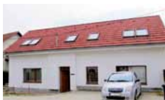
Zlín - Kostelec No5821

Atraktivní rodinný dům v klidné lokalitě, prostorná, celodenně osluněná zahrada. Zastřešená terasa, krb, MHD. Sleva!