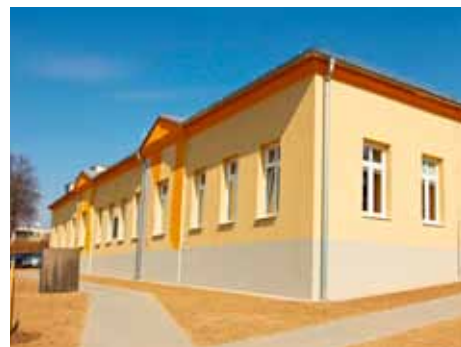
Nová školka na Mladcové.

Vyčítáte mi, že jsem se podle Vás pochválila za dokončení MŠ v místní části Mladcová. Nejde o sebechválu, má vyjádření v tisku, prostá jakýchkoli osobních aspektů, sloužila pouze k objektivnímu informování veřejnosti o tomto projektu. Pokud byste byl stejně kritický i ke svému dopisu, musel byste také hned prohlásit, že se v něm hlavně chválíte. Se stavem, který po Vás zůstal, jsem se samozřejmě seznámila. A udělala jsem i více. Osobně jsem si prohlédla objekty, o které se stará odbor školství magistrátu, a to hned během prvních týdnů ve funkci náměstkyně primátora pro školství. Také jste si během osmi let ve funkci náměstka primátora prošel všechny základní a mateřské školy? Mám informace, že ne. V některých jste se za ty roky na radnici ani jednou neobjevil. Obecně je na místě konstatovat, že Vaše zásluhy, jistě objektivně, zhodnotili voliči v komunálních volbách ve Zlíně a výsledkem jejich hodnocení bylo, že jste nebyl znovu zvolen ani do zastupitelstva.