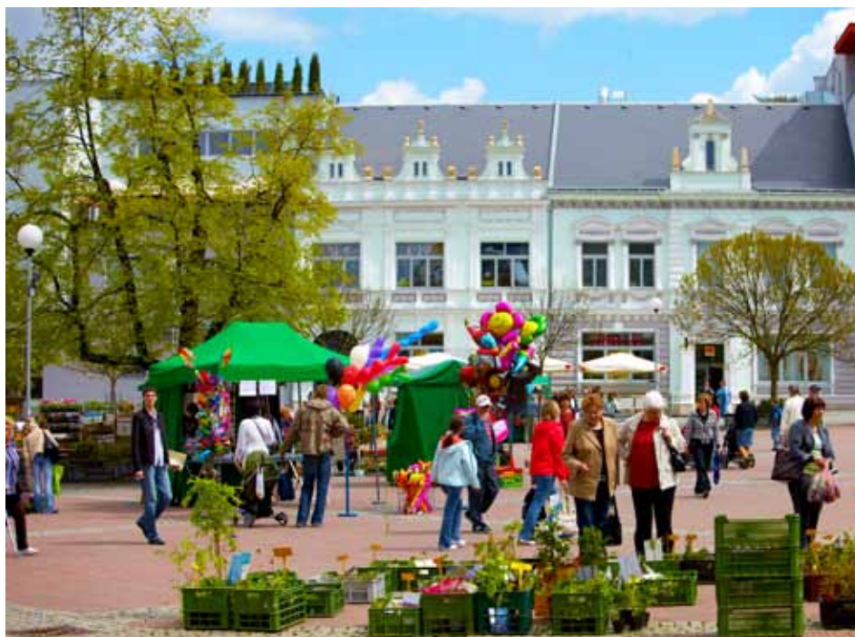
Náměstí Míru zatím ožívá hlavně při tradičních akcích.

Chytni červený kontejner a vyhraž soutěž pro děti i dospělé na téma ekologický sběr elektroodpadu a baterií