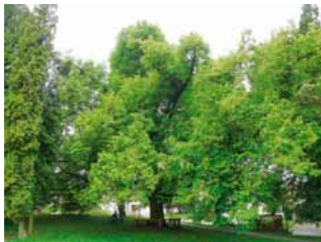
Lípa v Malenovicích.

Nedaleko hřbitova v Malenovicích na křižovatce cest roste u dřevěného kříže lípa ma-