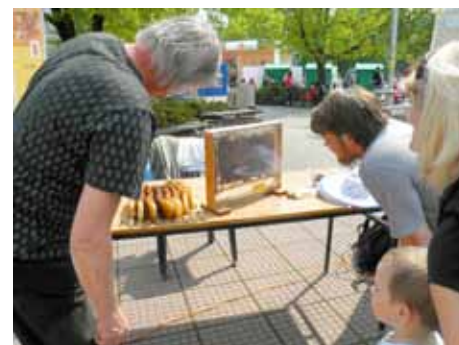
Program oslav je tradičně bohatý.

Ranč v sedle - celodenní program (10 – 16 h) pro děti i rodiče, s koňmi a u koní na ranči v nádherné přírodě Přírodního parku Hostýnské vrchy. Jízda na koni a poníkovi, hry, soutěže, pískoviště, trampolína, opékání (špekáčky s sebou!). Více informací na www.rancvsedle.cz .