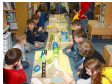
Literární jaro - výtvarná dílna.

První vlašťovkou festivalu Literární jaro Zlín bude ve středu 4. dubna představení výbo-