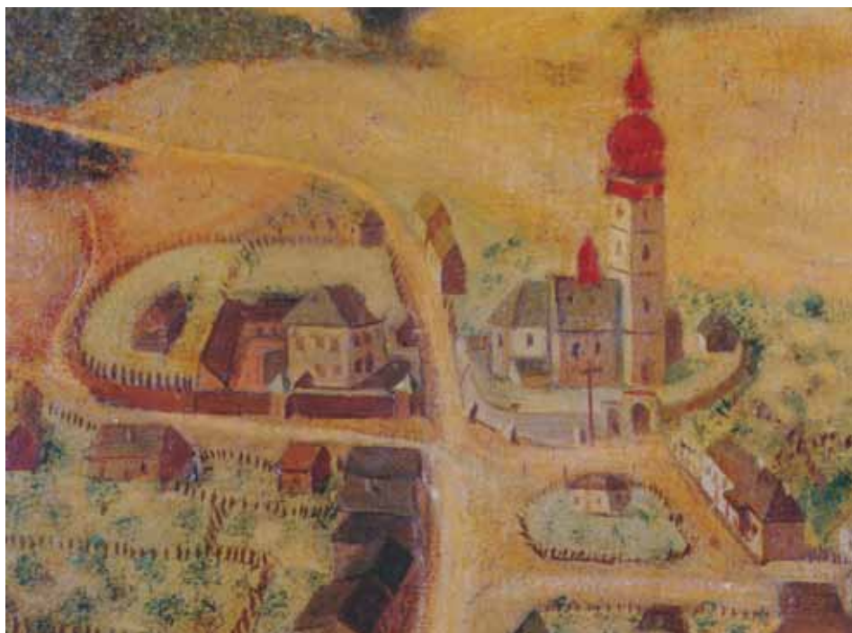
Kostel sv. Filipa a Jakuba na výřezu z veduty města, 1746 (vlevo od kostela areál fary)