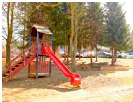
Opravené dětské hřiště. / ilustrační foto: Ivo Hercik

Na území města Zlína je v současné době evidováno 445 dětských hřišť, z nichž 78 je určeno k postupné likvidaci, a to zejména kvůli velmi špatnému technickému stavu nebo proto, že nejsou využívána. Výrazně rekonstruovat je potřeba 168 hřišť, náklady se pohybují ve výši 150 až 170 milionů korun. I přes založení nadačního fondu město počítá s tím, že většinu investic