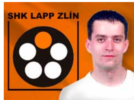
Palát je oporou týmu.

To je spíše nadsázka. Rozhodlo naše velké chcení. Věřili jsme, že máme na to titul získat. [dvo]