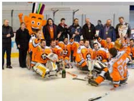
Zlíňané jsou mistry.