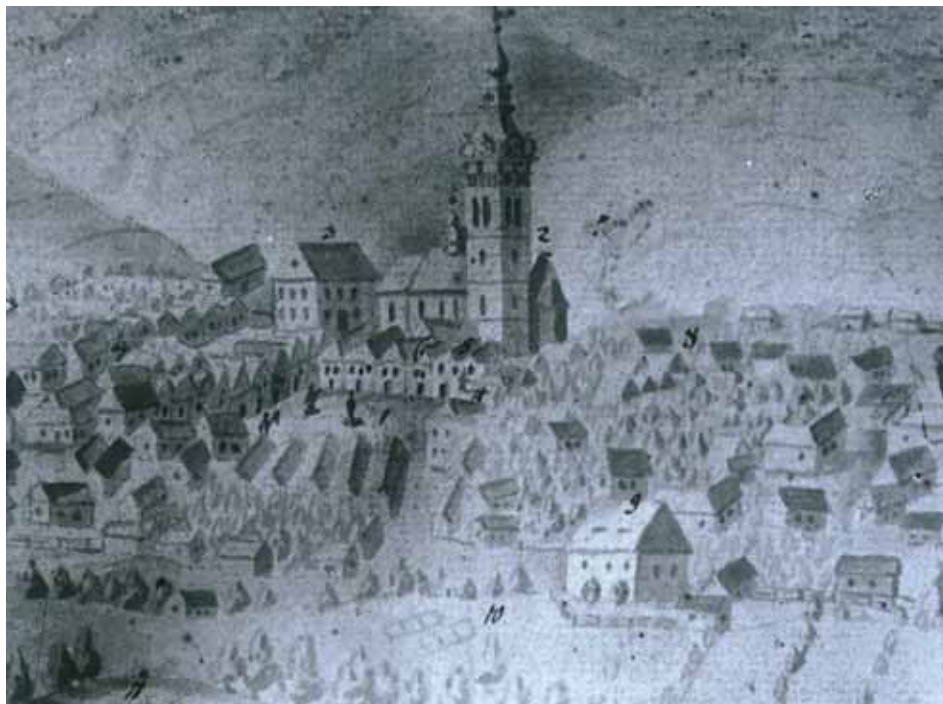
Kostel na výřezu z veduty města, přelom 16. - 17. století (vlevo fara, pod ním náměstí)