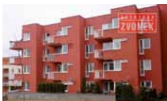
2+kk Zlín - Podlesí No6216

Prostorný novější zděný byt 2+kk s terasou nedaleko lesa, plocha 60 m 2 , velká šatna, rohová kuch. linka, OV.