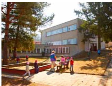
MŠ Slínová.

Sečteno, podtrženo, za osm let mého působení bylo v oblasti školství investováno přes půl miliardy korun, tedy cca 63 milionů ročně. Různými opatřeními jsme ušetřili další desítky milionů provozních prostředků. Jsem přesvědčen, že takto nelze