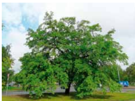
Moruše v Prštém, ul. Karoliny Světlé.