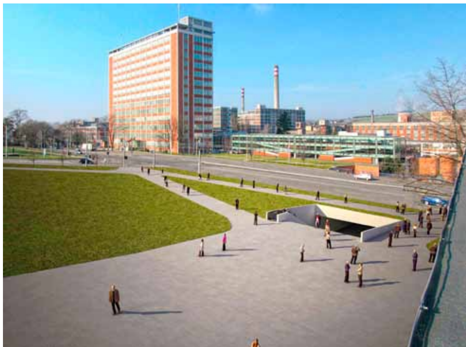
Podchod čeká zásadní změna vzhledu. / vizualizace