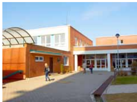
ZŠ Okružní bude mít opravenou kuchyň.

Největší školní kuchyně ve Zlíně, která patří k ZŠ Okružní, se letos dočká zásadní rekonstrukce za cca 18 milionů korun. Dojde k ní během letních prázdnin, kdy bude škola uzavřená. Investorem oprav je město Zlín,