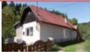
Kašava / okr. ZL N06630

RD se dvěma byty 3+1 a 4+1 na klidném místě, 2 bytové jednotky, 2 garáže, zahrada s bazénem a pergolou. tel.: 603 246 680 5.500.000 Kč