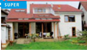
Zlín - Kostelec / okr. ZL N05821

Atraktivní rodinný dům v klidné lokalitě, prostorná, celodenně osluněná zahrada. Zastřešená terasa, krb, MHD. tel.: 603 246 680 3.449.000 Kč