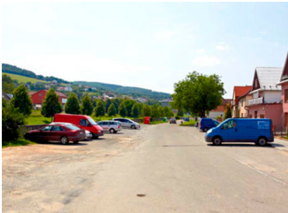
Prostranství před restaurací Přístav čekají změny.

Společnost MORAVSKÁ VODÁRENSKÁ, a.s., připravila pro své zákazníky a spotřebitele novou službu, která umožňuje zobrazení aktuálních havárií a plánovaných odstávek vody prostřednictvím Google map. Na internetových stránkách www.smv.cz najdou zájemci odkaz na zobrazení výluk a havárií pomocí speciálního programu na Google mapách. Zde si mohou vyhledat konkrétní ulici nebo adresu, a také si zvolit způsob zobrazení mapy – satelitní, standardní nebo hybridní. „Na mapě se zobrazují plánované odstávky vody a havárie. U každé provozní události jsou údaje, které zákazníka průběžně informují o přerušení zásobování vodou, o náhradním zásobování a o předpokládaném ukončení výluky,“ uvedla mluvčí Moravské vodárenské Markéta Bártová.