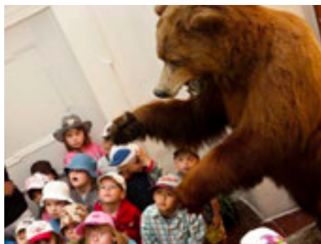
Program bude veselý.

Nebaví vaše děti zdoluhavé výklady v historických sálech rozlehlých hradů? Na hradě Malenovice letos v červenci připravili jednu specialitu, dětské prohlídky. To znamená žádné postávání u obrazů či nábytku. Ale prohlídka, která má spád a dokáže zaujmout i malé děti.