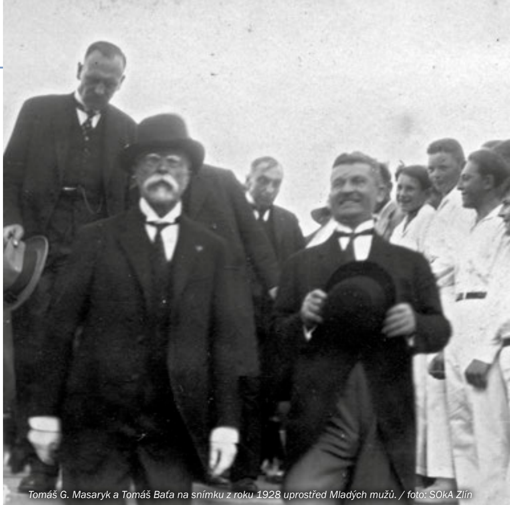
Tomáš G. Masaryk a Tomáš Baťa na snímku z roku 1928 uprostřed Mladých mužů.

Ale i přes takové nedostatky přece jen získávala Baťova kandidátka den ze dne půdy a o volbách oslavila vítězství. Tomáš Baťa se stal starostou svého rodného města. Po oznámení výsledků voleb propukl lid shromážděný na náměstí v jásot. Tomáš Baťa byl na ramenou donesen do vily uprostřed průvodu. Zlín se ocitl tímto počinem na začátku nového úseku svých dějin. Začalo budování nového Zlína.“