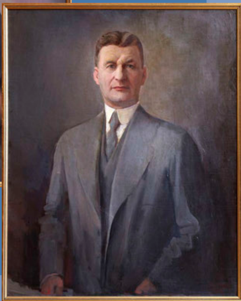
Tomáš Baťa (1876-1932)