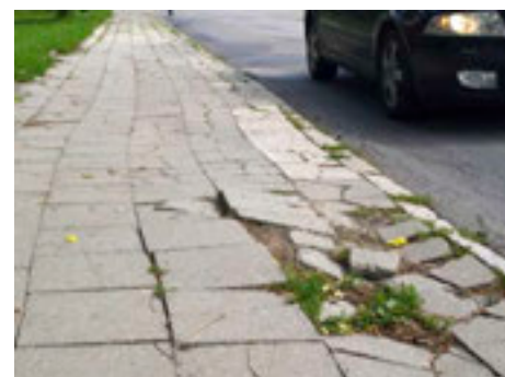
Opravy chodníků jsou prioritou. / ilustrační foto

drobný porost. Obyvatelé Malenovic se těší, že se opraví další chodníky na sídlišti. Kromě jiného se v Malenovicích připravuje projektová dokumentace dostavby sportovně-rekreačního centra. V Loukách do svých investičních akcí zařadili drobné opravy chodníků a kanalizace, nejvýznamnější akcí ale bude rekonstrukce komunikace v ulici K Cihelně a rekonstrukce mostu včetně zastávky MHD U Hřiště. A v Prštném zase oprava lávky přes Dřevnici v ulici Jateční nebo předláždění části chodníku ulice Náves. Na Salaši kromě rekonstrukce objektu bývalé MŠ proběhne rozsáhlá úprava zeleně. [dvo, sve]