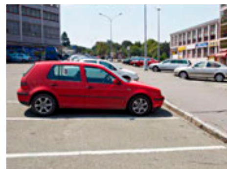
Parkovací místa ve Zlíně chybí.

Až 122 nových parkovacích míst může do konce tohoto roku vzniknout na Jižních Svazích, největším zlínském sídlišti. Radnice v současné době dokončuje projekty, podle kterých se bude stavět, samotné práce by mohly začít koncem léta. Náklady nepřesáhnou částku 11 milionů korun. „Jižní Svahy mají dlouhodobě značný nedostatek parkovacích míst, což dennodenně způsobuje jejich obyvatelům velké potíže. Navýšit jejich počet je proto velmi důležité,“ uvedl Jiří Kadeřábek .