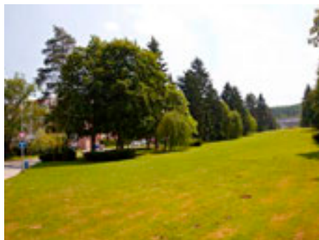
Gahurův prospekt .

Ve znamení velkých investic se ponese druhá polovina roku 2012 ve Zlíně. Radnice zahájí například za pomoci evropských peněz rekonstrukci první části Gahurova prospektu, ve velkém se budou opravovat chodníky a dětská hřiště, chystá se nasvětlení přechodů pro chodce, vzniknou nová parkovací stání, zásadní stavební úpravy v mateřské škole na ulici Slínová přinesou desítky nových míst ve dvou dalších třídách, budou se rekonstruovat některé ulice, řada investic zamíří do místních částí.