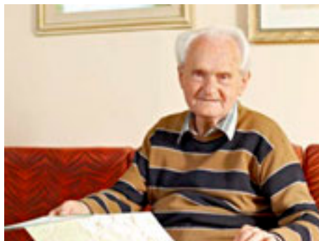
Ludvík Čvanda.

Na Zlínsku existuje již desítky let stabilní síť turistických tras. Pokud by měla vznik-