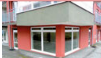
Zlín - Na Honech I / okr. ZL N05888

Starší domek 4+1 s přístavbou z r. 2004 na okraji obce směrem na Lukov. Topení kamny (dřevo) a el.přímotopy. tel.: 603 246 680 1.150.000 Kč