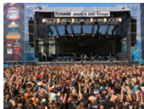
Festival opět nabídne hvězdné kapely.

S dosud největší pódiovou show přijede také klenot holandského symfonic-metalu WITHIN TEMPTATION, světovou premiéru písně, složené speciálně pro české fanoušky, si přichystali u nás nesmírně populární Švédové SABATON, kteří přijedou představit také svou zbrusu novou sestavu, složenou ze zkušených muzikantů. Poprvé na festivalu v České republice zahrají legendární Irové THIN LIZZY. Ohromnou událostí bude také vystoupení německé kapely UNISONIC,