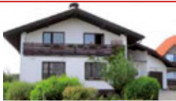
Zlín - U Majáku / okr. ZL N06687

Atraktivní rodinný dům v klidné lokalitě, prostorná, celodenně osluněná zahrada. Zastřešená terasa, krb, MHD. tel.: 603 246 680 3.449.000 Kč