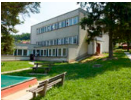
Kapacita školky se rozšíří.