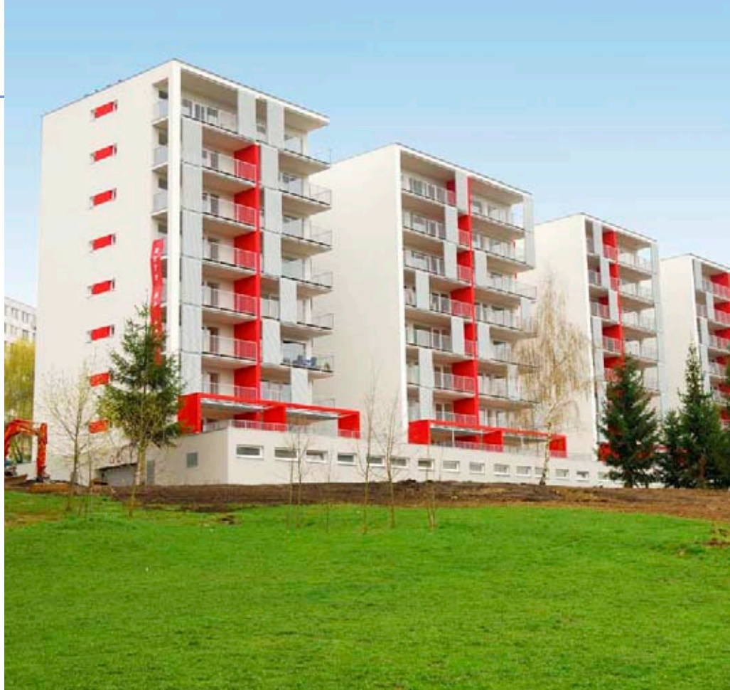
Bytový dům Zlín - Křiby