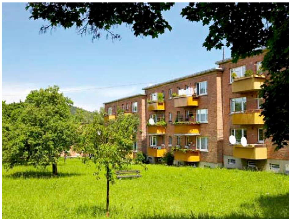
Mezi obytnými domy na Obecínách je dostatek zeleně