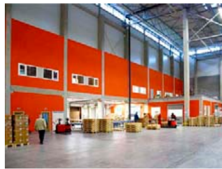
Skladová hala TESCOMA WORLD

Statutární město Zlín za rok 2009 nemělo přihlášenou žádnou stavbu, byly přihlášeny pouze soukromé projekty na území našeho města. Zlín se stal vítězem v kategorii domů pro bydlení a v kategorii rodinných domů. V prvním případě byla udělena hlavní cena