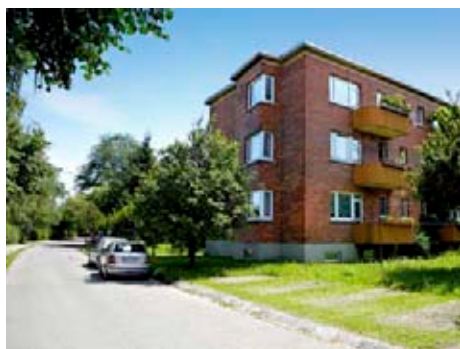
O bydlení na Obecínách je zájem