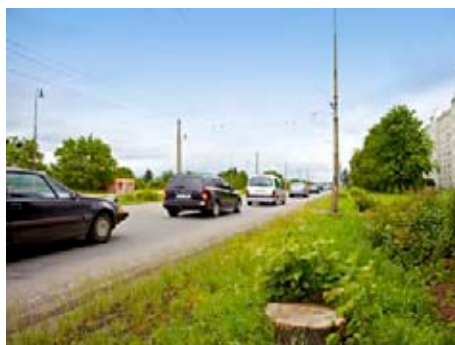
Motoristé čekají na rozšíření silnice I/49

Kritika vzhledu centra Malenovic je také již letitá. Názorů na různé způsoby řešení bylo mnoho, ochoty ustoupit od vlastní představy o to méně. Každá strana vnímala důležitost a podstatu řešení v něčem jiném. Shoda je ale v tom, že realizace přestavby centra jako jedné akce není ani možná, ani vhodná. Prvním krokem je potřeba vybudovat náhradní parkovací místa. Bylo dohodnuto, že MMZ připraví projekt a stavební