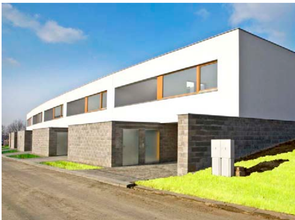
Rezidence Zlín-Přiluky