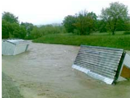
Plouvoucí buňky na Dřevnici

Co se vlastně odehrávalo v terénu na území našeho města během nočních a brzkých ranních hodin dne 2. června? Tak např. dobrovolní hasiči v počtu 80 prováděli čerpání vody z hradítkových komor v Lužkovicích, Bartošově čtvrti, ze sklepů v Přílukách, z kolektorů a prádelny a teplovodního kanálu v Krajské nemocnici T. Bati, ze sklepa mateřské školy a na fotbalovém hřišti v Loukách, v podjezdu v Dlouhé ulici, z rodinných domů v Prštném, čistili propusti na Zálešné, potok Baláž, kanalizaci na Vysoké. Státní policie řešila velmi komplikovanou situaci spojenou s uzávěrami komunikací, mostů