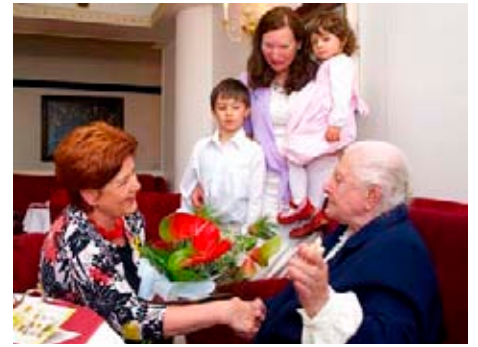
Jubilantka přijímá gratulace