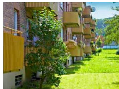
Zdejší byty patří k těm lepším ve městě

Jaroslav Novotný Obeciny 3613 (suterén domu), Zlín pondělí 10 – 12 hod., středa 15 – 17 hod. tel.: 577 012 367, e-mail: kancelar_obeciny@muzlin.cz