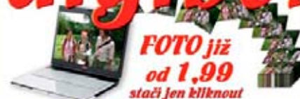
FOTO již od 1,99 stačí jen kliknout

ON-LINE-SBĚRNA-FOTO-Z-DOMU-SBORO-NA-POČKÁNÍ