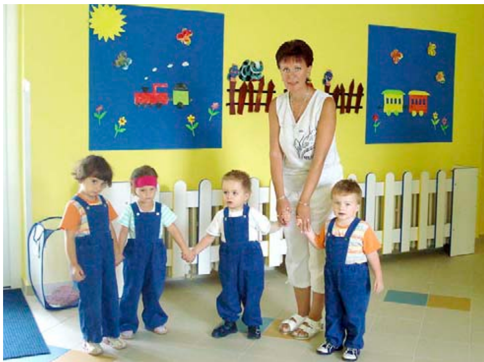
Děti z jeslí v Budovatelské ulici

nebo osobně do podatelny Magistrátu města Zlína, budova radnice, náměstí Míru 12, Zlín, (obálka musí být označena „Ředitel/Ředitelka základní školy“), nejpozději do 2. 7. 2010 do 12.00 hod. Poznámka: zalepenou obálku označit „NEOTEVÍRAT!“