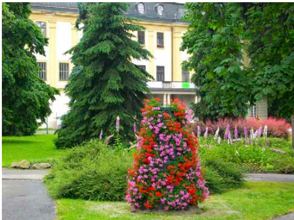
Květy před zlínským zámkem

Společnost Technické služby Zlín upozorňuje, že odvoz komunálního odpadu v průběhu státních svátků ve dnech 5. a 6. července 2010 bude probíhat běžným způsobem bez časového posunu. To znamená, že pravidelný pondělní svoz bude proveden i v době státního svátku dne 5. července a stejný režim platí i pro úterý 6. července.