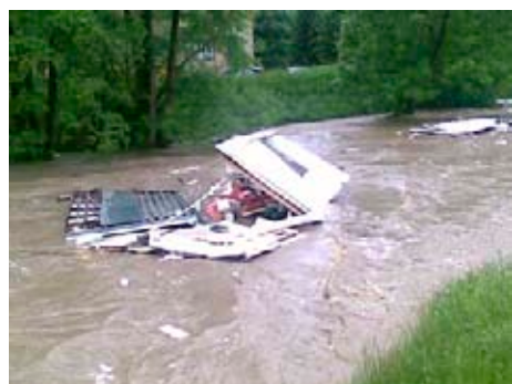
Buňky se naštěstí ve vodě rozpadly

Povodňová komise se změnila v souvislosti se stále se zhoršující situací v krizový štáb.