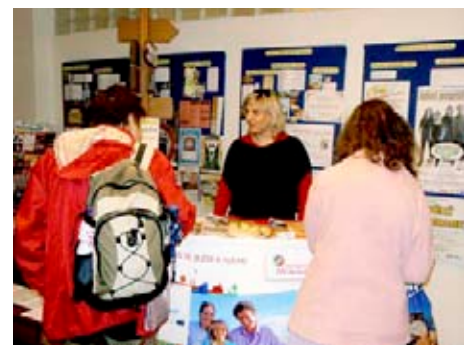
Prezentace na IC Tour

Zástupci Zlína během května a června v rámci IC Tour 2010 navštívili Karvinou, Hranice, Přerov, Litomyšl, Žďár nad Sázavou, Blansko, Rychnov nad Kněžnou, Jičín a Mladou Boleslav. [tz]