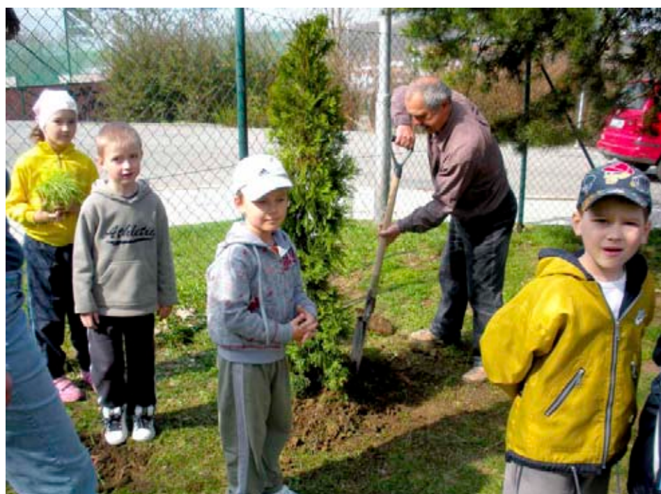
Děti se učí základům ekologie

Žádosti o dotaci si můžete vyzvednout na Odboru životního prostředí a zemědělství nebo na Odboru městské zeleně MMZ ve Zlíně v ulici Zarámí č. p. 4421, v elektronické podobě na www.zlin.eu . Po jednoduchém vyplnění lze žádost podat v průběhu celého roku. Statut a pravidla čerpání Ekofondy jsou každým rokem aktualizovány. [OŽPaZ]