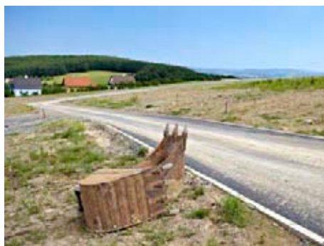
Na Kudlově vznikají nové ulice