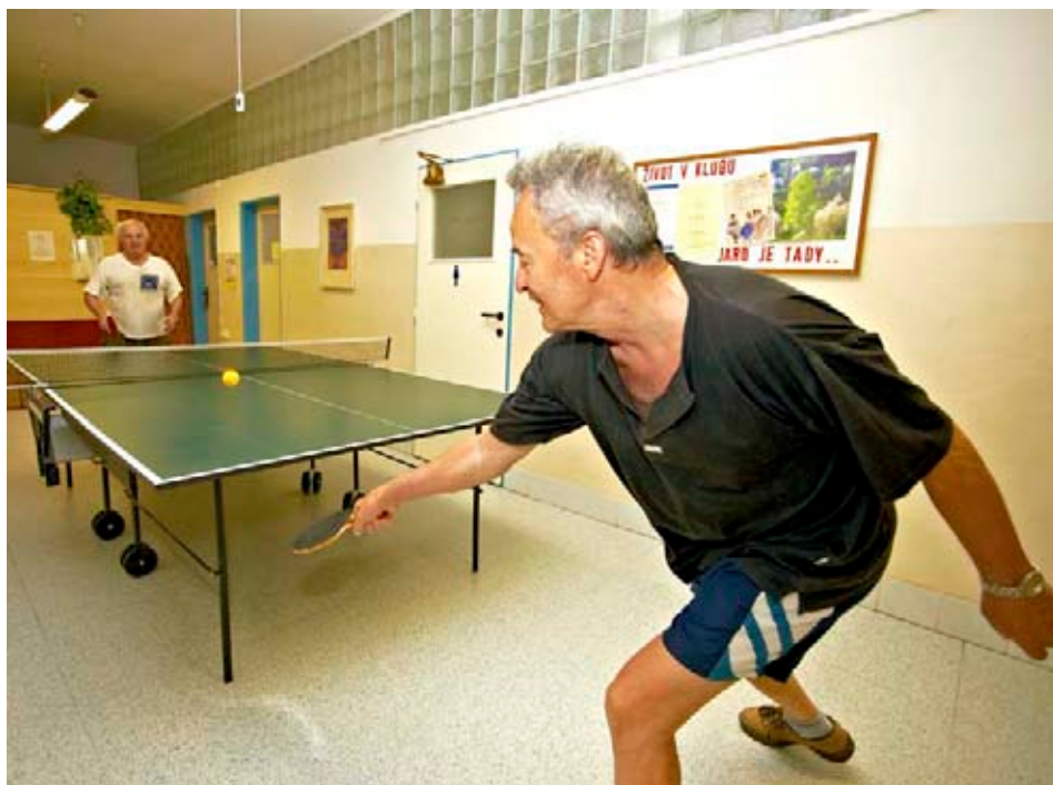
Seniři z Malenovic