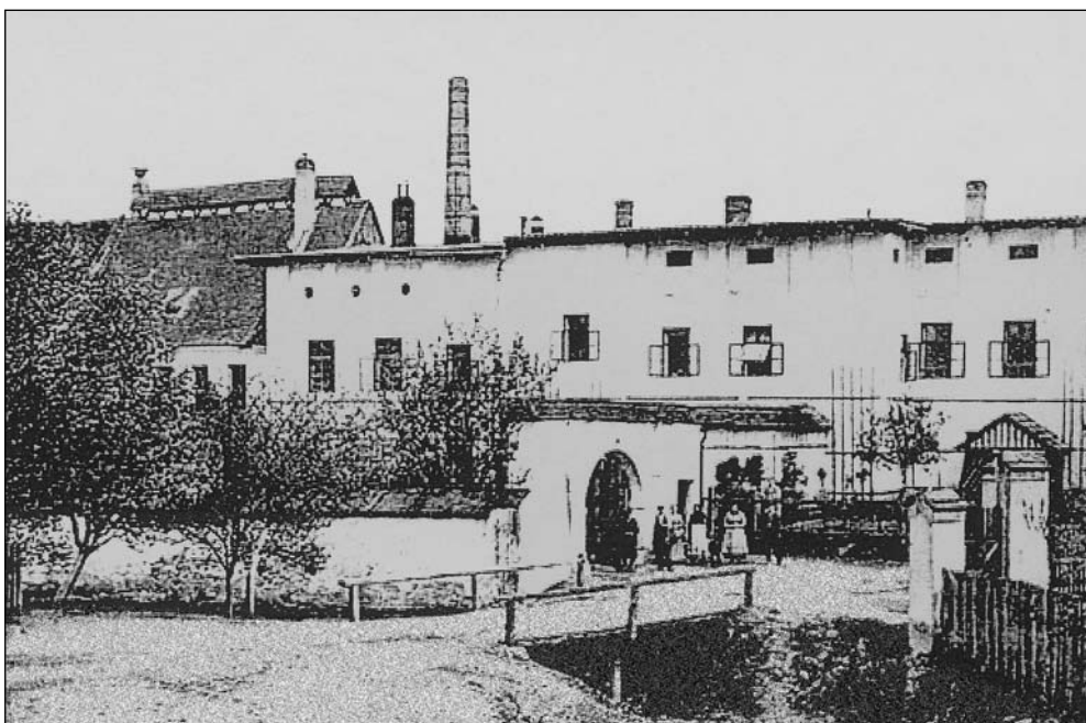
Budova bývalého pivovaru.