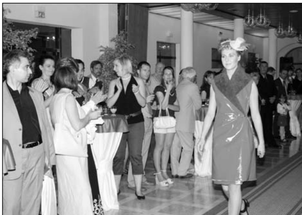
Přítomné zaujala i netradiční módní přehlídka studentských modelů.