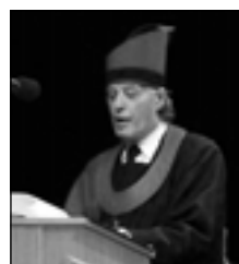
Slavnostní ceremoniál, udělení titulu Doctor honoris causa.

Dne 3. 7. 2007 se dožívá sedmdesátiletý jeden z nejznámějších zlínských rodáků a jeden z nejvýznamnějších současných světových dramatiků, držitel zlatého Oscara, sir Tom Stoppard.