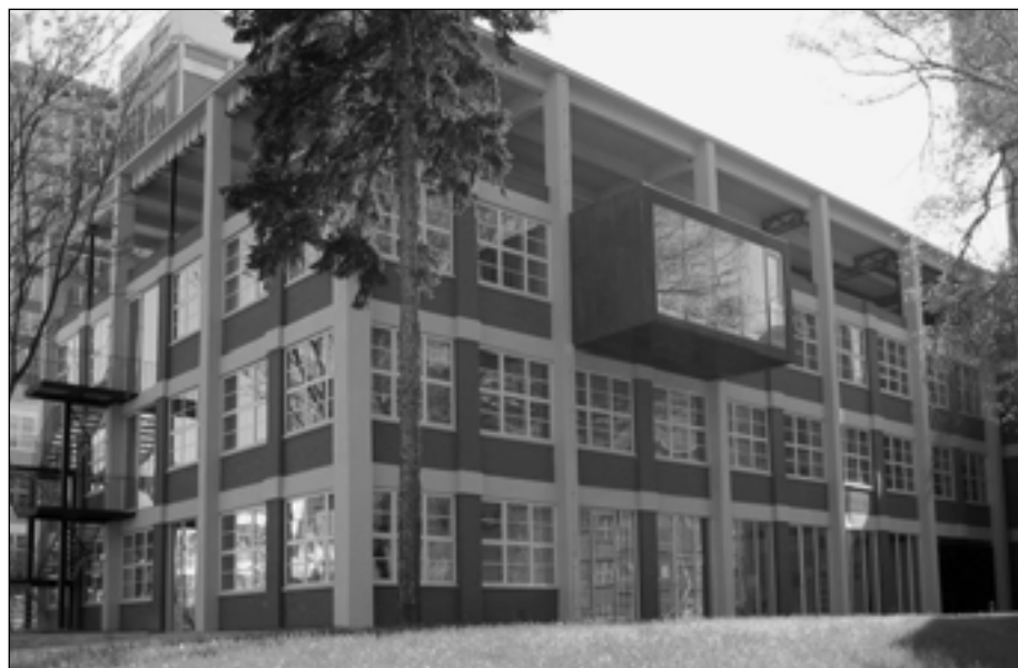
Podnikatelské a inovační centrum Zlín - 23. budova.