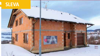
Zlín - Mladcová /okr. ZL N07614

Novostavba RD s pěkným pozemkem 946 m 2 . Výborná dostupnost do centra, dům je kompletně dokončený kromě fasády.