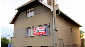
Tlumačov /okr. ZL N06438

Udržovaný RD 5+1 v klidné části obce s výbornou dostupností, topení plyn/tuhá paliva, zahrada 550 m 2 .