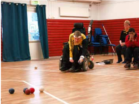
Boccia je dalším sportem pro handicapované.