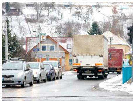
Křižovatka má malou kapacitu.