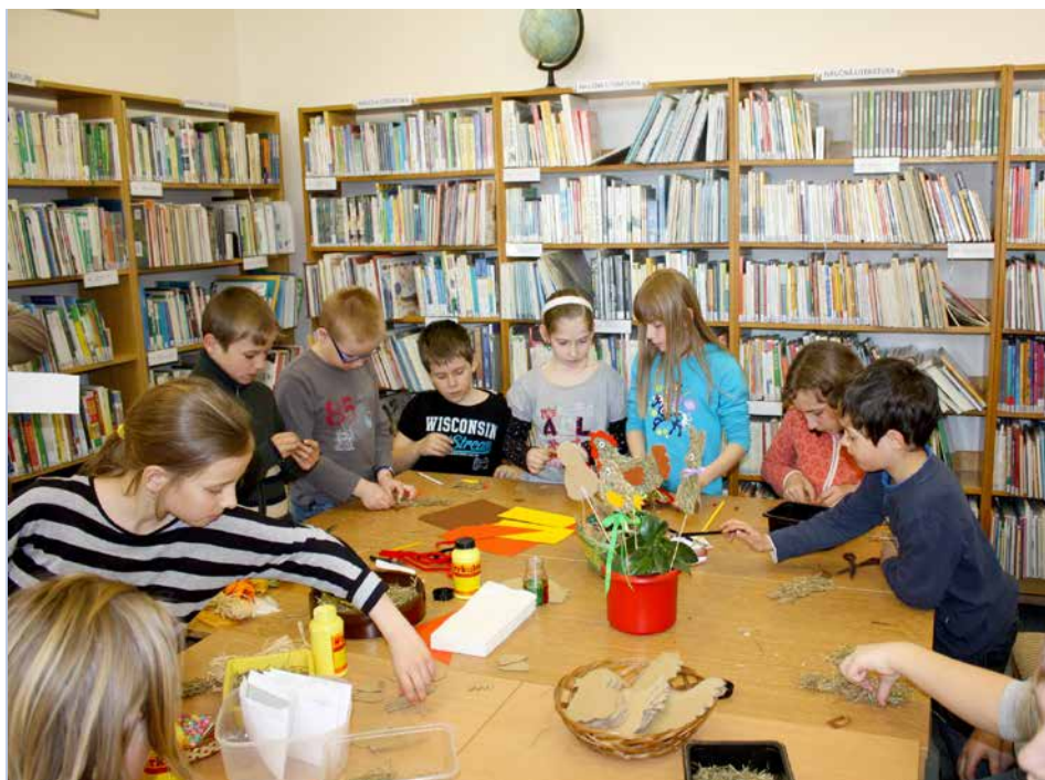
Jarní tvoření v knihovně.