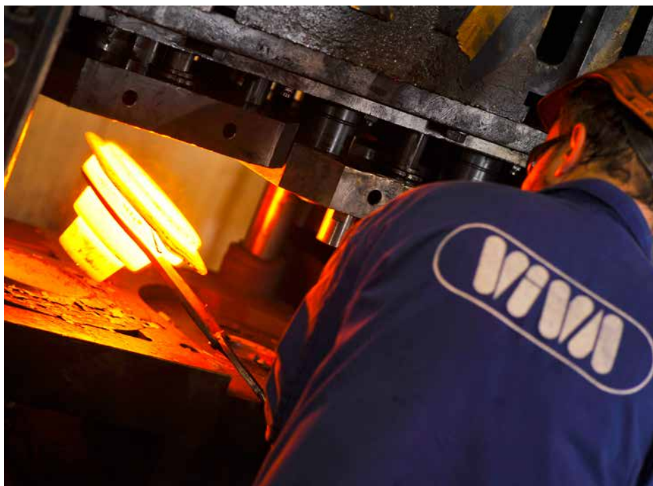
Kovárna VIVA.

Slévárna SPO ZLÍN se specializuje na výrobu ocelových odlitků metodou vytavitelného voskového modelu litím do žhavých keramických forem. Významného využití naleznou v mnoha průmyslových výrobcích - například v průmyslu energetickém, potravinářském, strojním, automobilovém či zbrojním. Kapacita výroby je 200 tun odlitků ročně. Do zahraničí je vyváženo až 75 % veškerých výrobků. Žádané jsou v Itálii, Německu, Švédsku, Francii, Švýcarsku, Izraeli a mnoha dalších zemích. www.spo-zlin.cz