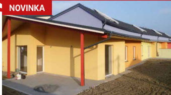
Rodinné domy 3+kk a 4+kk Lípa u Zlína

Nové řadové rodinné domky v bezbariérovém provedení, předzahrádka, zahrada, terasa a garážové stání.