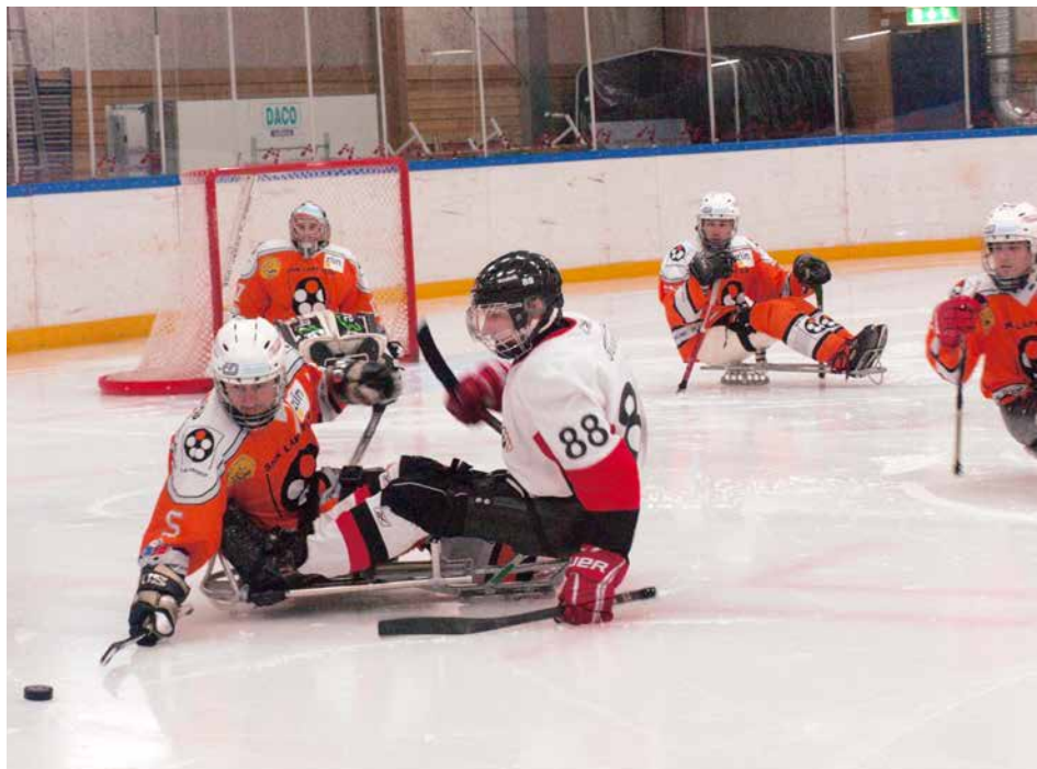
Turnaj ve sledge hokeji je stabilní součástí Malmö Open.

Odpovědi na tyto otázky bude hledat projekt s názvem Občané pro Evropu, který připravuje švédská organizace FIFH z Malmö. Jde o instituci, která je jednou z největších svého druhu ve Skandinávii. Kromě Švédska chce projekt realizovat i v Srbsku, Bosně a Hercegovině a České republice. Tam přizvala k účasti Zlínské aplikované sporty (ZAS), tedy společnost, která se dlouhodobě zabývá prací s tělesně postiženými. Na projektu bude participovat i město Zlín, hlavní partner ZAS.