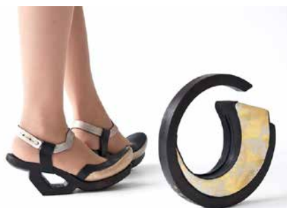
Studentský design je kreativní.

Studenti z celého světa soutěží se svými návrhy v několika kategoriích. Více informací na www.talentedesignu.cz . [io]