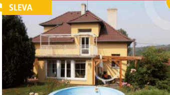
Zlín - Příluky /okr. ZL N07103

Zrekonstruovaný dům 5+1 v klidné lokalitě, krásná zahrada, vnitřní krb, veranda, bazén, pozemek 825 m 2 , garáž, MHD.