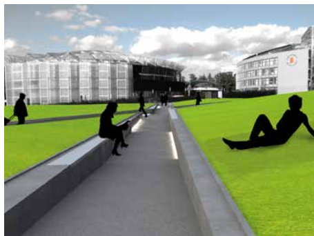
Vizualizace Gahurova prospektu.

Analytická část Strategie identifikovala, že Zlín má dobře rozvinuté podnikatel-