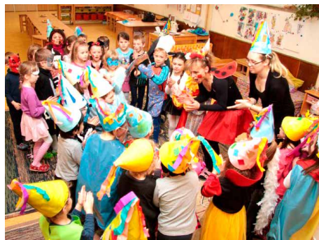
Školka v Kolektivním domě.

Pro mateřské školy neplatí školské obvody, zákonný zástupce může podat žádost