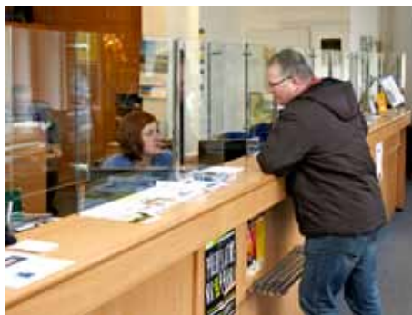
Informační centrum na radnici

Zveřejňování průběhů a výsledků většího množství veřejných zakázek než v minulých letech, přímé televizní přenosy a poté záznamy z jednání zastupitelstev, Magazín Zlín otevřený občanům i opozici. To jsou novinky, které uvedlo současné vedení města do praxe ve snaze zajistit co nejlépe informování veřejnosti o dění na magistrátu, práci jeho úředníků a politické reprezentace.