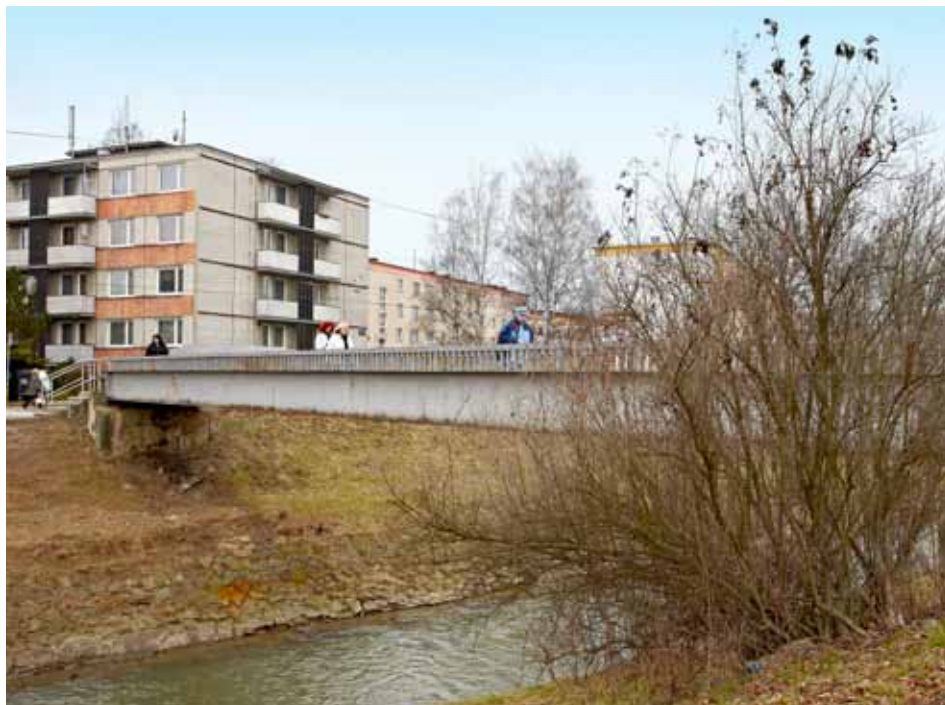
Město vlastní kolem stovky mostních objektů

Další akcí bude tichá vzpomínka a položení květin k uctění památky Jana Antonína Batí u příležitosti 113. výročí jeho narození v pondělí 7. března 2011 v 11.00 u sochy J. A. Batí, která se nachází u univerzitního parku naproti 21. budovy.