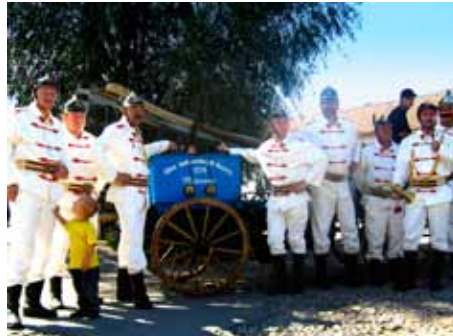
Veteráni SDH Malenovice

„Loni se podařilo z prostředků Magistrátu města Zlína a Komise místní části Malenovice pořídit nové zásahové vozidlo Ford Tranzit, které nahradilo již dosluhující Avii.“