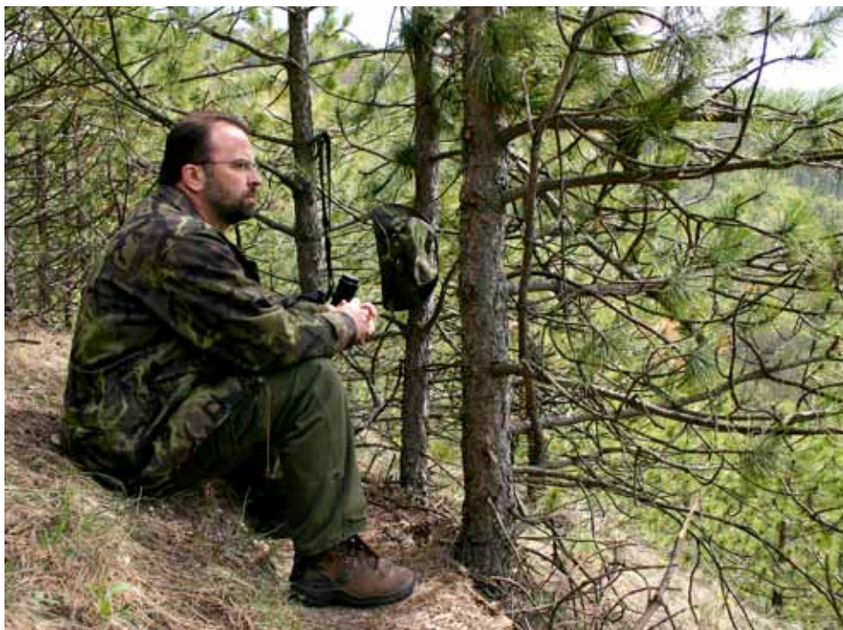
Bedřich Landsfeld má netradičního koníčka - ornitologii