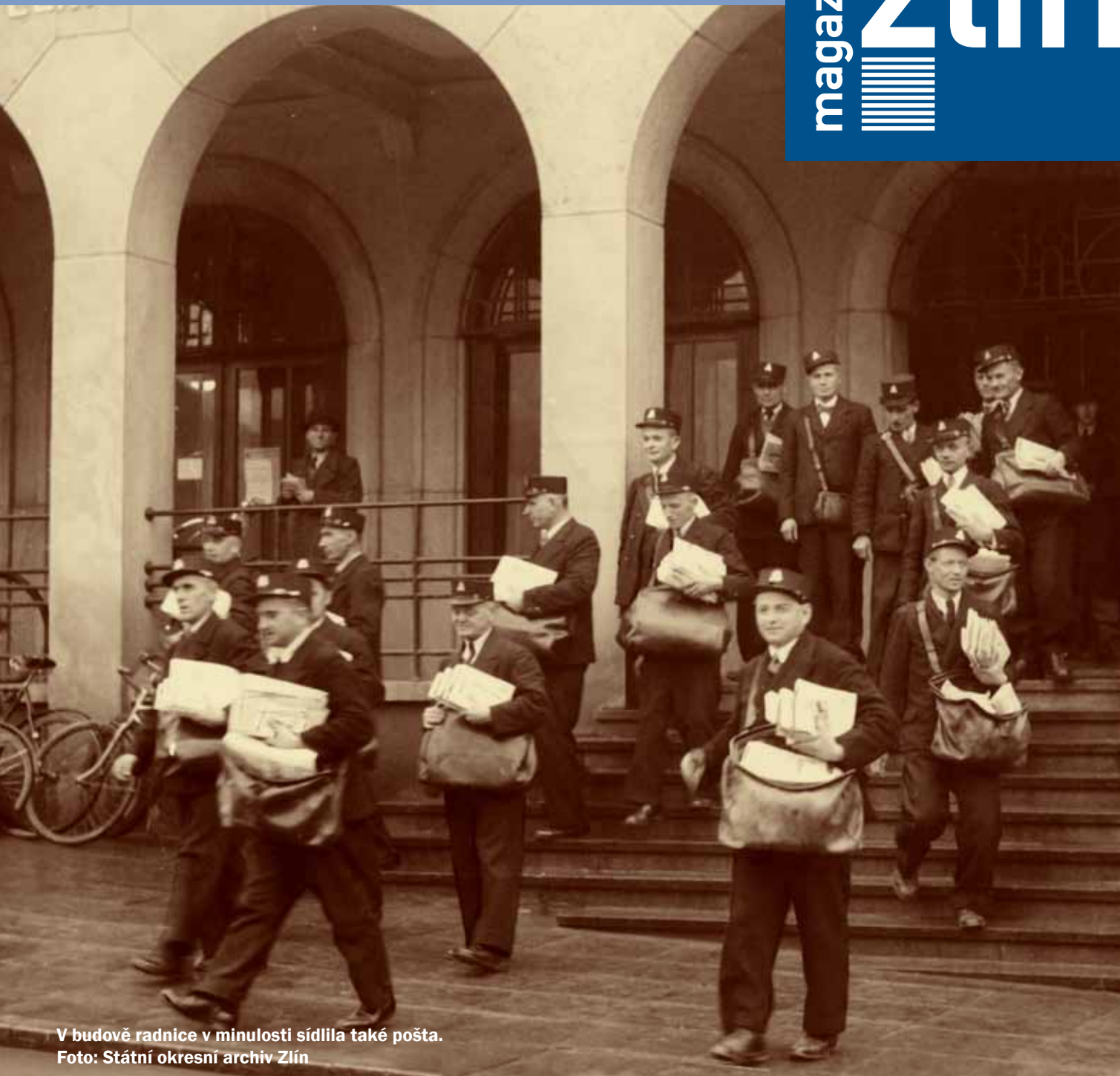
V budově radnice v minulosti sídlila také pošta.