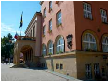
Radnice v projektu Zavřeno neuspěla

Právě poslední zmíněná instituce hodnotila, jak v minulém volebním období jednotlivé magistráty poskytují informace svým obča-