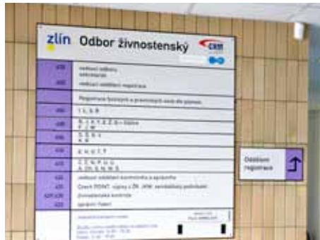
Loni úřad vydal 1 682 oprávnění

oprávnění. Největší zájem byl o živnost volnou, kde se nedokládá odborná způsobilost, další v pořadí pak byla živnost řemeslná „hostinská činnost“, o kterou požádalo 110 osob. U mužů na dalších místech převažovala řemeslná živnost „Výroba, instalace, opravy elektrických strojů a přístrojů, elektronických a telekomunikačních zařízení“ (63), „Zámečnictví, nástrojařství“ (33) a „Montáž, opravy, revize a zkoušky elektrických zařízení“ (32). U žen byla nejžádanější řemeslná živnost „Manikúra, pedikúra“ (82) a „Holičství, kadeřnictví“ (17). V loňském roce vzrostl zájem o živnost vázanou, která dříve nebyla moc využívána, a to „Poskytování služeb v oblasti bezpečnosti a ochrany zdraví při práci“. Živnostenský úřad vydal těchto živností sedm.