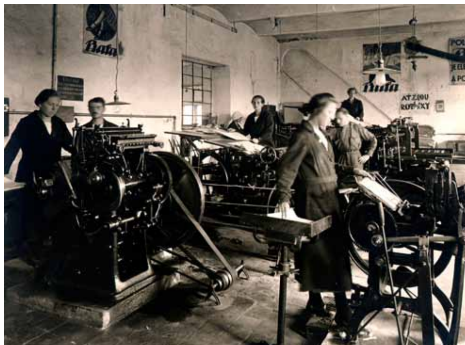
Stará firemní tiskárna asi roku 1924

Baťovské tiskové impérium dosáhlo ve třicátých letech udivující šíře. Moderní rotačky denně chrlily tisíce výtisků novin a časopisů distribuovaných do celého světa – roku 1938 činila měsíční produkce 600 000 kusů a firma zaměstnávala 21 stálých redaktorů. Zlínský tisk organizovaný pod hlavičkou Baťa představuje naprosto ojedinělou kapitolu české žurnalistiky a rozhodně si zaslouží hlubší pozornost.