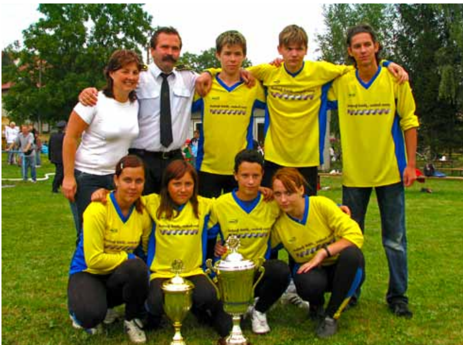
Úspěšné soutěžní družstvo starších žáků