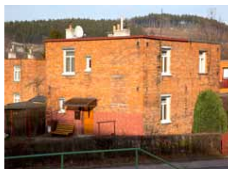
Obyvatele půldomků čekají změny

Stavební úřad magistrátu připravuje rozsáhlé přečíslování duplicitních (nejedinečných) čísel popisných u takzvaných baťovských půldomků. Změny musí být hotové nejpozději k 1. červenci letošního roku. Přečíslování se týká více než 1 500 budov. Změny čísel popisných baťovských půldomků město nepřipravuje kvůli vlastní potřebě, ukládá mu to zákon č. 227/2009 Sb. Ten v jednom ze svých článků stanovuje, že pokud se čísla popisná v téže části obce shodují, obec rozhodne o změně, a to do jednoho roku od nabytí účinnosti tohoto zákona. „V minulosti docházelo k rozdělování baťovských půldomků a prodeji jejich jednotlivých částí jakožto samostatných věcí. Jsou tak běžné případy, kdy má baťovský půldomek s jedním číslem popisným různé vlastníky, přičemž každý z nich má vlastnické právo k části stavby. Jinak řečeno: v jednom takovém objektu žije několik vlastníků a všichni používají adresy se stejným číslem popisným. A právě tohle zmíněný zákon nařizuje změnit,“ upozornil tiskový mluvčí magistrátu Zdeněk Dvořák . Magistrát vypracoval manuál s pokyny, které mají usnadnit požadované změny: