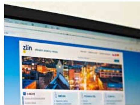
Mnoho informací je na stránkách města

Podle tajemnice magistrátu Heleny Eidové je případ pana Ocelky typickým příkladem nedorozumění, ke kterému při komunikaci veřejnosti s úřadem občas dochází. Požadavek na zaplacení nákladů označila za zcela legitimní. „ V případech rozsáhlejšího vyhledávání informací je město Zlín oprávněno za tuto činnost požadovat úhrady stanovené příslušným sazebníkem, s tím se žadatelé musí smířit. Proto je vhodné, aby se před podáním žádosti předběžně informovali, kolik bude vyhledání jimi požadovaných údajů stát, “ poradila. I přes maximální otevřenost, se kterou chce město přistupovat k žádostem z řad veřejnosti, existují údaje, které tazatelům poskytovat nemůže. Zákon o svobodném přístupu k informacím například stanoví, že město není oprávněné poskytovat in-