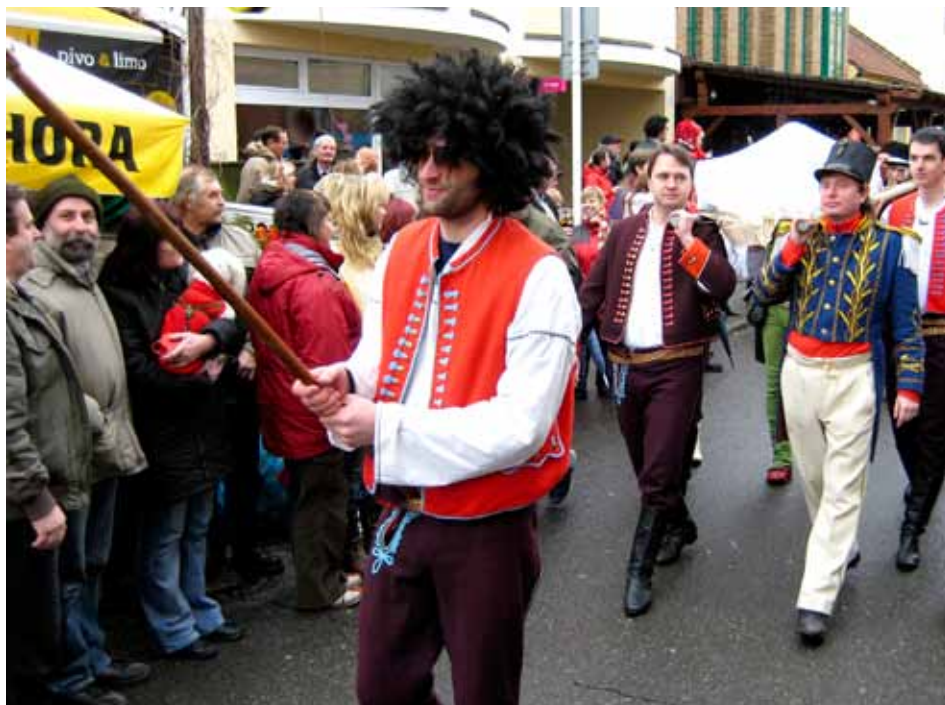
Lešetínský Fašank je stále oblíbenější akcí