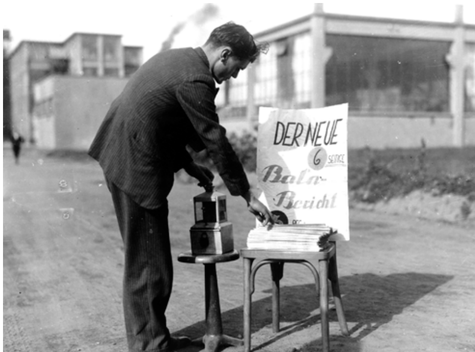
Samoobslužný prodej závodního týdeníku Baťa-Bericht

Píše se rok 1918, válka ještě stále vyčerpává celou Evropu a Zlín je možno nazvat velkou noclehárnou, protože ve městě se tísni nejprve stovky, později tisíce dělníků přicházejících z širokého okolí do místních obuvnických fabrik. Tomáš Baťa totiž na začátku války získal značný podíl na dodávkách obuvi pro armádu a počet zaměstnanců v jeho firmě postupně narostl z předválečných čtyř set na čtyři tisíce. Továrník proto zcela zákonitě musel hledat nové efektivní způsoby komunikace mezi vedením fabriky a zaměstnanci. To se jasně ukázalo například v březnu roku 1918, kdy se Baťa potýkal s menšími stávkami.