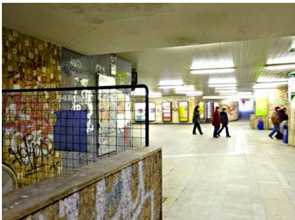
Podchod nyní nepatří k lákavým zákoutím krajského města

Podchod na náměstí Práce bude rekonstruován. Město již zahájilo přípravu projektu a podání žádosti o poskytnutí dotace z fondů Evropské unie. V současné době je podchod ve značně zdevastovaném stavu a řada obyvatel i návštěvníků jej označuje za ostudu Zlína.