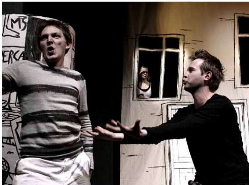
Inscenace Tři v tom patří k nejúspěšnějším komediím divadla Malá scéna

Více informací o divadle a program najdete na www.malascenzlín.cz . [ps]