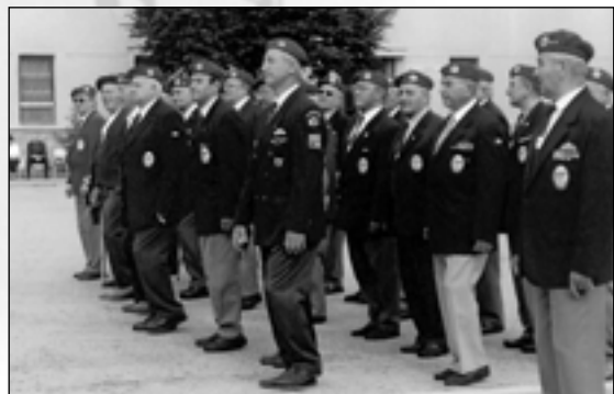
Setkání „paraveteránů“ při oslavě 60. výročí založení výsadkového vojska v KVV Žilina.

"Je důležité i dnes připomínat hrdinství a oběti našich občanů..."