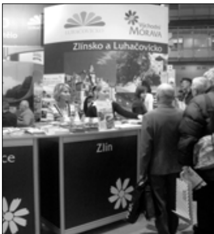
Pracovnice oddělení cestovního ruchu zlínského magistrátu na veletrhu v Brně.