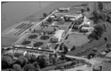
Čistírna odpadních vod v Malenovicích.