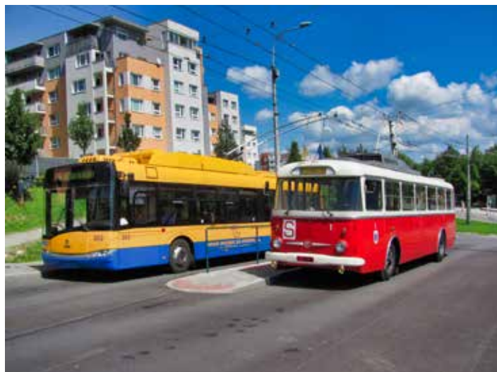
Trolejbusy jsou neodmyslitelnou součástí města.

Zlín a Otrokovice počítají s trolejbusovou dopravou i do budoucna. „Už letos na jaře chceme spustit zajímavý projekt prodloužení jedné z trolejbusových linek až po zoologickou zahradu v Kostelci, a to s využitím bate-