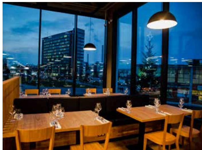
Bistrotéka propojuje několik gastro provozů na jednom místě.