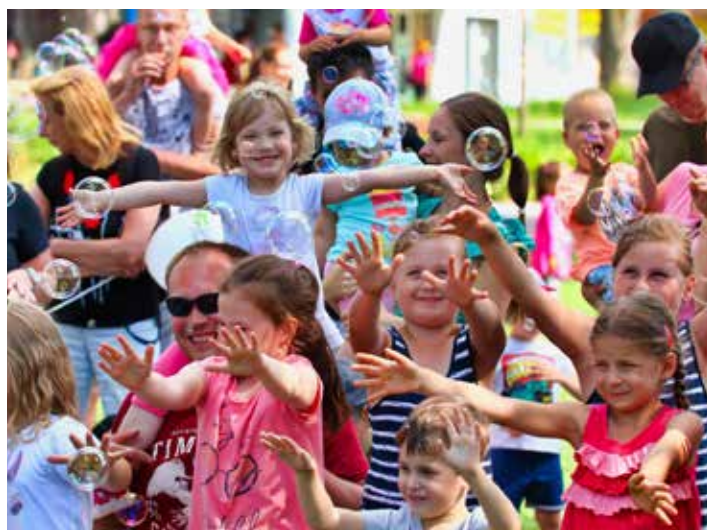
Akce jsou určeny pro malé i velké návštěvníky.

části nebo na náměstí,“ doplnila koordinátorka. „Čím více je Zlín živý, tím lépe. Radnice nemá chystat jen stavby a opravy, ale poskytovat lidem i zábavu a zajímavé akce. A to se snažíme dělat. Když bude Zlín příjemným místem pro život, nebudou z něj lidé odcházet, ale naopak se do něj stěhovat či případně vrátet,“ prohlásil náměstek primátora Miroslav Adámek , do jehož kompetencí patří kultura. Živý Zlín loni trhal návštěvnícké rekordy. Akci Pohádkování si nechal ve zlínském parku Komenského ujít kolem čtyř a půl tisíce lidí. Čtyřtisícovou návštěvnost zaznamenalo i Sousedské besedování, Dýňobraní, Velikonoce v parku či Busker Fest. Mimořádný zájem byl o události Po Letné s paní Baťovou, Žijeme středověkem, Lampionový prů-