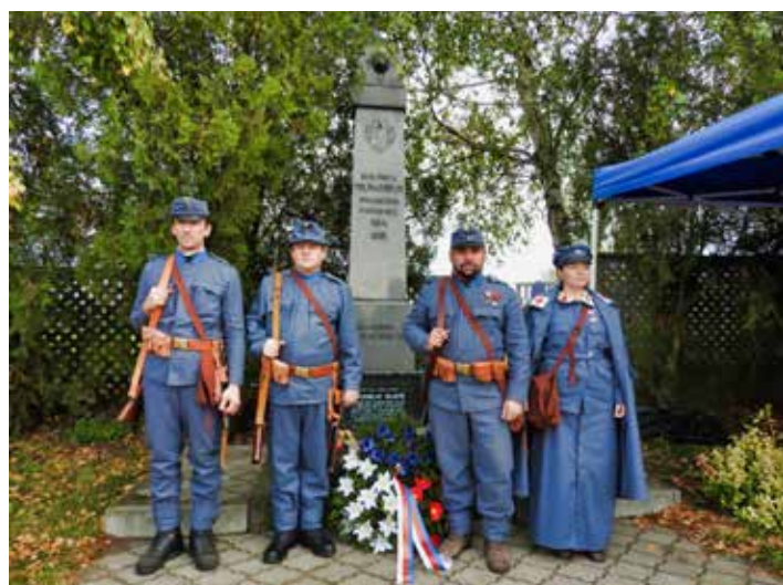
Spolek se zabývá historií Rakouska - Uherska.

plňky a košile pro svoje vojáky. Členové spolku se účastnili mnoha akčních i statických ukázek, a to například rekonstrukce bitvy první světové války v Mladějově, Slavností Albrechta Valdštejna v Telči, rekonstrukce bitvy na Bílé hoře v Praze za mezinárodní účasti skupin ze Slovenska, Polska a dalších zemí Evropy, na Dni vojenské historie na hradě Helfštýně nebo na Dni uniformovaných sborů v Kroměříži. Za obzvlášť velkou čest si pak považujeme účast na filmovém natáčení historického snímku Rašín. Z těch méně dynamických ukázek je to například pietní akt výročí konce první světové války a vzniku republiky ve Lhotě