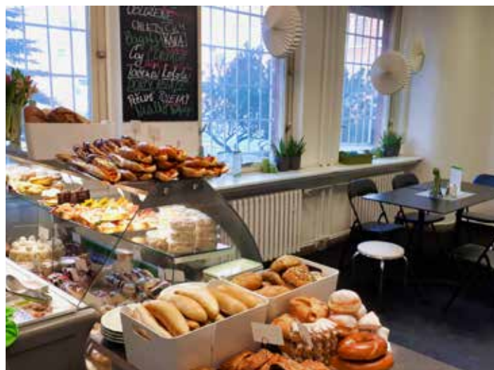
Nové bistro v nemocnici.

Dubnová rekonstrukce bistro zvětší a dodá prostorám modernější a atraktivnější vzhled. Chybět nebude ani velmi žádané venkovní posezení. [dl]