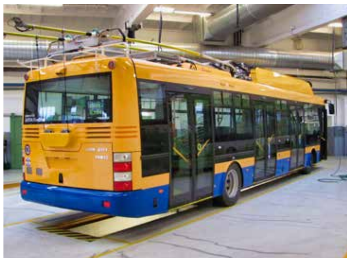
Trolejbus 30 Tr je nízkopodlažní a klimatizovaný.

sedmi nových trolejbusů a ani ten ještě DSZO nepřevzala do svého vozového parku. Bude jej několik týdnů využívat v dílnách a mimo pravidelné linky MHD jen pro školení pracovníků údržby a řidičů. Ze Škody Electric budou postupně dodávány další vozy. [dp]