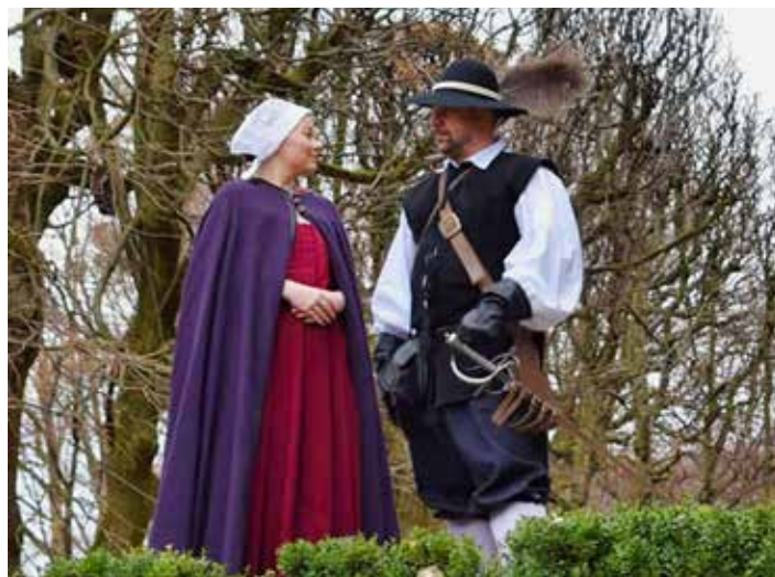
Dobové kostým z 30leté války.

výčet souboru ukázek, které návštěvníky skrze „herce“ vtáhnou do doby počátku 20. století. „Jakmile ale přičichnete k tomu koníčku, chcete mnohem víc,“ tvrdí jedna z členek spolku. Na základě dlouhých debat a rozmýšlení sdružení rozšířilo svoje působení i do jiných století, a to do doby 30leté války (1618-1648) a okrajově také do středověku. V rukou mužů tak ožívají kordy, meče a muškety a v rukou krásných žen se zase z obyčejných potravin rodí na ohni dobové pokrmy nebo ručně šijí do-