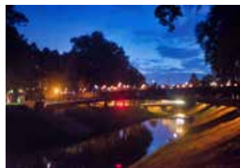
Živý Zlín.

Na své si přijdou všechny věkové skupiny – rodiny s dětmi, mladí lidé i senioři. Milovníci hudby, čtení nebo aktivní sportovci. „Aktuálně je do projektu Živý Zlín pořadatelky zapojeno sedmáct organizací, komunit nebo jednotlivců. Podmínkou zůstává, že aktivity vnášejí život do veřejných míst našeho města – do parků, mezi baťovské domky, na sídliště, do místních