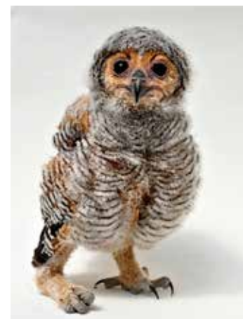
Mládě puštíka.

ra čabrakového, mláďata nesyta indomalajského, pižmoky bělokřídlé, toka žlutozobého (jediný světový odchov v roce 2018) nebo nesyta bílého. Cenné jsou odchovy u dželad, kudu velkého, prasete savanového, hyeny skvrnitě, supy mrchožravého a bělohlavého, zoborožce hvízdavého, marabu afrického nebo plameňáka růžového. Všechno však nevycházelo podle předpokladů. „Na začátku léta jsme očekávali porod slonice Zoly, mládě se bohužel narodilo mrtvé. V případě prvorodiček to však není neobvyklý jev. Slonice tím ale získaly velkou zkušenost, Zola tak má všechny předpoklady stát se v budoucnu chovnou samicí,“ uve-