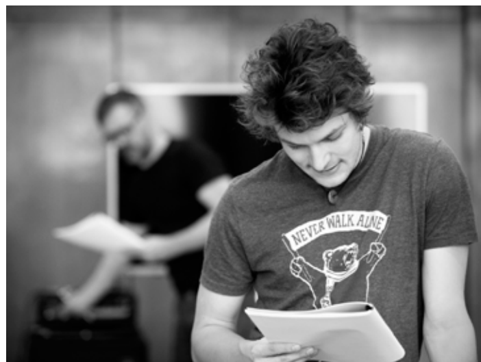
Připravuje se česká a slovenská premiéra muzikálu.

Tradiční akci pořádá „Spolek Lešetín Zlín“ ve spolupráci s Hospůdkou U Kovárny a hotelem Baltaci. Akci podporuje statutární město Zlín. [io]