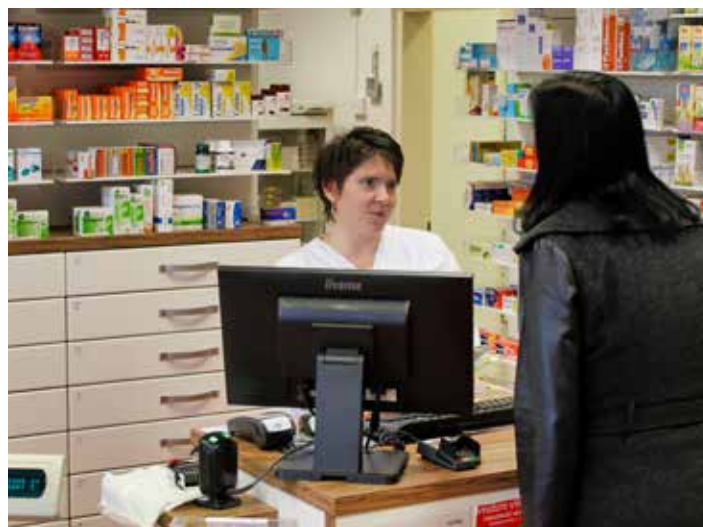
Lékárny čeká zvýšený nápor, je tu čas chřipek a nachlazení.

V loňském roce začala ve Zlínském kraji chřipková epidemie koncem ledna. [dl]