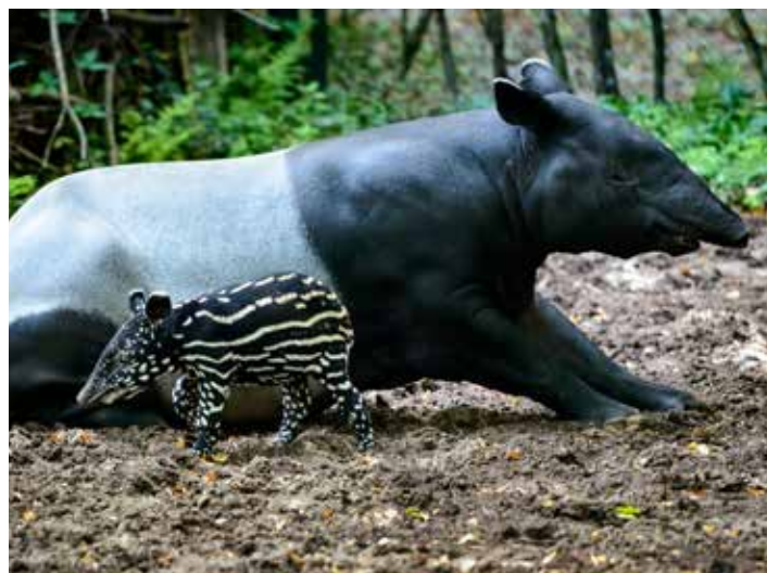
Tapir čabrakový s mládětem, další chovatelský úspěch.

opravdu jen pár minut,“ dodala vedoucí oddělení marketingu. Velké přízni návštěvníků se stále těší roční permanentní karty Zoo Zlín Family. Ty zlínská zoo nabízí od roku 2011. „Kartu Zoo Zlín Family si v roce 2018 zakoupilo 3 100 zájemců, což je o 10 procent více než v roce 2017. Z tohoto počtu vybrat více než polovina připadá na karty rodiče a děti, zakoupení roční karty se u pětičlenné rodiny vyplatí již při druhé návštěvě,“ řekla Romana Bujáčková . „Nesmírně si ceníme dlouhodobé přízně všech návštěvníků, partnerů a sponzorů. Vážíme si podpory zřizovatele zoo, statutárního města Zlína, a představitelů Zlínského kraje. Chtěl bych všem upřímně poděkovat a pozvat je i letos na návštěvu zoo. Stejně tak patří velký dík za spolupráci mým kolegům v zoo,“ doplnil ředitel Roman Horský .