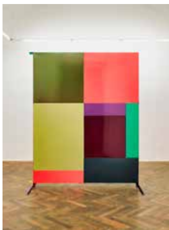
Z výstavy G. Kristófa.

Napětí dané protikladnými silami výroby a tvorby bude na výstavě reprezentováno nejen samotným použitím zmíněné technologie, ale i způsobem instalace, který by se měl vymykat konvenčním představám o galerijní prezentaci obrazu. Vernisáž výstavy se koná 14. února v 18 hodin, samotná výstava potrvá do 21. března. Více na www.kabinet.cz . [io]