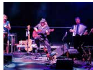
Kapely? Rozhodne hlasovani. / foto: ZFF

Více informací i pravidla soutěže na www.zlifest.cz . [km]