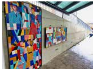
Reliéf je již instalován.

Do Obchodního domu Zlín se v pondělí 7. ledna po téměř dvou letech vrátil cenný keramický reliéf známého malíře a sochaře Vladislava Vaculky. Velkoformátové dílo z 60. let, které podle odborníků představuje jednu z prvních uměleckých realizací ve veřejném prostoru ve Zlíně, restaurátoři na jaře 2017 odborně sejmuli z interiéru budovy a uložili do depozitáře, aby tam bezpečně přečkalo generální rekonstrukci. Po jejím dokončení se Obchodní dům Zlín znovu otevřel návštěvníkům v listopadu.