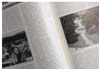
Původně byl černobílý.

Úkol potlačit politický vliv na obsah městského periodika se podařilo vyřešit založením nového orgánu nazvaného Redakční rada. V současné době má osm