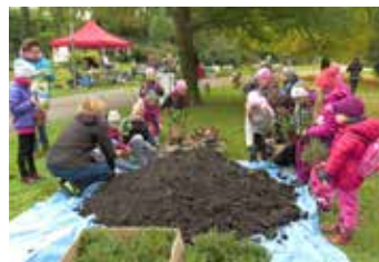
Pořádají se akce pro školky.