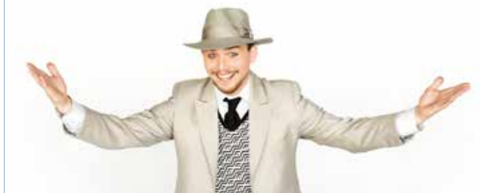
Předplatné bude v prodeji od 2. května.