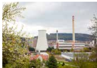
Teplu vyrábí ALPIQ Generation.

Hned několikrát byla letos ve Zlínském kraji a i přímo ve Zlíně vyhlášena smogová situace. Při pohledu na kouřící teplárenské komíny měli někteří lidé o viníkoví hned jasno. Pravda je však trochu jiná. I díky využívání tisíců zlínských domácností služeb Tepla Zlín, a. s., se naopak dařilo držet smogovou situaci relativně pod kontrolou.