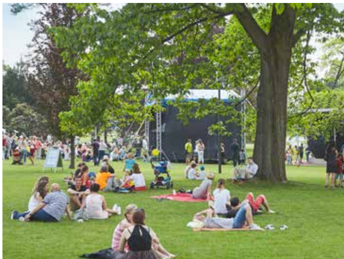
Park Komenského po rekonstrukci láká k odpočinku.