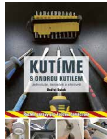
Rady pro celý dům a byt.

Publikace se na pultech knihkupectví objeví 1. května. [fab]