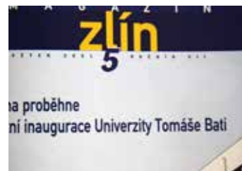
Obal z roku 2010.

Tak, jak měnil magazín obsah, vzhled i název, měnilo se i složení jeho redakce a posléze i redakční rady. Vždy v ní měli zastoupení pišící novináři, tedy praktici, kteří tvořili většinu textů a zajišťovali fotografie. Různé bylo naopak zastoupení politických představitelů města. Jestliže na počátku nebyli v redakčním týmu zastoupení vůbec, byla i volební období, kdy měli většinu a nechyběli mezi nimi ani primátoři. K zatím poslední významné změně v obsahu, vzhledu i fungování magazínu došlo v roce 2011. Kalice vzešlá z komunálních voleb na podzim předchozího roku se