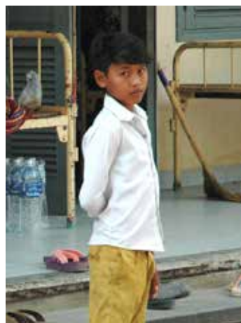
Malý pacient.

„Příbuzní hrají v péči o pacienta velmi důležitou roli. Zajišťují veškerou péči od jídla až po donesení nezbytného ventilátoru. Panuje tu chaos, pacient nemá žádné soukromí, ale na druhou stranu tady nenajdete opuštěného pacienta,“