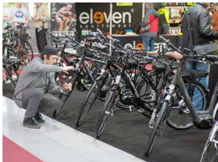
Veletrh navštěvuje 30 000 lidí.

Začátkem dubna se již po osmém otevřely brány největšího cyklistického veletrhu ve střední Evropě FOR BIKES v Praze. Po dobu tří dnů se prezentovaly významné firmy cyklistického byznysu, ale i jednotlivé turistické oblasti ČR a blízkého zahraničí. Nechyběli ani zástupci regionů Zlínského kraje a města Zlína.