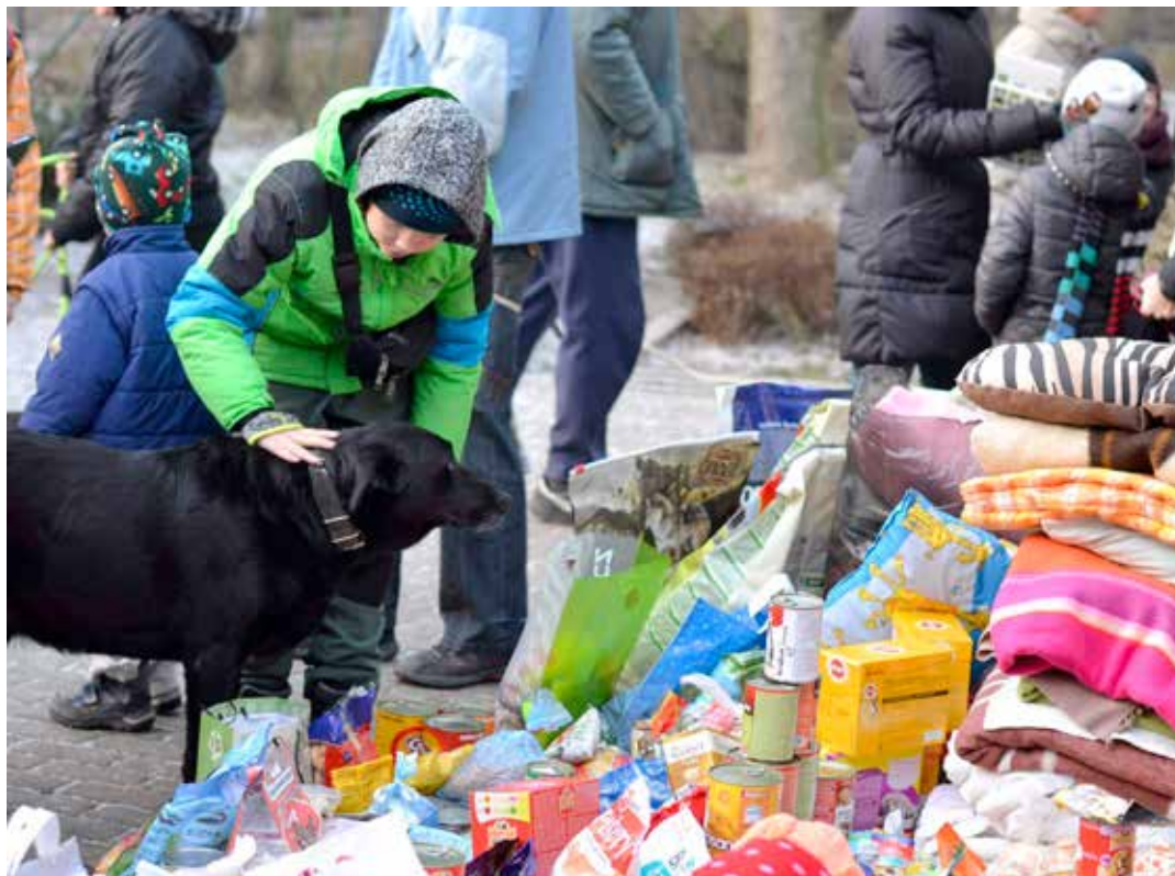
Pod správu odboru spadá i útluk pro zvířata. Na snímku jsou Vánoce v útulku.

Celkem dvacet čtyř zaměstnanců rozdělených do čtyř oddělení a jednoho střediska pracuje pod hlavičkou Odboru životního prostředí a zemědělství zlínské radnice. Vedoucí tohoto odboru, který sídlí v ulici Zarámí, je Vladimíra Pavlovová. Ve velké většině činností zastupuje tento odbor zájmy státu. Kontrolními a nadřízenými orgány jsou Odbor životního prostředí a zemědělství Zlínského kraje a Ministerstvo životního prostředí.