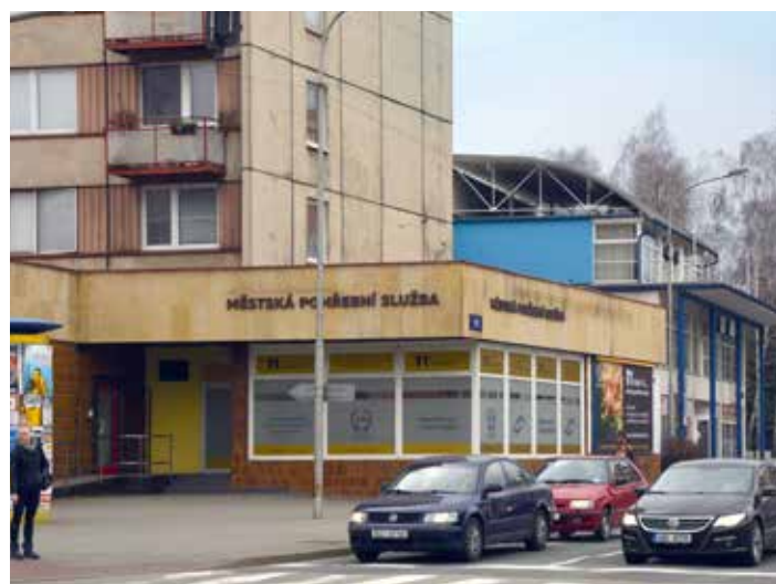
Pohřebnictví Zlín má pobočku na ulici Dlouhá.