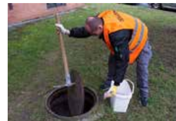
Pravidelná deratizace.