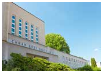
Evangelický kostel.

V sobotu 6. 5. 2017 v odpoledních a večerních hodinách proběhne ve Zlíně pilotní ročník GALLERY TOUR, akce spojující sedm kulturních subjektů, které představují veřejnosti současné umění a zlínskou architekturu: Galerii Kabinet T., která prezentuje současné české i zahraniční výtvarné umění, Evangelický kostel Zlín, významnou památku meziválečné sakrální architektury, v jehož prostorách se realizují výstavy zejména regionálních umělců – malířů, sochařů a fotografů, Infopoint baťovského bydlení, představující expozici možností baťovského bydlení, Hvězdárnu Zlín, ta svou galerijní činností poukazuje na rozmanitost současného umění, Photogether gallery, projekt studentů Ateliéru reklamní fotografie, GAG – zlínský nezávislý alternativní prostor a akční galerie pro