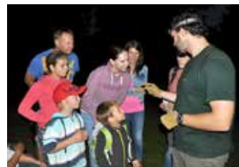
Výcházka za netopýry.