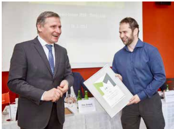
Cenu předával hejtman Jiří Čunek, za město ji převzal mluvčí Zdeněk Dvořák.

Výzkum zrealizovala agentura Datank. Ke Zlínu ve svém hodnocení píše, že mezi jeho silné stránky patří „především vysoký podíl podnikatelů, nejvyšší výdaje na podporu veřejné dopravy a vysoký počet studentů a učňů odborných škol, který indikuje dostatek kvalifikované pracovní síly“. Zlín se dlouhodobě snaží profilovat jako město vstřícné k podnikání a podnikatelům. „Vytváří pracovní místa, zaměstnávají lidi, vytváří hodnoty, odvádí daně. Je bezesporu v zájmu města, aby se zde podnikání dařilo,“ konstatoval primátor Miroslav Adámek. Jedině prosperující město má podle něj šanci na to, aby z něj lidé nejen neodcházeli, ale aby se vraceli zpět či se do něj přestěhovali odjinud za prací a bydlením. „To platí nejen pro Zlín, ale pro celý kraj. Perspektivu máme v současnosti dobrou, podle ekonomů region vykazuje druhý nejvyšší výkový růst, hned po Praze,“ sdělil