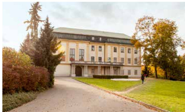
Nabídka akcí je velmi pestrá.

Galerie Václava Chada – nádherné výstavy: nyní obrazy spolužáka Václava Chada z Baťovy Školy umění ve Zlíně Miroslava Šimordy, dále architektonická výstava České domy a od 19. 5. do 18. 8. výstava Theodora Pištěka. [tz]