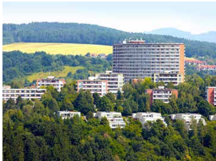
Služeb Tepla Zlín využívá polovina domácností Zlína.

Společnost Teplá Zlín, a. s., zajišťuje distribuci tepla cca šestnácti tisícům domácností Zlína, což představuje téměř polovinu obyvatel krajského města. Samotnou energii pak společnost Teplá Zlín, a. s., nakupuje od výrobce a provozovatele Zlínské teplárny, společnosti ALPIQ Generation (CZ), s. r. o. [fab]