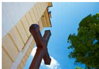
Kostel sv. Filipa a Jakuba.