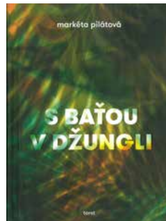
Titulní strana knihy.