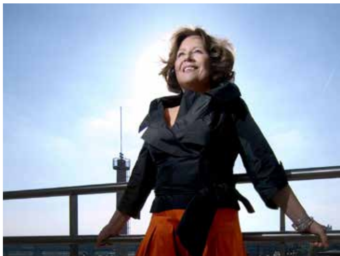
Oblíbená herečka Emília Vašáryová.

Chybět nebude ani pestrý doprovodný program, který je celý zdarma, koncerty a akce pro děti. Rodinám bude patřit celá sobota 20. května, divadelníci zvu hned od rána do parku za divadlem na originální snídani, rozvíčku pro nejmenší a na loutkové pohádky. Týdenní program uzavře koncert kapely Longital s unikátní videoprojekcí na nádvoří za divadlem. Festival Setkání Stretnutie se letos uskuteční podvaadvacáté a za dobu své existence přivítal několik stovek divadelních souborů z Česka, Slovenska, ale i z Polska, Maďarska nebo Rakouska. Zaměřuje se na novinky a na konfrontaci současné inscenační tvorby. Více na adrese www.setkanizlin.cz . [mdz]