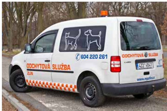
Odchyťový vůz MP Zlín má charakteristický polep.