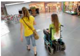
Doprovod asistentky.