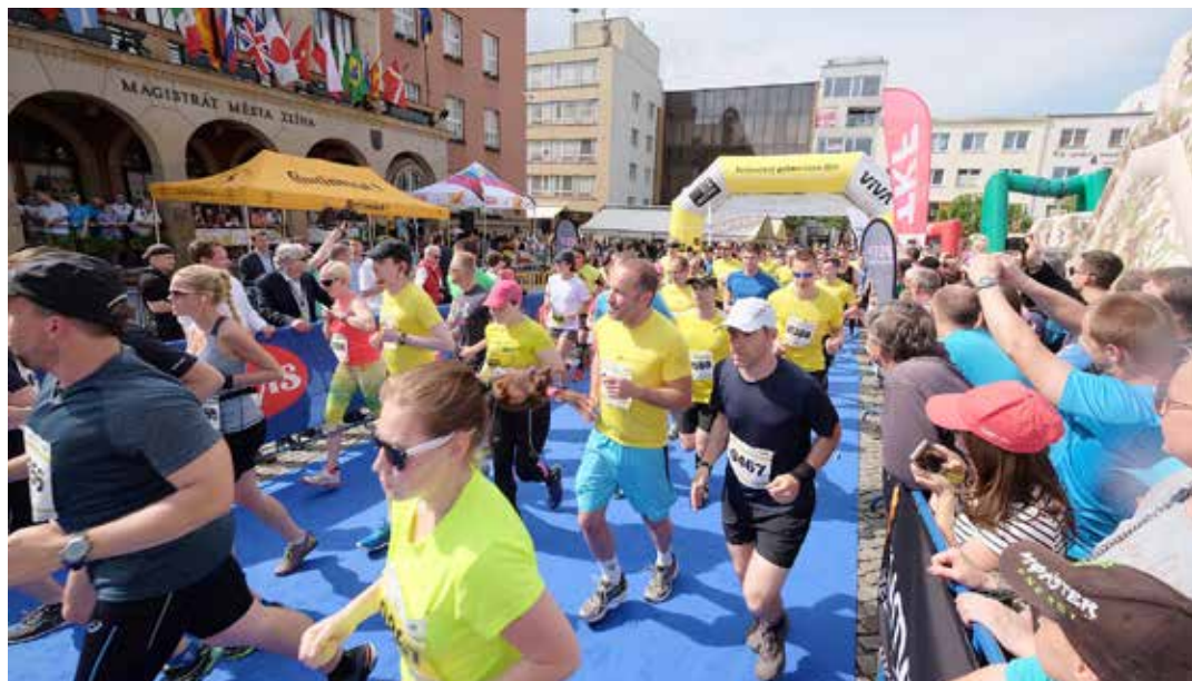
První ročník půlmaratonu měl velkou odezvu u běžců i diváků.