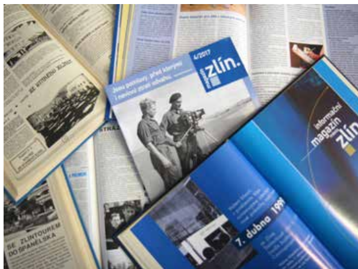
V průběhu let měnil městský časopis jak jméno, tak i vzhled.

Vážení spoluobčané, jedním z nejdůležitějších bodů volebního programu řady stran podílejících se na práci zvoleného Zastupitelstva města Zlína byl slib zajistit informovanost o počínání nových orgánů samosprávy. Proto se samozřejmě úsilí pracovníků zlínské radnice zaměřilo na rychlý vznik městských novin, jejichž první číslo vám dnes předkládáme. Psal se 15. březen 1991 a tímto sdělením na titulní straně město Zlín oznamovalo čtenářům, že pro ně začíná vydávat časopis. Jeho název, obsah, periodicitu i třeba vzhled se v průběhu let měnily a mění, nicméně tradice pokračuje. Až k současnému Magazínu Zlín. Dnešní číslo dostáváte v nové grafické podobě, což redakci přivedlo k myšlence maličko se ohlédnout za historii tohoto časopisu.