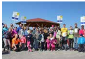
Odměnou bylo i opékání.