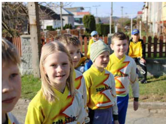
Mladí hasiči ze Štípy.

Sbor dobrovolných hasičů Štípa uspořádal již patnáctý ročník soutěže Závod požární všestrannosti. I díky krásnému počasí se v soutěži utkalo na 350 závodníků v kategoriích mladších a starších žáků. Na trati dlouhé cca dva km plnily pětičlenné hlídky postupné úkoly z topografie, požární ochrany, uzlování. Hlídky střídaly ze vzduchovky, překonávaly překážky po vodorovném laně a plnily úkoly ze základů první pomoci. A jak to dopadlo? V kategorii mladších žáků zvítězili mladí hasiči z Pohořelice, druhá byla Štípa a třetí opět Pohořelice. V kategorii starších žáků zvítězili domácí hasiči ze Štípy, druhé byly Zádveřice a třetí Dolní Bečva. [red]