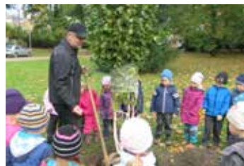
Děti se učí sázet stromy.