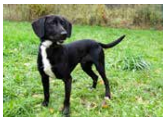
ALEX. / foto: útulek

BADY – kříženeček německého ovčáka a jezevčíka, 9 let, vhodný do rodinného domu, zvyklý na pobyt venku, dobrý hlídač a společník, v útulku už čeká 1,5 roku