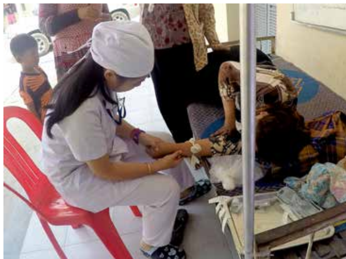
Lékaři si musí poradit i s provizorními podmínkami.

V rámci bohatého doprovodného programu se uskuteční tradiční soutěže, spojené s volbou krále a královny celého Majálesu o zajímavé ceny. [red]