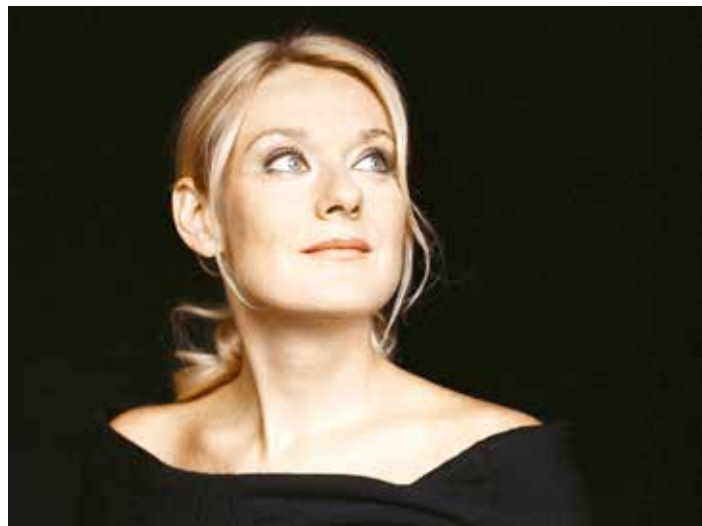
Magdalena Kožená míří do Zlína.

Závěrečný koncert v KCZ v 19.00 26. 5.– 3. 6. Divadelní zóna 57. ZFF [tz]