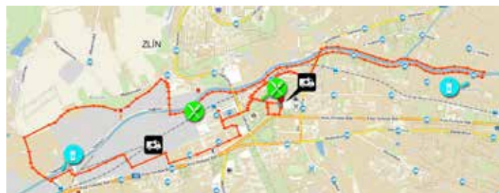
Mapa závodu v centru města.