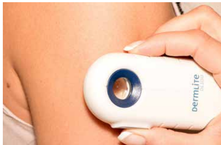
Vyšetření nepodceňujte.