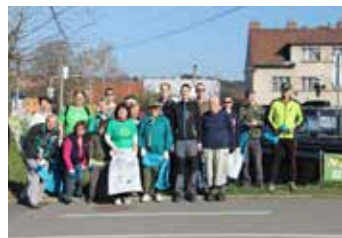
Dobrovolníci ze Zlínska.

Dobrovolníci také dostali na závěr obcerstvení, diplomy a drobné dárky. [fab]