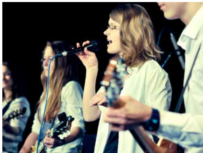
Živý Zlín patří ke kolorytu města, je stále bohatší.