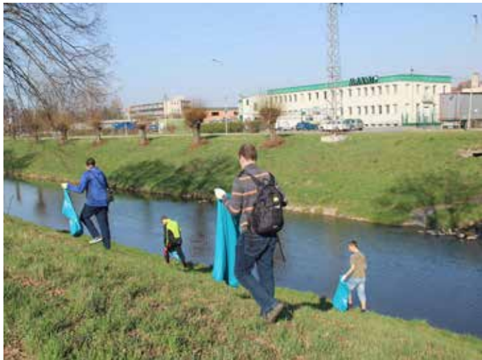
Kromě cyklostezky uklidili lidé i břehy Dřevnice.